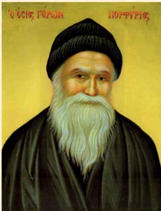
Έργο τοῦ ἀγιογραφείου τῆς Ἱ. Μονῆς Χρυσοπηγῆς Χανίων.