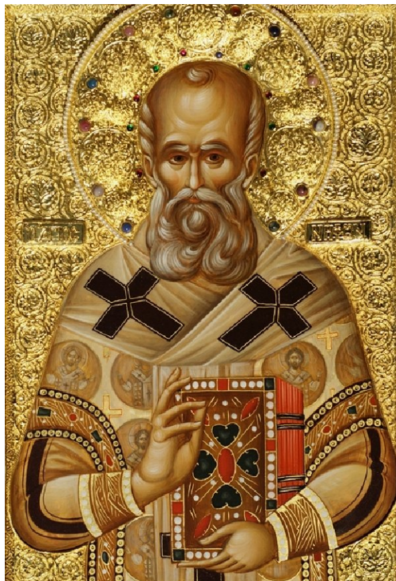
Ἅγιος Νήφων, Πατριάρχης Κωνσταντινουπόλεως.

Τό μαρτυρικό τέλος τοῦ Ὁσιομάρτυρος Μακαρίου, πού ἐπῆλθε τό ἔτος 1507, ἐγνωστοποιήθηκε στόν Πατριάρχη Νήφωνα ἀπό τό Ἅγιο Πνεῦμα καί ἐκεῖνος τό ἀνεκοίνωσε στόν μαθητή του μοναχό Ἰωάσαφ, λέγοντάς του: «Σήμερα, τέκνον, ἐτελειώθηκε ὁ Μακάριος καί συνάδελφός σου διά τοῦ μαρτυρίου καί ὑπάγει νά ἀγάλλεται στούς οὐρανοῦς».