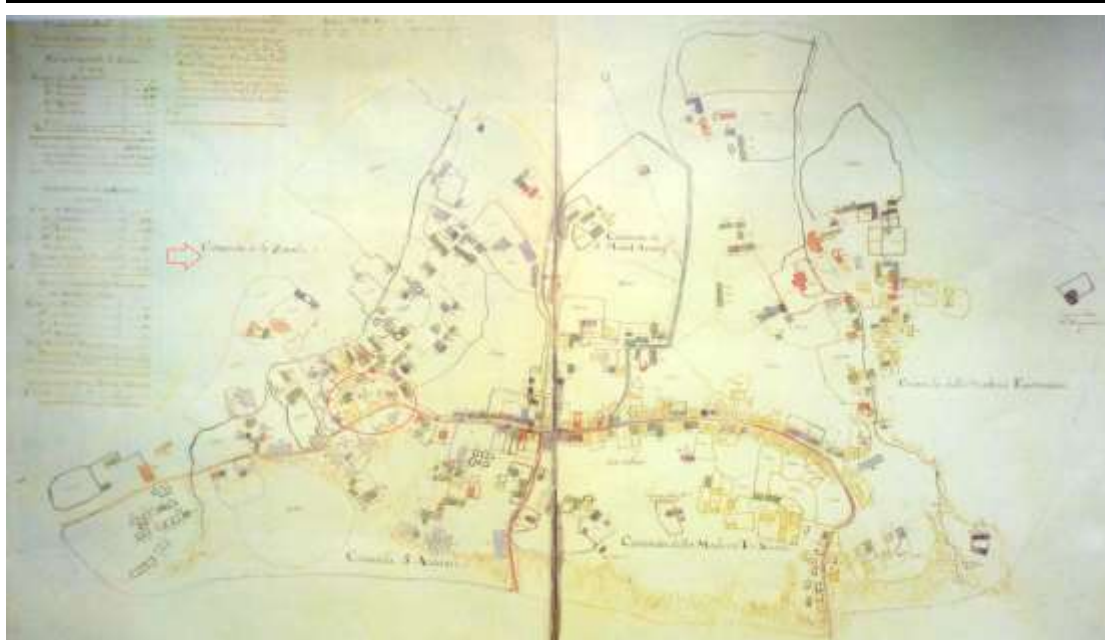
ΕΙΚΟΝΑ 1: ΧΑΡΤΗΣ ΤΗΣ ΒΟΣΤΙΤΣΑΣ ΤΟΥ 1700. (Τò σημείο πò ò βρισκόταν ó Άγιος Γεώργιος εἶναι κυκλωμένο)