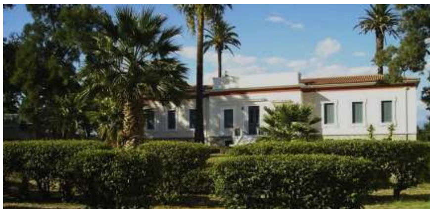
ΕΙΚΟΝΑ 6: ΤΟ ΠΑΛΑΙΟ ΝΟΣΟΚΟΜΕΙΟ ΑΙΓΙΟΥ, ΝΥΝ ΠΟΛΙΤΙΣΤΙΚΟ ΚΕΝΤΡΟ