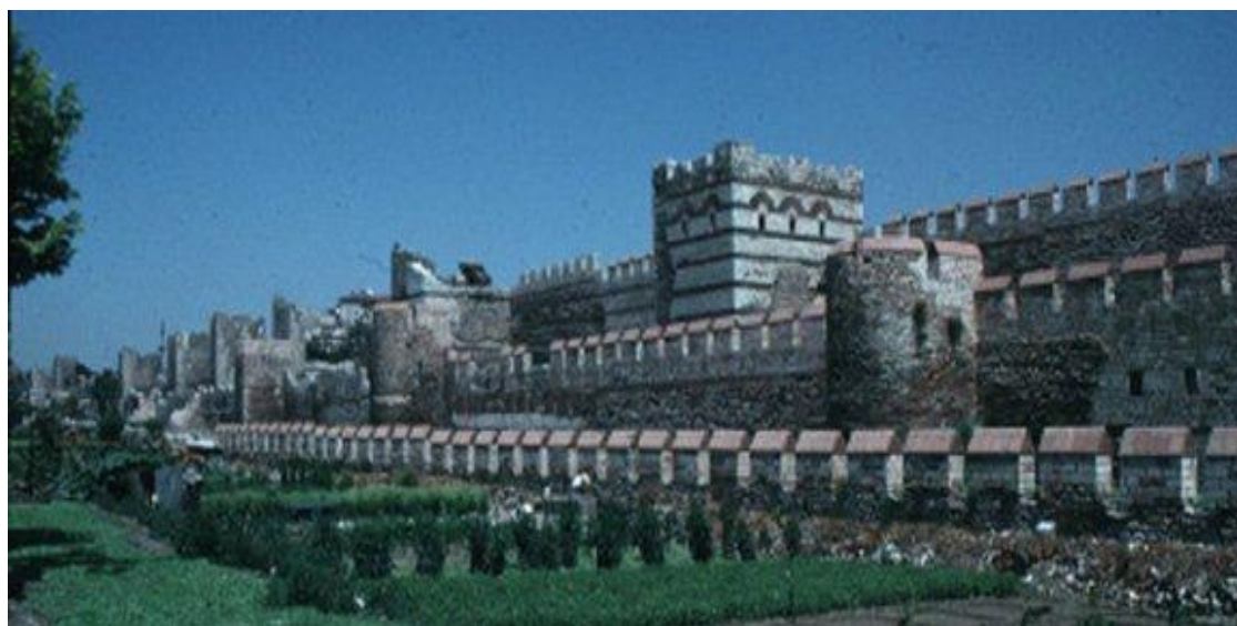
(Ηλεκτρονική αναπαράσταση του τείχους της Κωνσταντινούπολης από την UNESCO)