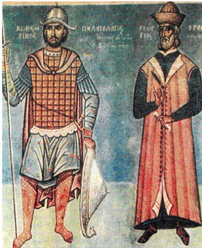
Αυτοκράτορας Κωνσταντῖνος Παλαιολόγος καὶ Γεώργιος Σφραντζής.

Καλὸν ἦν μοι, εἰ οὐκ ἐγεννήθην, ἢ παιδίον ἀποθανεῖν. Ἐπειδὴ τοῦτο οὐκ ἐγένετο, ἰστέον ὅτι ἐν ἔτει ϸϿϿθ-ω ἐγεννή- θην, Αὐγούστω λ', ἡμέρᾳ τρίτῃ· ἀνεγεννήθην δὲ ὑπὸ τῆς ὀσιωτάτης καὶ ἀγίας Θωμαΐδος, περὶ ἧς ἐν τῷ προσήκοντι τόπῳ μέλλομεν διηγῆσθαι τὰληθές.