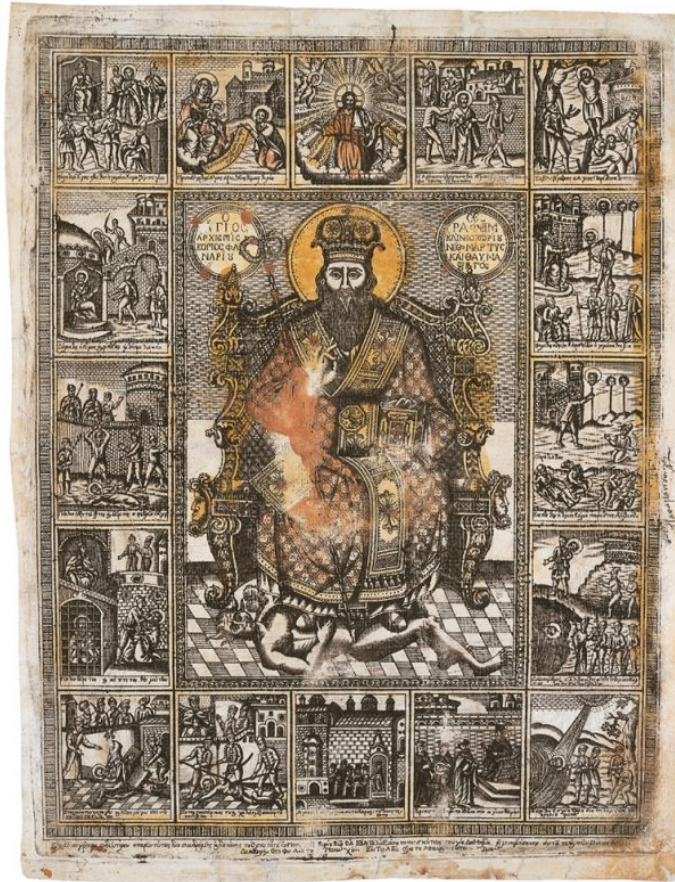
Χαλκογραφία με σκηνές του βίου του Αγίου

Τὰ Ἄγραφα δὲν ἀνέδειξαν μόνον ἀρματωλοὺς καὶ κλέφτες ἀλλὰ καὶ μάρτυρες τῆς πίστεως καὶ τῆς πατρίδος καὶ ἁγίους, μεταξὺ τῶν ὁποίων τὴν πρώτη θέση κατέχει ὁ Ἅγιος Ἱερομάρτυς Σεραφεῖμ, Ἀρχιεπίσκοπος Φαναρίου καὶ Νεοχωρίου, ὁ θαυματουργός, μίᾳ ἀπὸ τῆς μεγάλων καὶ ἁγίων μορφῶν τῶν Ἑλλήνων νεομαρτύρων τῆς Ὁρθοδόξου τοῦ Χριστοῦ Ἐκκλησίας.