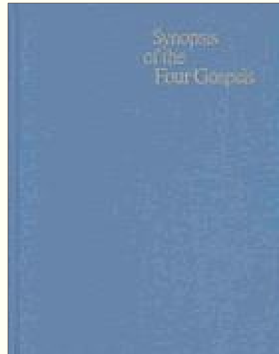
SYNOPSIS OF THE FOUR GOSPELS: GREEK-ENGLISH EDITION OF THE SYNOPSIS QUATTUOR EVANGELIORUM, on the basis of the Greek text of Nestle-Aland 27th edition KURT ALAND