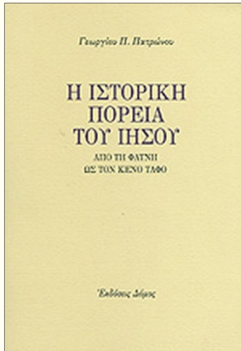
Η ΙΣΤΟΡΙΚΗ ΠΟΡΕΙΑ ΤΟΥ ΙΗΣΟΥ: ΑΠΟ ΤΗ ΦΑΤΝΗ ΩΣ ΤΟΝ ΚΕΝΟ ΤΑΦΟ ΓΕΩΡΓΙΟΣ Π. ΠΑΤΡΩΝΟΣ