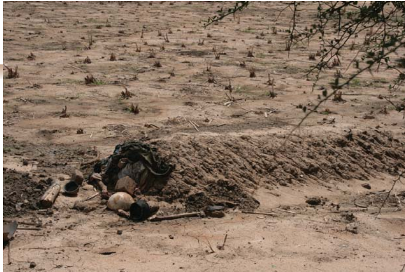
Ὁ τάφος τοῦ Γέρο-Νάγκ.