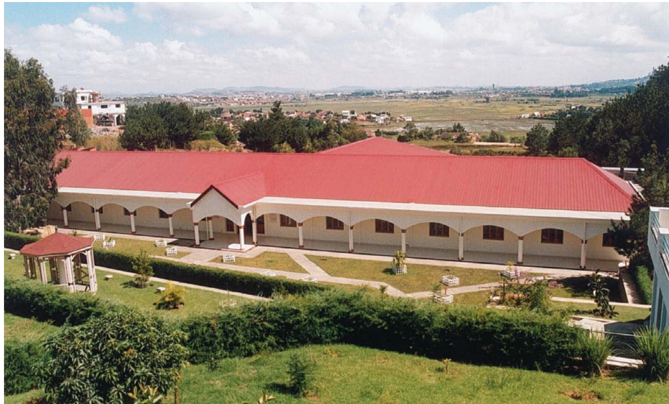
Τό κτίριο του Γηροκομείου της ιεράς Επισκοπής Μαδαγασκάρης στο Άνταναναρίβο.

γο Β. 160 • Μποζόπουλο Κ. 60 • Μπουρκούλια Κ. 60 • Μπουρσινού Β. 50 • Μώρη Θ. 1.000 • Μωυσίδη Ν. 50 • Ναθαναήλ Έ. 60 • Νικοηιδάκη Β. 100 • Ξενίτη Β. 30 • Παδουβά Ν. 650 • Παλαμίδα Λ. 100 • Παναγιωτοπούλου Μ. 20 • Παναγιωτουνάκο Γ. Σ. 50 • Πανούση Μ. 100 • Παντελή Δ. 230 • Παντζοπούλου Α. 90 • Παντογιού Π. 120 • Παπαβασιλείου Α. 20 • Παπαγεωργίου Γ. 200 • Παπαδέδε Α. 50 • Παπαδιά Μ. 30 • Παπαδογιαννάκη Σ. 200 • Παπαδόπουλο Κ. 60 • Παπαδοπούλου Α. 190 • Παπάζογλου Δ. 20 • Παπαθανασίου Α. 80 • Παπαθωμοπούλου Ί. 10 • Παπασαραντόπουλο Π. 40 • Παπαχριστόπουλο Γ. 30 • Παπούλια Β. 120 • Παππά Β. 300 • Παρασκευοπούλου Α. 20 • Παρδαλή Α. 20 • Πασσά Χ. 300 • Πασσαλοούκα Ί. 115 • Πατούνα Έ. 120 • Πατρικαλάκη Χ. Τ. 45 • Πατρινού Ε. 50 • Πατσαχάκη Σ. 20 • Παυλίδου Έ. 50 •