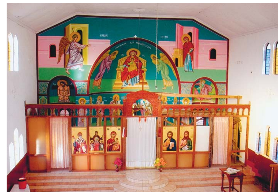
Τὸ ἔσωτερικὸ τοῦ ναοῦ ἁγίας Σοφίας στὸ Κιπούσι, Λουμουμπάσι Κογκό.

20 • Κώστης Ἰ. 53,45 • Κωφοῦ Ἐ. 15 • Λαζαρίδης Ἀ. 100 • Λάκκας Σ. 300 • Λαπιώτης Ἐ. 150 • Λασπούλα Ἐ. 30 • Λιάκου Π. 2.000 • Λιάνα Ὁ. 300 • Λιανδρῆ Γ. 240 • Λιανοῦ Κ. 30 • Λιάπης Ν. 10 • Λιβάνης Ἰ. 100 • Λιβιεράτος Δ. 50 • Λιμάκης Μ. 20 • Λίτσας Π. 50 • Λουδάρος Ἐ. 100 • Λουκάκης Π. 100 • Λουκοπούλου Ρ. 500 • Λούντζης Α. 300 • Λυκοπάντης Ἐ. 200 • Μαγγίνης Ἐ. 50 • Μαγείρης Ἀ. 50 • Μαγκλιβέρας Σ. 500 • Μάκης Κ. 150 • Μακρανδρέου Ἀ. 15 • Μακρῆς Σ. 50 • Μακρῆς Φ. 300 • Μανιάτης Γ. 100 • Μαντέλης Γ. 150 • Μανώλης Σ. 20 • Μαραγιάννης Ν. 35 • Μαργαρίτης Κ. 105 • Μαργέλης Π. 150 • Μαρῆ Δ. 300 • Μαρίνου - Ξανθοῦ Ν. 100 • Μαστίχης Ἀ. 200 • Μασσακούλης Β. 146 • Μασσιώτης Ἐ. 80 • Μαυράκης Ν. 200 • Μαυραντώνης Ἐ. 200 • Μαυροπούλου Α. 50 • Μελισσάρης Ἐ. 40 • Μέμμος Ἐ. 30 • Μεράντζης Ἐ. 20 • Μήλιος Σ. 10 • Μικρόπουλο Γ. 100 • Μιχαηλίδης Ν. 120 • Μιχαηλῆς Ἀ. 30 • Μιχαηλῆς Α. 10 • Μονὴ Ἅγ. Νικολαίου 30 • Μονὴ Βατουμά 50 • Μουρελιᾶτος