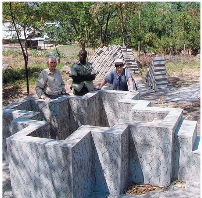
Νεόδμητο σταυροειδές Βαπτιστήριο