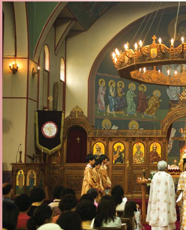
Ὁ Σεβ. Μητροπολίτης Κορέας κ. Ἄμ...

Εὐρισκόμενος ἐνώπιον τοῦ ἁγίου Θυσιαστηρίου στήν καρδιά μου ἐπικρατοῦν αἰσθήματα φόβου καί βαθύτατης εὐχαριστίας. Ὁ φόβος προέρχεται ἀπό τή μεγάλη εὐθύνη πού ἀναλαμβάνω ὡς διάκονος τῆς Ἐκκλησίας τοῦ Χριστοῦ. Καί ἀποδέκτες τῶν αἰσθημάτων εὐχαριστίας μου εἶναι ὅλοι ὅσοι μέ