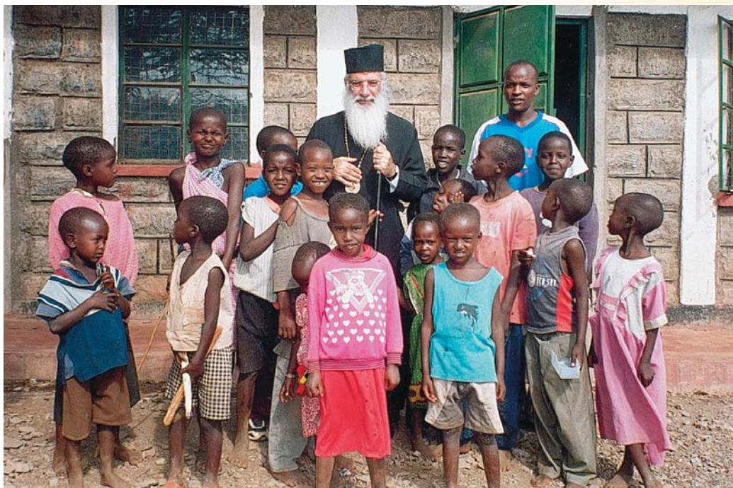
Ὁ Σεβ. Μητροπολίτης Κένυας κ. Μακάριος μέ τά παιδιά τῶν Μασάι

Ἀπό τό ὑπό ἔκδοση βιβλίο τοῦ Σεβ. Μητροπολίτου Κένυας κ. Μακαρίου «Μαρτυρίες ζωῆς», τόμος 3.