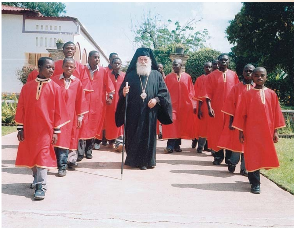
Ὁ Θεοφιλέστατος Ἐπίσκοπος Κατάγκας κ. Μελέτιος μέ ἱεροψαλιτες τοῦ Kolwezi

Μεταξύ τῶν ἐργασιῶν πού ἀκολουθοῦν στή ζωὴ τῆς ἱεραποστολῆς μας εἶναι ἡ καλοκαιρινὴ συγκομιδὴ τῆς μεγάλης φάρμας Lwankonko, ὅπου προσφέρεται ἡ δυνατότητα ἐργασίας σέ 170 ἄπορες γυναῖκες, πού συμμετέχουν στή συλλογὴ τῶν καρπῶν. Κατόπιν θά ἀκολουθήσουν οἱ δραστηριότητες πού πραγματοποιοῦνται κατὰ τοὺς θερινοὺς μῆνες, δηλαδή ἡ ἐτήσια σύναξη τῶν ἱερέων καί διακόνων, τῶν νεαρῶν ἱεροψαλιτῶν πού ἔρχονται γιά νά συμμετά-