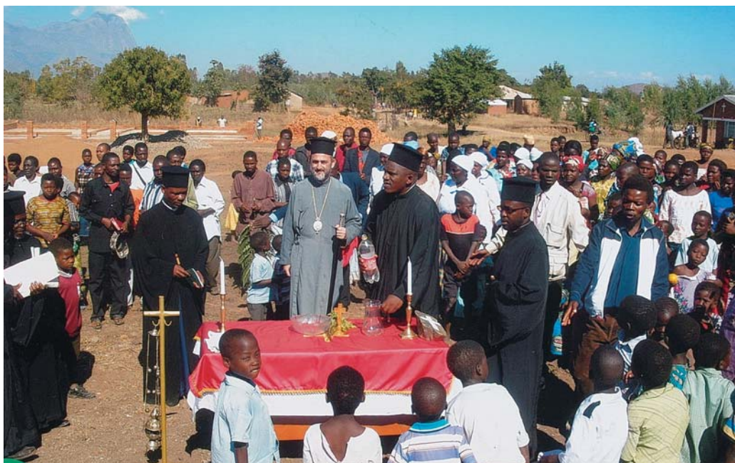
Έγκαίνια σχολείου στο Μαλλάου από τόν Σεβ. Μητροπολίτη Ζάμπιας καί Μαλάου κ. Ίωακείμ

Καραολάνη Κ. 100 • Καρασακαλίδη Μ. 50 • Καρδάρα Ά. 100 • Καρουζάκη Κ. 50 • Καρύδη Ε. 50 • Καταχιώτου Μ. 50 • Κατηφόρη Χ. 50 • Κατηχ. Σχ. Ι.Ν. Άγ. Γεωργίου 100 • Κατηχ. Σχ. Όσίων Μετεωριτών Πατέρων 100 • Κατιδενίου Ν. 30 • Καφετζοπούλου Έ. 130 • Κεκάκη Μ. 30 • Κεραμιδάρη Π. 30 • Κιάκη Π. 100 • Κοζιώρη Ά. 50 • Κολλιοπούλου Χ. 50 • Κομαρίνα Ί. 50 • Κονδύλη Ί. 50 • Κορακιανίτου Ά. 300 • Κορνάρο Χ. 50 • Κορρέ Π. 15 • Κοσμά Σ. 20 • Κουζαγιώτη Χ. 130 • Κούλη Ά. 150 • Κούλη Ί. 200 • Κουλοπούλου Έ. 300 • Κουλουμπή Φ. 115 • Κουνιάκη Ί. 100 • Κουπαράνη Σ. 100 • Κουρεϊλίδου Έ. 20 • Κουρεϊλίδου Ί. 20 • Κουσσουνάδη Μ. τοΰ Ί. 100 • Κουτογιάννη Δ. 200 • Κουτσιούρη Γ. 70 • Κρεζιά Έ. 50 • Κρενδρόπουλο Γ. 150 • Κρουστάλλη Β. 100 • Κυπριωτάκη Κ. 50 • Κυριαζοπούλου Σ. 200 • Κυριακίδη Ά. 30 • Κυριακού Ί. 100 • Κυψέλη Σ.