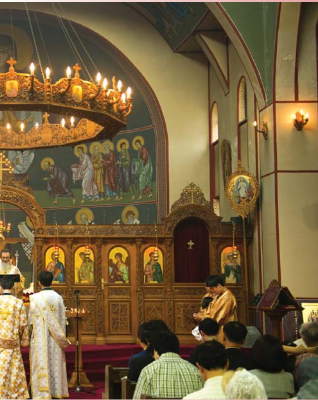
Βρόσιος προσφωνεί το νέο διάκονο

Μετά την Βάπτισή μου αγωνίστηκα να βαδίζω στη ζωή μου ακολουθώντας το φως του Χριστού. Επίσης προσπάθησα πριν με σκεπάσει το σκοτάδι να απομακρυνθώ απ' αυτό. Βλέποντας αυτή την προσπάθειά μου ο Σεβ. π. Σωτήριος μου πρότεινε να εργασθώ στη νεοϊδρυθείσα τότε Ίερά Μητρόπολη Κορέας. Και αργότερα ο Σεβ. π. Άμβρόσιος μου ανέθεσε την ευθύνη του έκδοτικού οίκου «Korean Orthodox Editions» για την έκδοση ὀρθοδόξων βιβλίων και την κυκλοφορία του μεγάλου αυτού πνευματικού θησαυρού στην κορεατική κοινωνία.