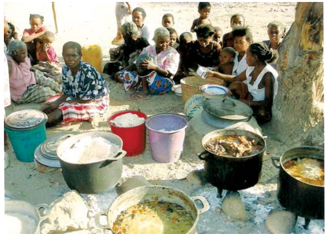
Ἡ προετοιμασία τοῦ γιορτινοῦ γεύματος

Εὐλόγια διατυπώνουμε τήν ἀπορία μας, ρωτώντας τους γιατί ἐξακολουθοῦν νά κατοικοῦν σ' αὐτά τά