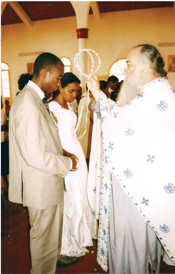
Ἐροθολῶντας τό Μυστήριον τοῦ γάμου

σφέρει γεῦμα ἀγάπης, μέ κρέας καί ρύζι σέ ὄλους τοὺς παρευρισκόμενους.