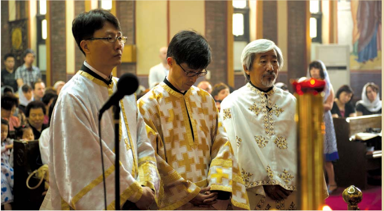
Πρό τῆς εἰσόδου στά ἐνδότερα τοῦ καταπετάσματος

καί δοῦναι τήν ψυχὴν αὐτοῦ ἡλύτρον ἀντί πολλῶν» (Μκ. 10,45). Τό πνεῦμα τῆς διακονίας, καθὼς γνωρίζεις, εἶναι ἀντίθετο μέ τό πνεῦμα τοῦ κόσμου. Γι' αὐτό ὁ Χριστός εἶπε στούς Μαθητές Του: «Οἱ ἄρχοντες τῶν ἐθνῶν κατακυριεύουσιν αὐτῶν καί οἱ μεγάλοι κατεξουσιάζουσιν αὐτῶν. Οὐχ οὕτως ἔσται ἐν ὑμῖν, ἀλλ' ὅς ἐάν θέλῃ ἐν ὑμῖν μέγας γενέσθαι, ἔσται ὑμῶν διάκονος, καί ὅς ἐάν θέλῃ ἐν ὑμῖν εἶναι πρῶτος, ἔσται ὑμῶν δοῦλος» (Μτ. 20,25-27). Αὐτό σημαίνει Ἰερωσύνη. Μιά διαρκῆς προσφορά τοῦ ἑαυτοῦ μας στόν Θεό καί στόν συνάνθρωπο. Μιά ἐμπρακτική καί συνεχῆς θυσιαστική ἀγάπη πρὸς τόν Θεό καί τόν πλησίον μας γιά τόν ἐρχομό τῆς Βασιλείας τοῦ Θεοῦ «ἐντός ὑμῶν» (Λκ. 17,21).