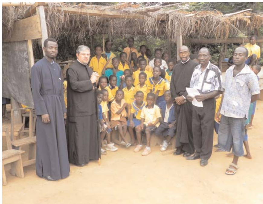
Μέ τους δασκάλους καί τους μικρούς μαθητές των φοινικοσκέπαστων παραπηγμάτων πού λειτουργούν ὡς αἰθουσες διδασκαλίας

ση. Στό σύντομο χαιρετισμό του τόνισε τόν ιδιαίτερο ρόλο τῆς πρεσβυτέρας στήν ἐνοριακή ζωή καί τῆς ζήτησε νά εἶναι πάντοτε τό φωτεινό παράδειγμα γιά τίς ὑπόλοιπες γυναῖκες.