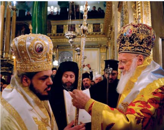
«Λάβε τήν Ράβδον, ἵνα ποιμαίνης...» Λαμβάνοντας τήν ποιμαντορική ράβδο ἀπό τά χέρια τοῦ Παναγιώτατου