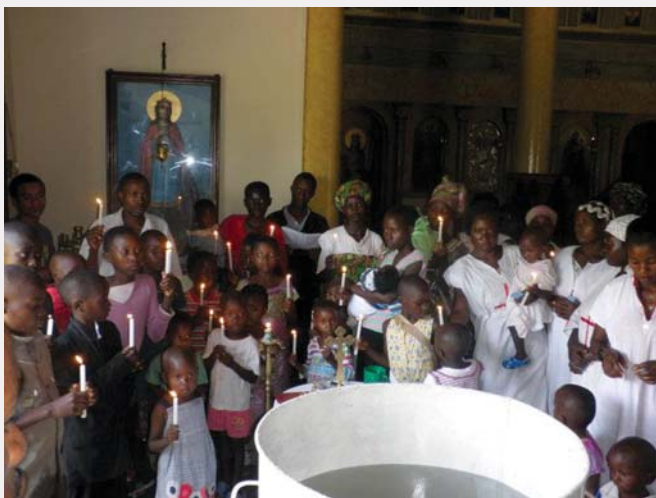
Νεοφώτιστοι πιστοί, ὄλων τῶν ἡλικιῶν, μετά τήν ὁλοκλήρωση τοῦ Μυστηρίου

Μέ πολλή ἀγάπη καί αἰσθήματα χριστιανικῆς ἀλληλεγγύης κάποιος Ὀρθόδοξος ἀδελφός μας, ὁ ὁποῖος ἐπιθυμεῖ νά παραμείνει ἀνώνυμος, διέθεσε χρήματα γιά νά ἀγοραστεῖ οἰκόπεδο στή Ρουάντα, στό ὁποῖο θά κτίσουμε τό πρῶτο Ὀρθόδοξο Ἱεραποστολικό Κέντρο, ὥστε νά ξεκινήσει τό ταχύτερο δυνατόν καί στή χώρα αὐτή ὁ εὐαγγελισμός τῶν ἀνθρώπων.