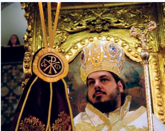
«Οὕτω λαμπράτω τό φῶς ὑμῶν ἔμπροσθεν τῶν ἀνθρώπων...» εὐλογώντας τούς πιστούς