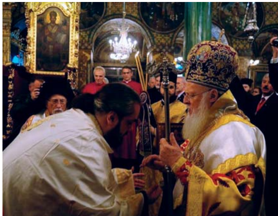
Παίρνοντας την ευχή του Οικουμενικού Πατριάρχη

ντική εργασία. Μέ τον καιρό συνειδητοποίησα ότι αυτές οι επισκέψεις δέν ήταν τίποτα άλλο παρά τό κάλεσμα τής Ἀγάπης στό τραχύ κι απότομο μονοπάτι τής Ιεραποστολῆς.