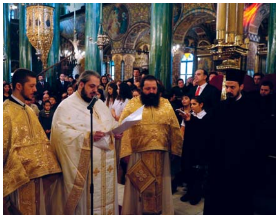
Ὁ νέος Μητροπολίτης κατά τή διάρκεια τής ὁμιλίας του

Ἐκεῖ διηκόνησα τήν Ἐκκλησία τοῦ Χριστοῦ, ἡ ὁποία παρά τήν ὑλική πτωχεία της εἶναι ζωντανή, ἀποκαλυπτική καί ὁδηγητική. Ἰκανή νά ἐκφέρει πρὸς κάθε κατεύθυνση λόγο ἀληθείας καί γνωρίζει νά διαλέγεται ἀδελφικά καί ταπεινά μέ τόν κάθε ἄνθρωπο μακριά ἀπό κάθε εἶδους ἀγκυλώσεις.