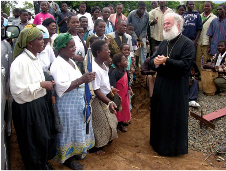
Ευχάριστες στιγμές επικοινωνίας με τους Ὁρθόδοξους πιστούς

ὄλους τούς παριστάμενους καί προκάλεσε θερμά χειροκροτήματα. Οἱ ἰθαγενεῖς ἀδελφοί μας προσέφεραν στόν Μακαριώτατο ξυλόγλυπτα ἀντικείμενα, ἐνῶ ἐκεῖνος χάρισε στό Ναό ἕναν περίτεχνο σταυρό εὐλογίας καί ὑποσχέθηκε, μετά ἀπό σχετικό αἴτημα πού τοῦ ὑποβλήθηκε, νά βοηθήσει στήν ἀνέγερση τῆς κλινικῆς, πού θά κτισεῖ σέ χώρο τόν ὁποῖο θά παραχωρήσει τό κράτος στήν Ἐκκλησία.