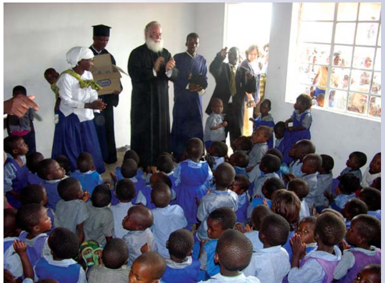
Ἐπίσκεψη σέ νηπιαγωγεῖο Ὁρθόδοξης ἐνορίας

Μετά τή θεία Λειτουργία, στίς ἐκδηλώσεις πού ἀκολούθησαν κάθε ἐνορία παρουσίασε αὐτοσχέδια τραγούδια καί παραδοσιακοῦς χορούς. Ἰδιαίτερο