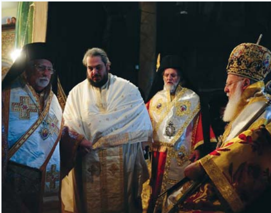
«Άγιοι Μάρτυρες, οί καλῶς ἀθλήσαντες...»