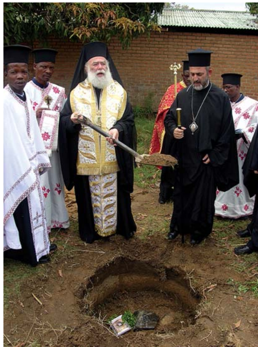
Θεμελιώνοντας τόν Ἱερό Ναό τῆς Γεννήσεως τοῦ Χριστοῦ στό Blantyre

Στίς ἐκδηλώσεις πού ἀκολούθησαν πρωταγωνίστησαν οἱ μαθητές τοῦ Ὁρθόδοξου σχολείου. Ἡ χορωδία καί μιά αὐτοσχέδια ὀρχήστρα ξεσήκωσε