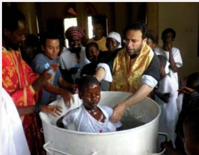
Ὁ Θεοφιλέστατος Ἐπίσκοπος Μπουρούντι καὶ Ρουάντας κ. Σάββας τελεῖ τὸ Βάπτισμα

Μ έ τή χάρη τοῦ Θεοῦ καί τίς εὐλογίες τοῦ πνευματικοῦ μας πατέρα, Μακαριωτάτου Πατριάρχου Ἀλεξανδρείας καί Πάσης Ἀφρικῆς κ. Θεοδώρου Β', προχωροῦν τά βήματα τοῦ ιεραποστολικοῦ ἔργου στήν πολυβασανισμένη χώρα τοῦ Μπουρούντι.