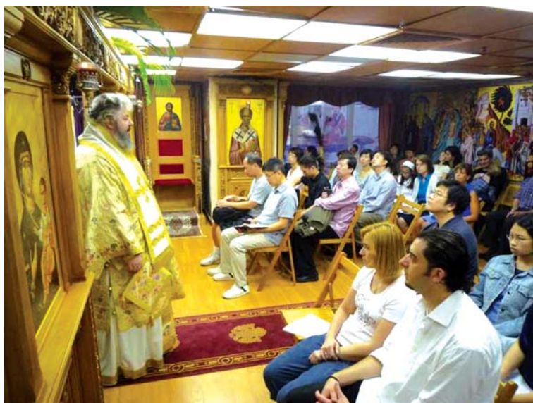
Ὁ Σεβ. Μητροπολίτης Χόνγκ Κόνγκ κ. Νεκτάριος καί Ὁρθόδοξοι πιστοί κατά τή διάρκεια τῆς θείας Λειτουργίας στόν Ἱερό Ναό τοῦ Ἁγίου Λουκά

Σήμερα μετά ἀπό δεκαπέντε χρόνια συνεχοῦς παρουσίας καί προσφορᾶς, ἡ Ἱερά Μητρόπολη ἔχει ἰδρύσει σαράντα ἐπτά Ὁρθόδοξες Κοινότητες σέ διά-