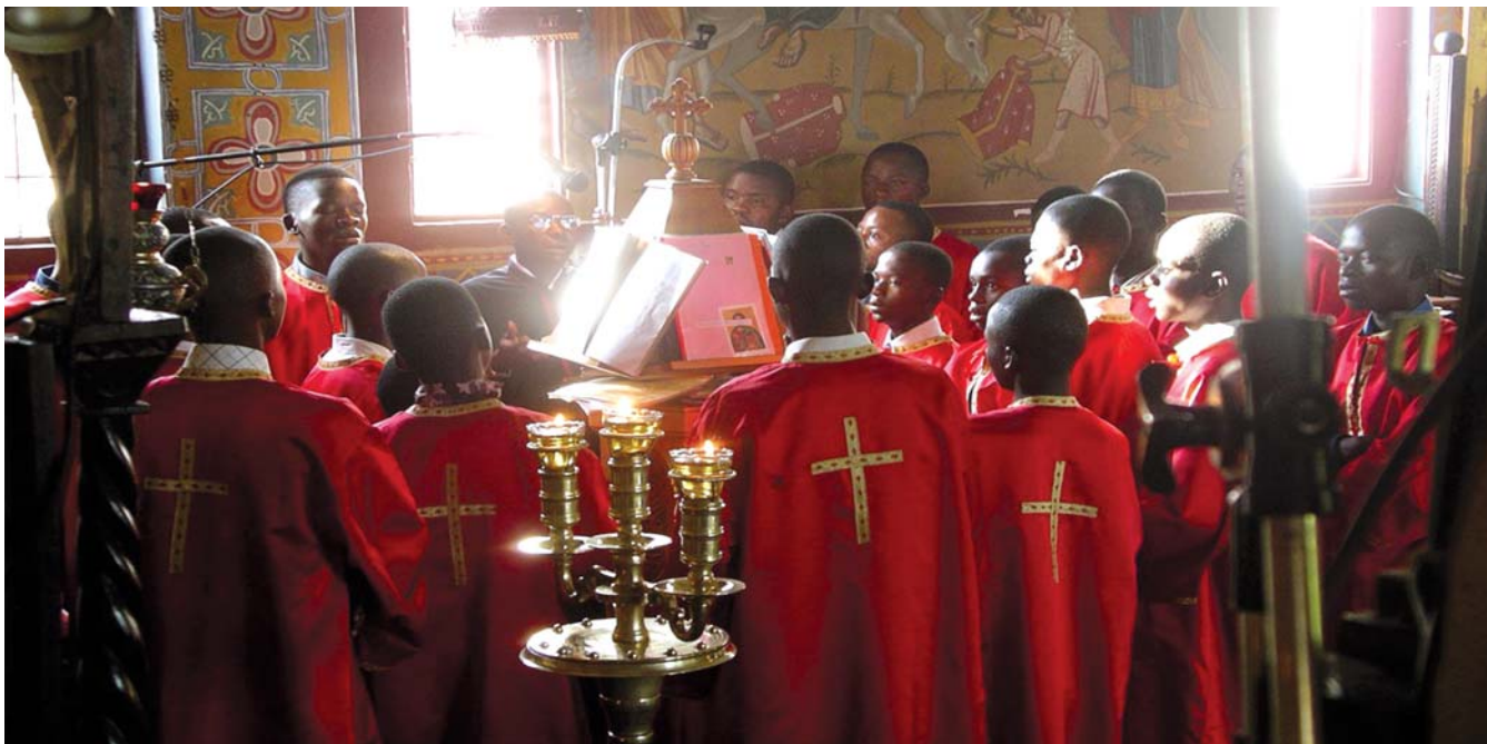
Ἄφρικανοὶ ἱεροψάλτες πηλασιῶνουν τό ἀναλόγιο κατά τήν ὥρα τῆς Λατρείας

Δέν θά παύσω νά χαίρομαι καί νά ἰλέω: ὦ! αὐτές οἱ φωνές! Οἱ φωνές αὐτῶν τῶν ἐπίγειων ἀγγέλων, πού γνωρίζουν νά ὕμνοῦν καρδιακά τόν Πλάστη καί