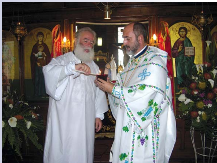
Ὁ Μακαριώτατος μέ τόν Σεβ. Μητροπολίτη Ζάμπιας κ. Ἰωακείμ κατά τήν τέλεση τῶν ἐγκαινίων τοῦ Ναοῦ τοῦ Ἁγίου Νεκταρίου

Ἀπό τήν Ἱερά Μητρόπολη Ζάμπιας καί Μαλάουι