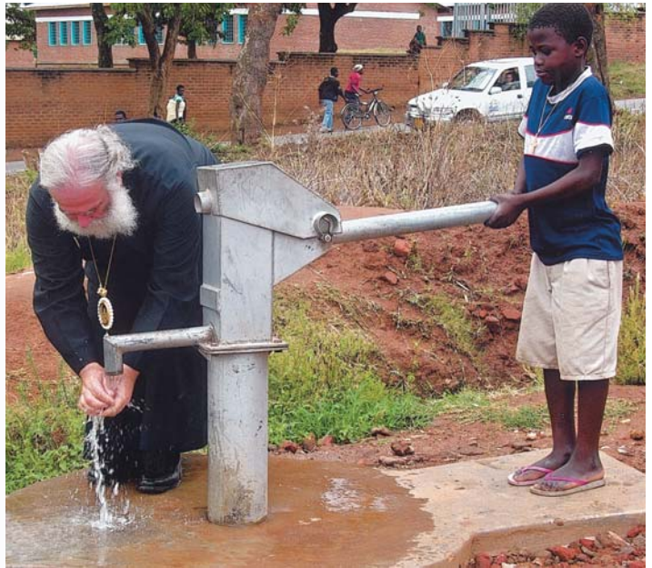
«Δός μοι πιεῖν» (Ἰω. δ', 8). Μικρός Ἀφρικανός προσφέρει νερό στόν Πατριάρχη

Μέσα σέ κατανυκτική ἀτμόσφαιρα, τήν Κυριακή 16 Ὀκτωβρίου, ὁ Πατριάρχης ἐγκαινίασε τόν Ἱερό Ναό τοῦ Ἁγίου Νεκταρίου Blantyre. Ὁ ἴδιος προσωπικά ἐξηγοῦσε στούς πιστούς τά τελοῦμενα κατά τή διάρκειά τῆς Ἀκολουθίας, κάνοντας