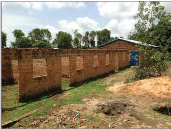
Οι εγκαταστάσεις της ανεγειρόμενης Τεχνικής Σχολής στην πόλη Κίντια

της πόλης. Έπισκέφθηκε, επίσης, τοπικά σχολικά συγκροτήματα και διένειμε στους μαθητές γραφική ύλη και γλυκίσματα. Σέ συνάντηση πού είχε μέ τό προεδρείο τοῦ συλλόγου τῶν φοιτητῶν τοῦ τοπικοῦ Πανεπιστημίου, ἐνημερώθηκε γιά τίς ἀνάγκες καί ἐλλείψεις τους, πού ἐστιάζονται κυρίως στή δημιουργία δανειστικῆς βιβλιοθήκης καί στή δυνατότητα πρόσβασης στό διαδίκτυο. Στους φοιτητές διανεμήθηκε χρήσιμη γραφική ὕλη καί τοὺς παραδόθηκαν μπάλες ποδοσφαίρου, εὐγενική χορηγία τοῦ ΟΠΑΠ, προκειμένου νά καλυφθοῦν οἱ ἀνάγκες τῶν φοιτητικῶν ἀθλητικῶν ὁμάδων.