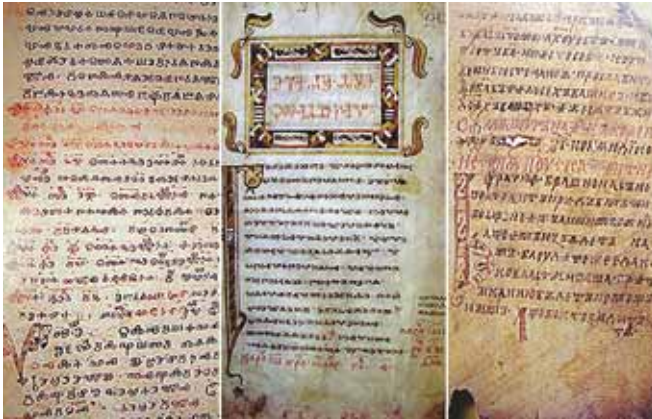
Χειρόγραφα διαφορετικῶν περιόδων καὶ θεμάτων, γραμμένα μέ τό κυριλλικό ἀλφάβητο (10ος καὶ 11ος αἰῶνας)