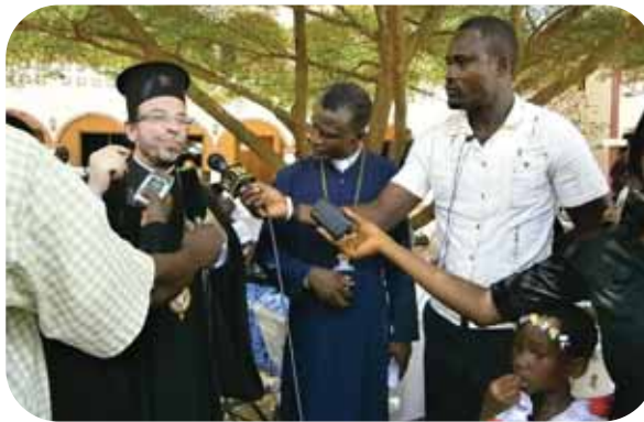
Δηλώσεις τοῦ Μητροπολίτη ἹΑκκρας στά τοπικά μέσα ἐνημέρωσης