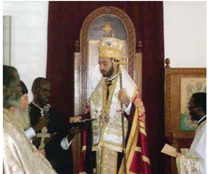
Ὁ νέος Ἐπίσκοπος ἱσταται «eis τύπον καί τόπον Χριστοῦ»

Τό ἐπιτελεσθέν ἔργο ὁμῶς τοῦ π. Θεολόγου δέν θά εἶχε φθάσει σέ αὐτό τό σημείο, ἐάν δέν ὑπῆρχε ἡ ἀνιδιοτελεῆ συναρωγή τῆς Ἀποστολικῆς Διακονίας