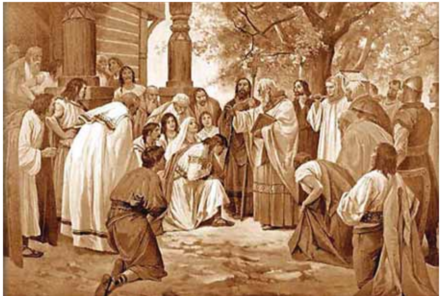
Γκραβούρα με θέμα τὸ κήρυγμα τῶν Ἁγίων στοὺς Σλάβους