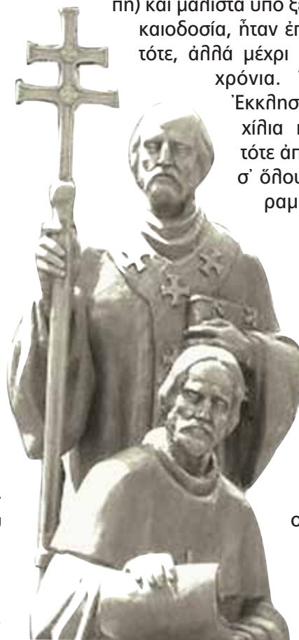
Μνημεῖο τῶν Θεσσαλονικέων ἀδελφῶν στὴν Πράγα

Ὁπωσδήποτε, οἱ ἅγιοι Ἀδελφοὶ ἄφησαν στοὺς Σλάβους κοινὴ κληρονομιά, τὴν παιδαιοσλαβικὴ γλῶσσα, ὡς κοινὴ λειτουργικὴ γλῶσσα. Ἀλλὰ καί μέρος τῶν μεταφράσεων τοὺς ὑπῆρξε κοινὴ κληρονομιά τῶν Σλάβων, ἀφοῦ