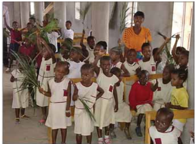
Μικροί μαθητές ὑποδέχονται μέ θερμές ἐκδηλώσεις τόν Μητροπολίτη τους

Ἐντός τοῦ Ναοῦ τά μικρά παιδιά τοῦ Δημοτικοῦ Σχολεῖου ἀπήγγειλαν ποιήματα καί τραγούδησαν, ἐνῶ ὁ Σεβ. κ. Γεώργιος τά εὐλόγησε καί τοὺς ἀπνύθυσε λόγια ἀγάπης καί πατρικές συμ-