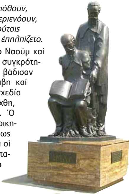
Γλυπτό μὲ ὁλόσωμες παραστάσεις τῶν ἀγίων Κυρίλλου καί Μεθοδίου στὸ Βελιγράδι

Τὸ ἀνωτέρω παράδειγμα τῶν τριῶν μαθητῶν τῶν δύο ἀγίων ἀδελφῶν δείχνει ὅτι ἡ θεία Πρόνοια εἶχε ἐτοιμάσει πιά τὸ καταφύγιο γιὰ τοὺς καταδιωγμένους ἀπὸ τὴ Μοραβία μαθητὲς καί τίς σλαβικές μεταφράσεις (ὅσες μπόρεσαν νὰ περισώσουν ἀπὸ τὴν καταστροφικὴ μανία τῶν διωκτῶν τους). Ἦταν ἡ Βουλγα-