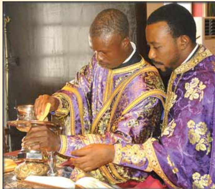
Ὁ διάκονος εἰσελθὼν πλεόν στά «Ἁγια τῶν Ἁγίων», συστέλλει τὰ Τίμια Δῶρα