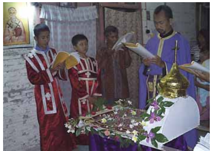
Μεγάλη Παρασκευή σὲ Ὁρθόδοξη ἐνορία τῆς Ἀσίας

44 • Γκρίλλη Ἀθανάσιο 20 • Γούλα Βασίλειο 10 • Γλυκιώτου Ἄντ. 50 • Γραμματικὸ Ἀλεξάνδρα 150 • Γραμματικὸ Πουλή Εὐαγγελία 30 • Γραμματικὸ Σουλτάνα 50 • Γραμμένο Κων/νο 20 • Γρίβα Μιχάλη 20 • Γρυδάκη Στέφανο 50 • Γυαλίστρα Διονύσιο 200 • Δαμιανὸ Ἀναστάσιο 50 • Δημητρακοπούλου Ἀντωνία 30 • Δημητρίου Νίκη 20 • Διακίδη Ἀγνή 10 • Διαμαντὴ Γκόλφω 30 • Διαμαντὴ Καλλιόπη 50 • Δοκμετζόγλου Ἐλισάβετ 20 • Δοξά Παναγιώτα 100 • Δουβλήδου Ἐλένη 150 • Δουβρὴ Ἀπόστολο 20 • Δριβήλη Γεωργία 70 • Δρόσου Γιαννούλα 20 • Ἐλπιδοφόρο Ἰωάννη 50 • Εὐθυμίου Οὐρανία 20 • Ζάρρου Μαρία 100 • Ζαχόπουλο Εὐάγγελιο 20 • Ζευγίτη Βασιλική 50 • Ζιώγα Εὐα 50 • Ζυγούρα Ἀνδρέα 10 • Ἡλιοπούλου Γεωργία 30 • Ἡλίου Ἐλευθέριο 30 • Ἰσυχαστήριο «ΑΓ. ΓΡΗΓΟΡΙΟΣ Ο