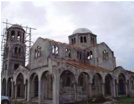
Ὁ ἡμιτελής Ναός τῆς Ἁγίας Φωτεινῆς