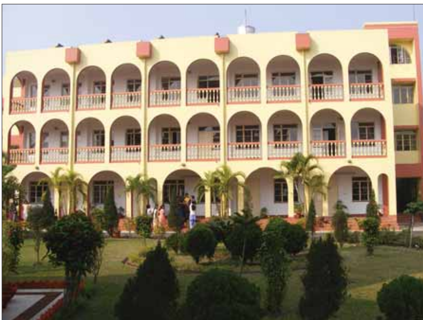
* Αποψη τοῦ Ὁρθοδόξου Ὁρφανοτροφείου τῆς Καθκοῦτας στήν Ἰνδία