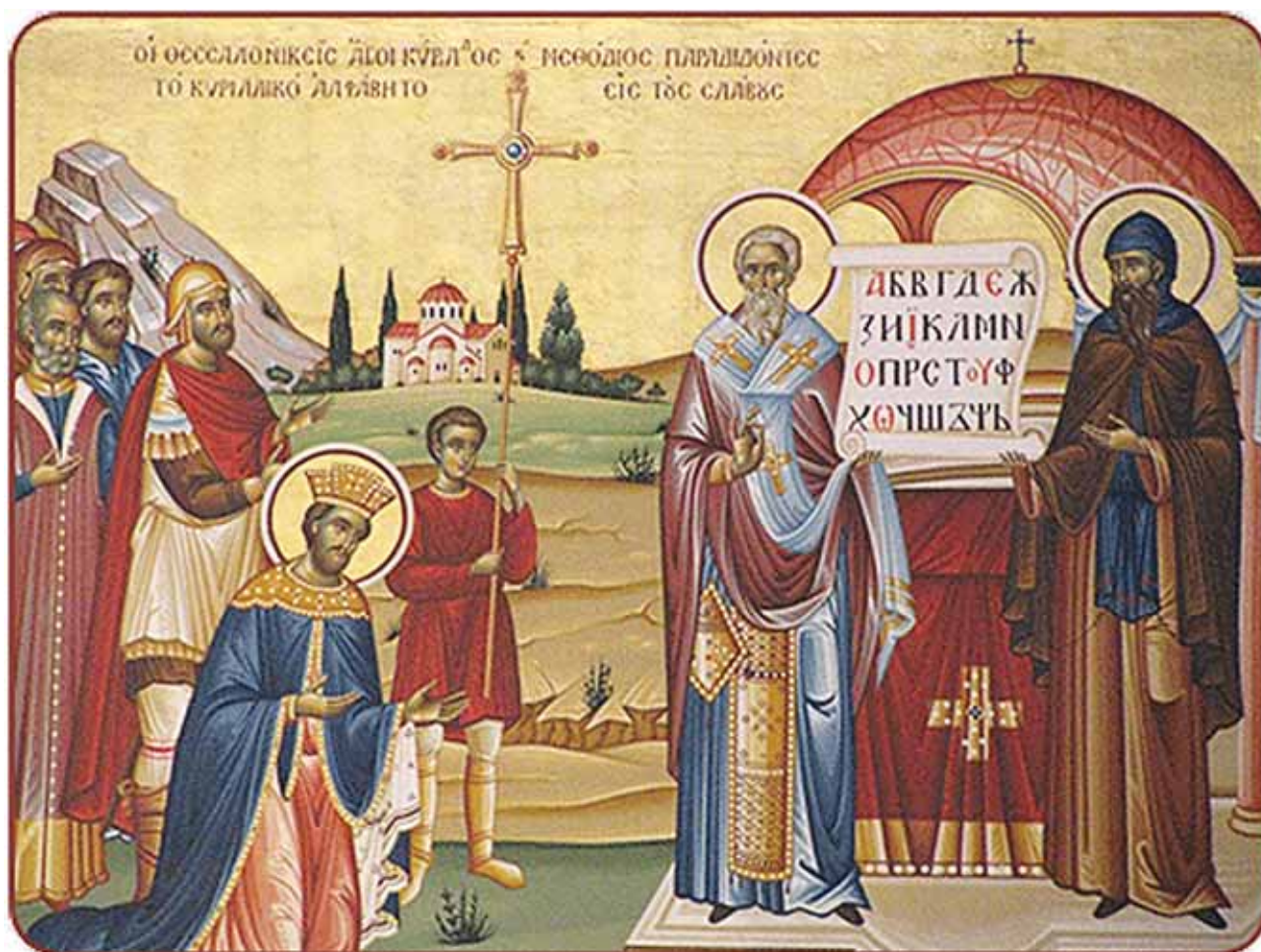
Φορητή εικόνα με θέμα τήν παράδοση ἀπό τοὺς Ἁγίους τοῦ ἀλφαβηταρίου στοὺς Σλάβους

μετά τήν κατάρρευση τοῦ ἱεραποστολικοῦ τους ἔργου στή Μεγάλη Μοραβία οἱ μεταφράσεις τους βρῆκαν φιλόξενο ἔδαφος στή χερσόνησο τοῦ Αἴμου (Βουλγαρία, Κροατία, Σερβία) καί στή συνέχεια, ὅταν διαδόθηκε ὁ Χριστιανισμός στή Ρωσία, μεταφέρθηκαν ἐπί ρωσικοῦ ἐδάφους.