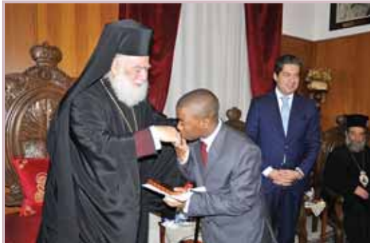
Ὁ Μακαριώτατος ἀπονέμει τὰ πτυχία