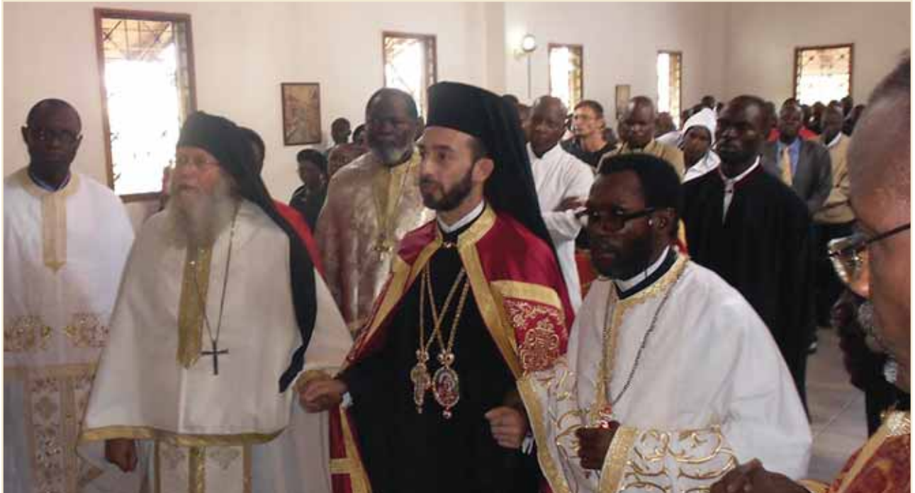
Ὁ ντόπιος κληρικός προσάγει τόν Ἐπίσκοπό του κατά τήν τελετή τῆς Ἐνθρόνισης

Τήν Κυριακή 14 η Ἀπριλίου 2013, πραγματοποιήθηκε στόν Ἱερό Καθεδρικό Ναό τοῦ Ἁγίου Δημητρίου τῆς πόλεως Pointe Noire τοῦ Κονγκό, ὅπου βρίσκεται ἡ ἔδρα τῆς τοπικῆς Ἐκκλησίας, ἡ ἐνθρόνιση τοῦ Θεοφιλεστάτου Ἐπισκόπου Μπραζαβίλ καί Γκαμπόν κ. Παντελεήμονα.