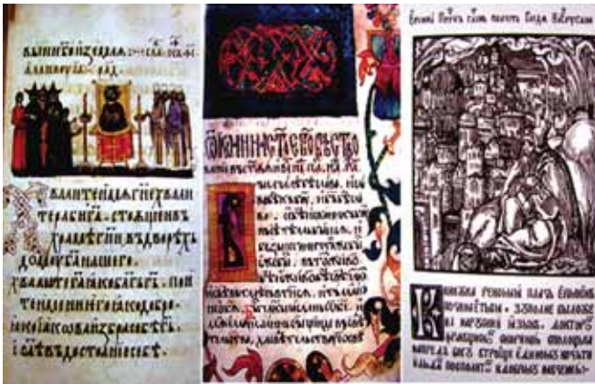
Τρία χειρόγραφα τά ὁποῖα διασώζουν τό κυριλλικό ἀλφάβητο (14ος καὶ 15ος αἰῶνας)

ρία ἀπό πάνω του καί νά τόν ψάλουν καί νά τόν κηδέψουν, σάν νά τό ἔκαναν στόν ἴδιο τόν πάπα». Ὁ ἴδιος πρότεινε νά παραχωρήσει τόν τάφο του στό ναό τοῦ Ἁγίου Πέτρου γιά τήν ταφή τοῦ Κυρίλλου, ἀλλά τελικά ἐπικράτησε ἡ πρόταση τοῦ Μεθοδίου νά ταφεῖ στό ναό τοῦ Ἁγίου Κλήμεντος, «στή δεξιά πλευρά τοῦ ἱεροῦ». Πάνω στόν τάφο του οἱ Ρωμαῖοι ἰστόρησαν τήν εἰκόνα του καί ἔκαιγαν καντήλι νύχτα καί ἡμέρα 24 .