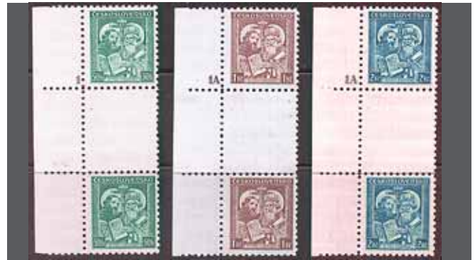
Σειρὰ γραμματοσήμων τῆς τότε Τσεχοσλοβακίας (1972), πρὸς τιμὴ τῶν δύο μεγάλων ἱεραποστολικῶν μορφῶν

κατελάμβανε ὁ εὐνοούμενός του! Ὁ Μεθόδιος σημείωσε μερικὴ ἐπιτυχία. Ἐπεισε τὸν πάπα ὅτι ἔχει δικαίωμα νὰ τελεῖ τὴ λειτουργία στὴ σλαβικὴ. Σὲ ἐπιστολὴ του πρὸς τὸ Μοραβὸ ἡγεμόνα (880) ὁ πάπας ἐπιβεβαιώνει τὰ δίκαια τοῦ Μεθοδίου ὡς ἀρχιεπίσκοπου Μοραβίας καὶ ἐπιτρέπει νὰ τελεῖται ἡ λειτουργία στὴ σλαβικὴ, συγχρόνως ὁμως διατάσσει τὸ Εὐαγγέλιο πρῶτα νὰ διαβάζεται στὴ λατινικὴ. Ὁ Wiching ὡς ἀνταμοιβὴ γιὰ τὸ σκοτεινὸ ρόλο ποὺ ἔπαιξε ἔλαβε τὴν ἐπισκοπὴ τῆς Νίτρας. Ἐπιστρέφοντας στὴ Μοραβία πρὶν ἀπὸ τὸ Μεθόδιο νόθευσε τὰ ἔγγραφα καὶ δυσφήμησε τὸν ἀρχιεπίσκοπό του. Ὁ Μεθόδιος διαμαρτυρήθηκε στὸν πάπα καὶ ὁ πάπας μὲ νέα ἐπιστολὴ του ἔδωσε ἐξηγήσεις (881) 29 .