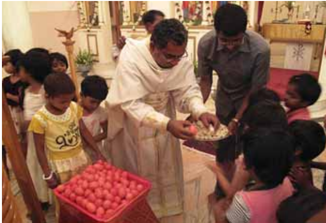
Πάσχα στο Όρφανοτροφείο της Καϊκούτας

ΠΑΛΑΜΑΣ» 25 • Ήσυχαστήριο «ΟΙ ΑΓ. ΘΕΟΔΩΡΟΙ» 40 • Θεοδοσιάδη Εὐγένιο 70 • Θεοδωράκη Φώτιο 50 • Θεοδωράκη Φώτιο 45 • Θεοδορόπουλο Ἰωάννη 40 • Ἱεροδιακόνου Ν. Ἀνδρέα 300 • Ἰωαννίδου Σταματούλα 30 • Ἰώβ Ἐλένη 20 • Κακαράτζα Ἀντώνιο 20 • Καθολιγιάνη Μακρίνα 20 • Καθύβα Ἐλένη 250 • Καηφά Τασούλα 20 • Κανελλόπουλο Ἀνδρέα 10 • Καντιδάκη Ἰωάννη 60 • Καραγεωργίου Ἰωάννη 10 • Καραμέτσου Μαρία 10 • Καρατάσου Ἀλεξάνδρα 26 • Καρατσιώλη Βασίλειο 10 • Καρβουντζή Αικατερίνη 50 • Κασαπίδου Ἀλεξάνδρα 10 • Καταχιώτου Μαρία 50 • Κατσάμπα Ἀθήνη 50 • Κεκάκη Μαρία 10 • Κεκριδίη Στάθη 100 • Κληρονόμο Ἰωάννη 100 • Κοκκινάκη Ὑπατία 100 • Κοκκινόφτα Κωστή 12 • Κονιδάρη Γεράσιμο 50 • Κορακιανίτου Ἀγ. 300 • Κορδά Ἀναστ. 20 • Κορίκη Μάχη 60 • Κούγια Αικατερίνη 40 • Κούλα Ἰωάννη 10 • Κούλη Ἀγάπη 300 • Κουρεϊλίδου Ἐλπινίκη 70 • Κουτσογιάννη Δήμητρα 100 • Κοφινά Φωτεινή 50 • Κρενδηρόπουλο Γεώργιο 100 • Κυπριωτάκη Καλλιόπη 50 • Κωνσταντοπούλου Βούλα 40 • Κωστή Ἀμαλία 30 • Κωστή Σπυριδώνα 100 • Κώτη Ἀντώνιο 100 • Λιβιεράτου Δήμητρα 50 • Λιόλιου Χ. 500 • Λοῦκο Κων/νο 40 • Λυδία 50 • Λυκοπάντη Γεώργιο 100 • Μακρίδου Νίνα 15 • Μακροπούλου Πολυ-