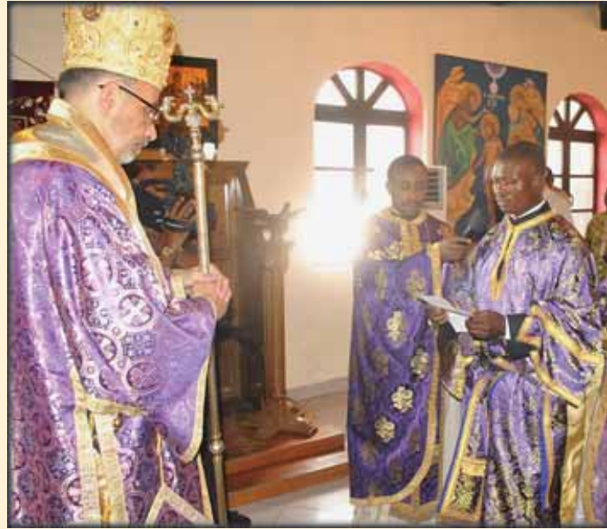
Ὁ π. Ἀνδρέας ἀπευθυνόμενος στὸν Ἐπίσκοπό του καί τὸ ἐκκλησίασμα