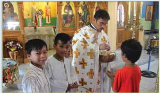
Ὁ νεοχειροτονηθεὶς Πρεσβύτερος διανέμει τό Ἀντίδωρο