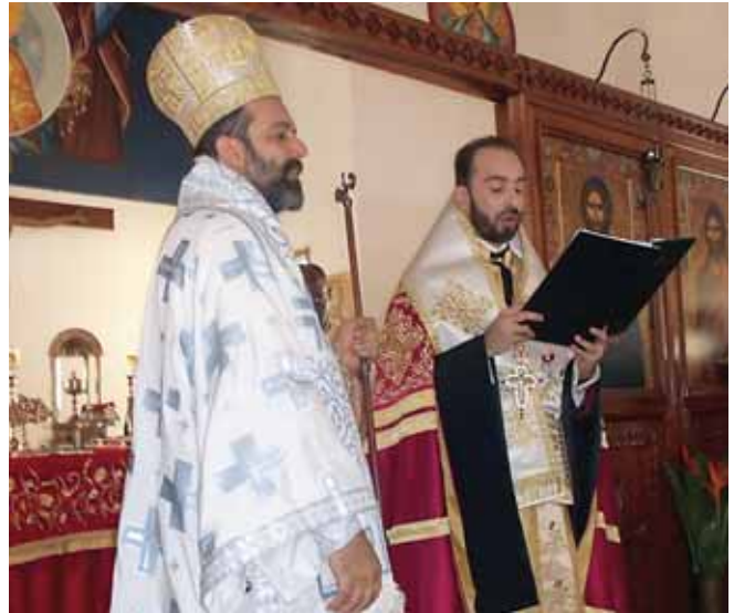
Ὁ Ἐκπρόσωπος τοῦ Πατριάρχου, Σεβ. Μητροπολίτης Καμερούν κ. Γρηγόριος, μέ τόν πρῶτο Ἐπίσκοπο Μπραζαβίλ καί Γκαμπόν κ. Παντελεήμονα

Ἡ παρούσα ἐκκλησιαστική τελετή εἶναι γνωστή ὡς «ἐνθρόνιση τοῦ Ἐπισκόπου», πού σημαίνει ἐγκα-