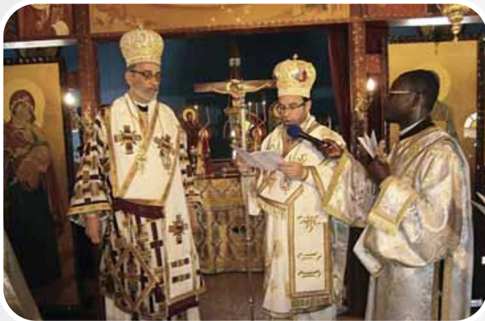
Ὁ Σεβ. Νιγηρίας κ. Ἀλέξανδρος μέ τόν Σεβ. Ἀκκρας κ. Σάββα κατά τό τελετουργικό τῆς Ἐνθρόνισης

Αὐτοί οἱ ἀνθρώποι πού ἔζησες κοντά τους γιά κάποια χρόνια ἀποτελοῦν τούς φύλακες τῆς αὐθεντικῆς μνήμης, ζοῦν γιά νά διηγοῦνται τήν ἱστορία