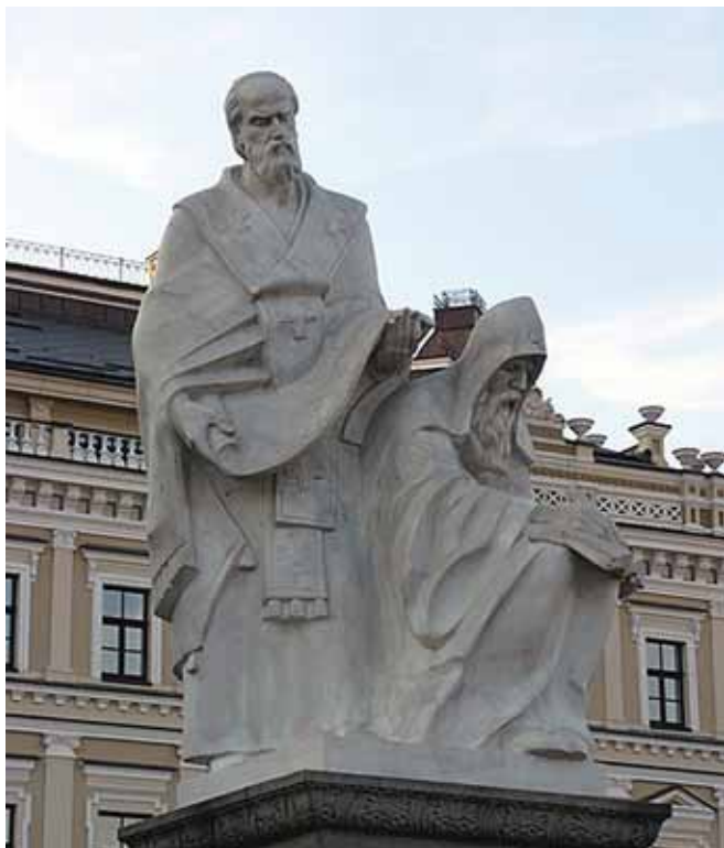
Τμῆμα μνημείου τῶν δύο ἀδελφῶν ποὺ βρίσκεται στὸ Κίεβο τῆς Οὐκρανίας

Πρὶν ἀπὸ τὸ θάνατό του ὁ Μεθόδιος ἔδειξε καὶ τίς μεταφραστικὲς του ἰκανότητες ἀπὸ τὴν ἑλληνικὴ στὴν παλαιосλαβική καὶ ἀπέδειξε περὶ τὰν ὅτι κακῶς ὀρισμένοι ἱστορικοὶ τὸν τοποθετοῦν ὑπὸ τὴν σκιά τοῦ Κυρίλλου. Μέσα σὲ ἑπτὰ μὲ ὀκτῶ μῆνες (ἀπὸ τὸ Μάρτιο ὡς τὴν 26η Ὀκτωβρίου), μὲ τὴ βοήθεια δύο μαθητῶν του ἱερέων ταχυγράφων μετέφρασε ὁλόκληρη τὴν Ἁγία Γραφή, Παλαιά καὶ Καινὴ Διαθήκη, μὲ ἐξαιρέση τὸ βιβλίον τῶν Μακκαβαίων. Ἐπίσης τότε μετέφρασε καὶ τὸ Νομοκάνονα (τὴ Συναγωγή εἰς 50 τίτλους τοῦ πατριάρχου Κωνσταντινουπόλεως Ἰωάννου τοῦ Σχολαστικοῦ) καὶ τὸ Βιβλίον τῶν Πατέρων (πιθανότατα κάποιο Πατερικόν) 30 .