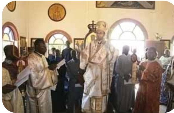
Ὁ νέος Μητροπολίτης εὐλογεῖ τοὺς πιστοὺς

Σκοπὸς μας εἶναι καί ὁ κατὰ τόν Ἀπόστολο Παῦλο Εὐαγγελισμὸς τῶν Ἑθνῶν. Ἡ Ὁρθόδοξη Ἱεραποστολή στήν Ἀφρικὴ ξεκίνησε πρὶν ἀπὸ πενήντα μόλις χρόνια ἀποδίδοντας ὁμως πλοῦσιους καρπούς.