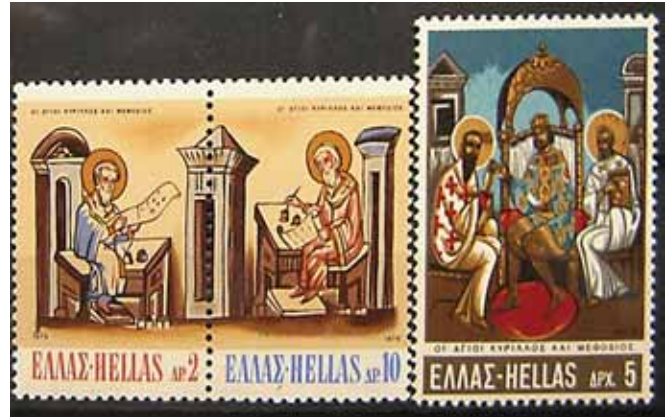
Γραμματόσημα τῶν Ἑλληνικῶν Ταχυδρομείων ἀφιερωμένα στοὺς Ἁγίους Κύριλλο καὶ Μεθόδιο

Τὰ πράγματα ὁμως μεταβλήθηκαν σὲ σύντομο χρονικὸ διάστημα. Ἡ θέση τοῦ Μεθοδίου ἦταν εὐάλληλη στὶς κατηγορίες αὐτὴ τὴ φορά. Ὅταν τὸν ἀπελευθέρωσε ὁ πάπας ἀπὸ τοὺς Φράγκους, τὸν εἶχε διατάξει νὰ μὴν τελεῖ τὴ λειτουργία στὴ σλαβικὴ. Ὁ Μεθόδιος ὁμως δὲν συμμορφώθηκε μὲ τὴν ἐντολὴ τοῦ προϊσταμένου του. Οἱ Φράγκοι κληρικοί ἐκ νέου ἐπέστρεψαν στὴ Μοραβία καὶ ὑπέσκαπταν τὸ κῦρος του. Ὁ Λατίνος πρεσβύτερος Ἰωάννης κατ' ἀρχάς καὶ ὁ Φράγκος πρεσβύτερος Wiching ἀργότερα ἠγήθηκαν τῶν ἀντιπάλων τοῦ Μεθοδίου. Ὁ Μεθόδιος δυσσάρεστησε τοὺς Φράγκους καὶ σ' ἄλλο ζήτημα. Τοὺς κατηγορῆσε ἀνοικτὰ γιὰ τὴν προσθήκη τοῦ Filioque (= καὶ ἐκ τοῦ Υἱοῦ) στοῦ Σύμβολο τῆς Πίστεως. Δυστυχῶς στοῦ πλευροῦ τῶν ἀντιπάλων τοῦ Μεθοδίου ἦταν καὶ ὁ ἡγεμόνας Σβατοπλοῦκ. Ὁ ἄξιος χαρακτήρας του, ἡ ἔλληψη ἐνδιαφέροντος γιὰ τὴ σλαβικὴ λειτουργία, οἱ διασυνδέσεις του μὲ τοὺς Φράγκους, ἡ ἀνήθικη ζωὴ του καὶ ἡ κριτικὴ ποὺ ἀσκοῦσε ὁ Μεθόδιος κατὰ τῶν παραβατῶν τῆς ἠθικῆς (ἀκόμη καὶ ὅταν κατεῖχαν ἀξιώματα), ἔκαναν μιστὸ τὸ Μεθόδιο στὸν ἡγεμόνα. Ὁ πρεσβύτερος Ἰωάννης μετέβη στὴ Ρώμη, μὲ σκοπὸ νὰ «ἐνημερώσει» τὸν πάπα καὶ νὰ τὸν συκοφαντήσει. Ὁ πάπας κάλεσε σὲ ἀπολογία τὸν ἀρχιεπίσκοπο (879). Στὴ Ρώμη τὸ Μεθόδιο συνόδευσε καὶ ὁ πρεσβύτερος Wiching. Ὁ ἡγεμόνας πίστευε ὅτι ὁ Μεθόδιος θὰ παραμεριζόταν καὶ τὴ θέση του θὰ