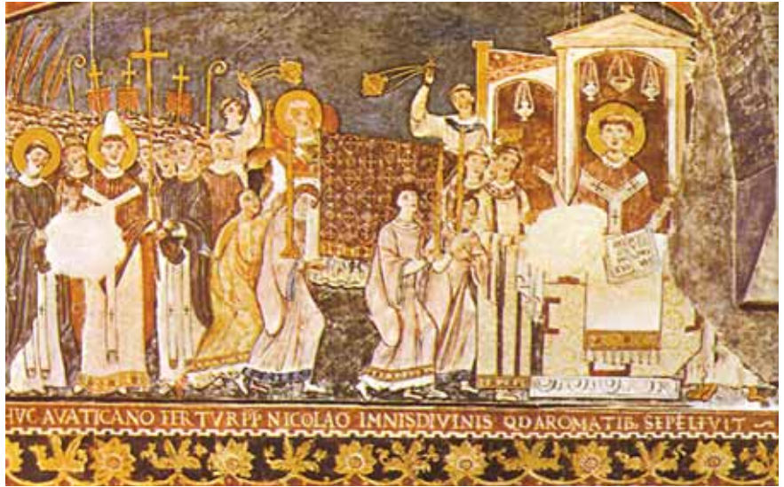
Τοιχογραφία πού ἀναπαριστᾷ τὴν ἀφιξη τῶν δύο Ἁγίων στὴ Ρώμη (Βασιλικὴ τοῦ Ἁγίου Κλήμεντος)

Ἰδιαίτερη τιμὴ ἔδειξε στοὺ πρόσωπο τοῦ Κωνσταντίνου, ὁ ὁποῖος πενήντα ἡμέρες πρὶν ἀπὸ τὴν κοίμησή του ἐκάρη μοναχὸς καὶ ἔλαβε τὸ ὄνομα Κύριλλος. Μετὰ τὴν κοίμησή του (στὶς 14 Φεβρουαρίου τοῦ 869, σὲ ἡλικία 42 ἐτῶν), ὁ πάπας Ἀδριανὸς κάλεσε ὄλους τοὺς Ἑλληνας καὶ τοὺς Ρωμαίους τῆς Ρώμης «νὰ μαζευθοῦν ὄλοι με κε-