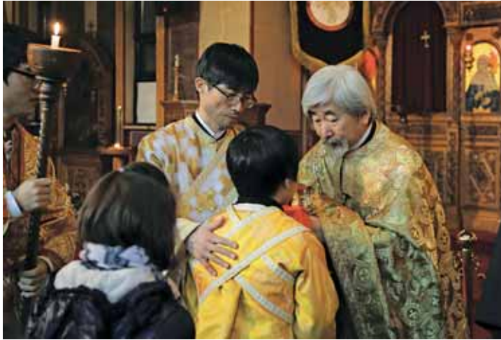
Θεία Λειτουργία στὸν Ἱερό Καθεδρικό Ναό τοῦ Ἁγίου Νικολάου στή Σεούλ

Τὸ περιεχόμενο τοῦ κηρύγματος νά εἶναι μόνον θεολογικό καί ὄχι πολιτικό ἢ κοινωνιολογικό. Ὁ Χριστός καί ἡ σωτηρία τῶν ἀνθρώπων νά εἶναι ὁ ἄξονας τοῦ κάθε κηρύγματος. Ὅλα τὰ ἄλλα εἶναι ἐκ τοῦ πονηροῦ καί ὀδηγοῦν στήν ἐκκοσμίκευση τῆς Ἐκκλησίας.