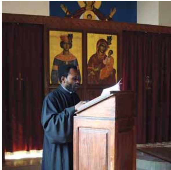
Κληρικός τῆς Ἐπισκοπῆς στό βῆμα

Τὴ συνολικὴ εὐθύνη γιά τὴ ζωὴ, τὴν κατάλληλη ὀργάνωση καί τίς δραστηριότητες τῆς Ἐκκλησίας ἔχει ὁ ἐπίσκοπος. Ὁ ἅγιος Ἰγνάτιος ὁ Θεοφόρος, Ἐπίσκοπος Ἀντιοχείας, ἓνας ἀπὸ τοὺς μεγαλύτερους Πατέρες καί διδασκάλους τῆς Ὁρθοδοξίας πού ἔζησε τὸν Α΄ αἰώνα μ. Χ. στὴν Ἀσία, λέγει πρὸς τοὺς κατοίκους τῆς Σμύρνης: «Ὅλοι νά ἀκολουθεῖτε τὸν ἐπίσκοπο, ὅπως ὁ Χριστὸς τὸν Πατέρα Του, καθὼς καί τὸ σύνολο τῶν ἱερέων (νά τὸν ἀκολουθεῖ)... Κανένας ἀπὸ αὐτοὺς πού ἀνήκουν στὴν Ἐκκλησία νά μὴν πράττει κάτι ξεχωριστὰ ἀπὸ τὸν ἐπίσκοπο. Ἐκείνη