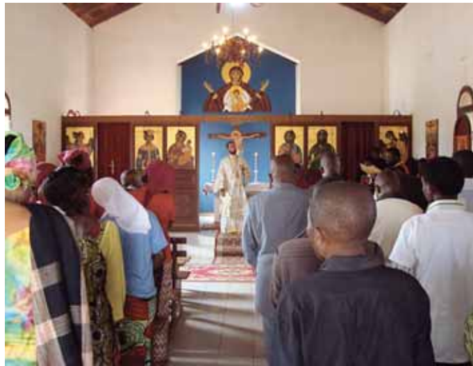
Ἡ θεία Λειτουργία στό Ναό τῆς Ἁγίας Εἰρήνης

Ἀπό τήν Ἱερά Ἐπισκοπή Μπραζαβίλ καί Γκαμπόν