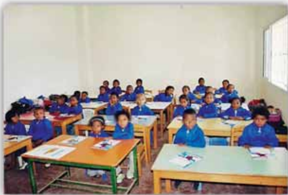
Μικροί μαθητές σε αίθουσα σχολείου της Μητροπόλεως

στό ανεξάντητο ἔλεος τοῦ Θεοῦ, μαζί μέ τοὺς ἀδελφούς σου, οἱ ὁποῖοι περιμένουν ἀπό ἐσένα νά γνωρίσουν γιά τήν Ἀλήθεια, ὅ,τι πολυτιμότερο ὑπάρχει. Βρίσκεσαι κοντά τους γιά νά τοὺς παρακινήσεις καί νά ριχτεῖς μαζί τους στό πέλαγος τῆς ἀστεύρευτης ἀγάπης Του.