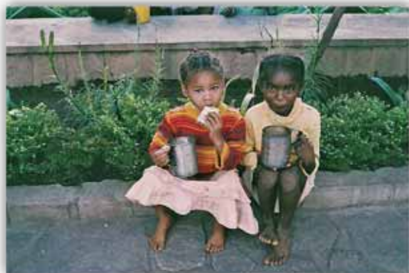
Τρώγοντας τό πρωινό πού διανέμει ή τοπική Έκκλησία