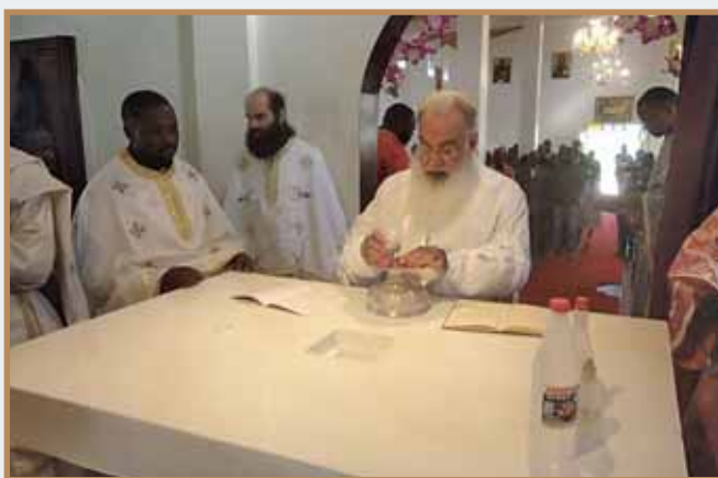
Ὁ Σεβασμιώτατος κ. Μακάριος στό κέντρο τῆς Ἁγίας Τραπεζῆς