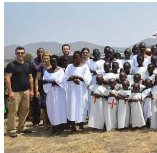
Ἀναμνηστικὴ φωτογραφία μὲ