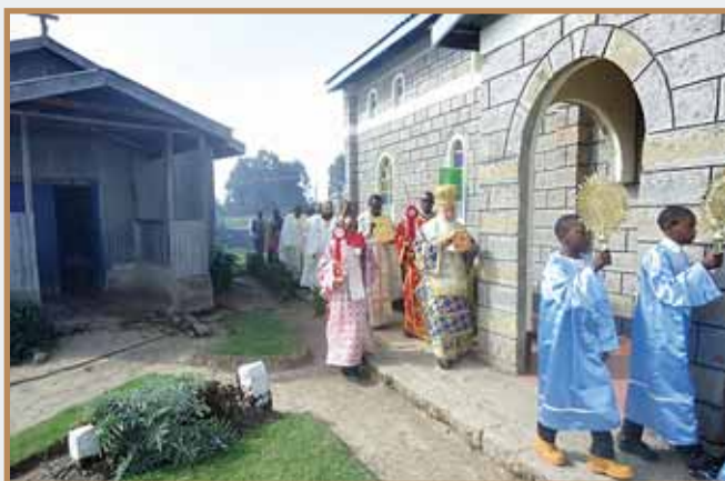
Λιτανεύοντας τά ἱερά λείψανα τῶν ἐγκαίνιων