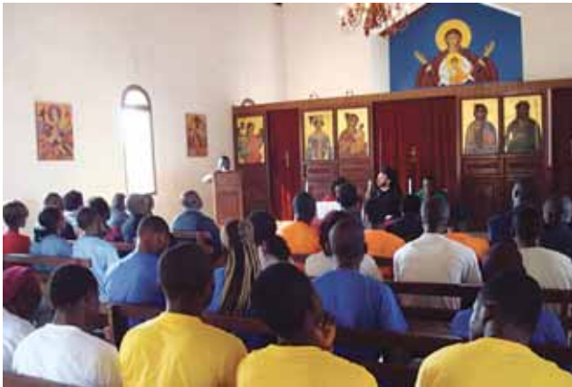
Στιγμιότυπο ἀπό τόν τόπο τῆς διεξαγωγῆς τοῦ Συνεδρίου

Εὐχομαι καί προσεύχομαι αὐτή ἡ δεκτικότητα, ἡ θέληση καί ἡ ἐνέργεια τῶν νέων ἀνθρώπων, στά