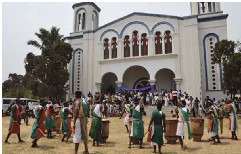
Τὸ προαύλιο τοῦ ναοῦ τῆς Κοιμήσεως τῆς Θεοτόκου στὴ Μπουζουμπούρα

Ζώντας πραγματικά συγκινητικές στιγμές, πού θυμίζουν τοὺς πρώτους ἀποστολικούς χρόνους τῆς Ἐκκλησίας μας, ὁ Ἐπίσκοπος μέ τοὺς ἐθελοντές ἱεραποστόλους καί τοὺς ἰθαγενεῖς ἱερεῖς, τέλεσε στὸν ἴδιο ναό 60 βαπτίσεις καί 25 γάμους νέων Ὀρθόδοξων χριστιανῶν. Ἡ νεόφυτη αὐτὴ ἐνορία ἀριθμεῖ ἤδη ἑκατοντάδες πιστούς. Οἱ ἄνθρωποι μέ τὴν καρδιά τους ἀνοικτὴ, ζητοῦν τὸν πολύ-