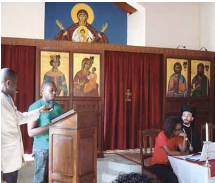
Ὁρθόδοξος νέος τοποθετεῖται στὰ θέματα τῆς συνάντησης

Στό Συνεδριό μας συμμετέχουν καί γυναῖκες. Αὐτό εἶναι φυσικό καί αὐτονόητο, ἐφόσον ὁ ἴδιος ὁ Χριστός διακήρυξε τήν ἁρμονική ἰσότητα καί