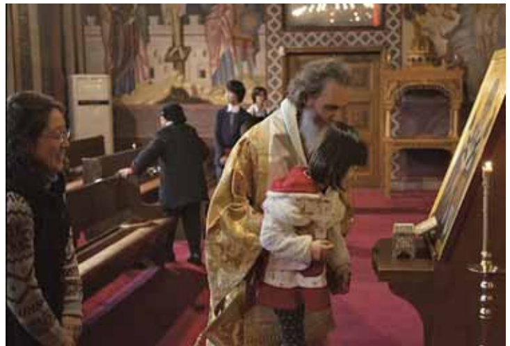
Μικρὴ Κορεάτισσα προσκυνᾷ τὰ ἱερά λείψανα μέ τὴ βοήθεια τοῦ Ἐπισκόπου της

Εἶμαι ἀπόλυτα πεπεισμένος ὅτι ἐάν ἀκολουθήσουμε τὸ δρόμο τῆς ταπείνωσης καί τῆς με-