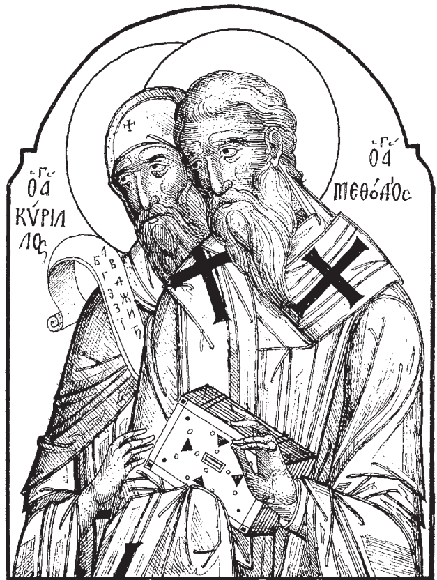
Οἱ Ἅγιοι Κύριλλος καί Μεθόδιος (σχέδιο: Σ. Καρδαμάκη)

Γιά τή στερέωση τῆς χριστιανικῆς πίστεως στή Χαζαρία ἐνδιαφέρθηκε ὁ διάδοχος τοῦ Μεγάλου Φωτίου στόν πατριαρχικό θρόνο ἅγιος Νικόλαος Α' ὁ Μυστικός (901-907, 912-925). Στά χρόνια του ὁ ἀρχιεπίσκοπος Χερσῶνος ἐξακολούθησε νά ἀσκεῖ τήν πνευματική κηδεμονία τῶν νεοφώτιστων Χαζάρων. Οἱ ἴδιοι, ὡστόσο, ἀποτελώντας μία μειοψηφία στή χώρα τους, ὅπου, παράλληλα μέ τόν Χριστιανισμό, διαδιδόνταν τόσο ὁ Ἰουδαϊσμός ὅσο καί ὁ Μωαμεθανισμός, ἐνιωθάν τήν ἀνάγκη τῆς ἐπιτόπιας παρουσίας ἐνός ἐπισκόπου, ὁ ὁποῖος ἀφενός θά ἐκπλήρωνε τίς ἐκκλησιαστικές τους ἀνάγκες (κατήχηση, διαποίμανση, χειροτονίες ἱερέων κ.λπ.) καί ἀφετέρου θά ἐργαζόταν γιά τήν ἐξουδετέρωση τῶν προσηλυτιστικῶν