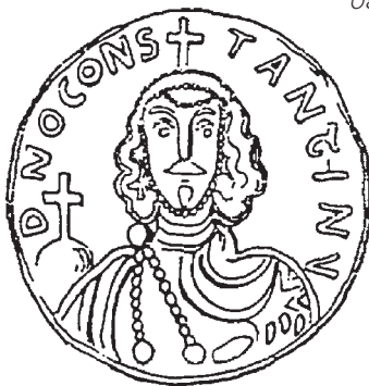
Ὁ Κωνσταντῖνος Ε΄ Κοπρώνυμος σέ νόμισμα τῆς ἐποχῆς του

παίρνοντας μαζί του ὡς συνεργάτη τόν μεγαλύτερο ἀδελφό του Μεθόδιο (815-885) καί ἄλλοις συνοδούς, ξεκίνησε γιά τή Χαζαρία. Ἀξίζει νά σημειωθεῖ ὅτι στή διάρκεια τοῦ ταξιδιοῦ τους (861) βρῆκαν στή Χερσώνα τά ἱερά λείψανα τοῦ ἁγίου Κλήμεντος, πάπα Ρώμης, πού κατά τήν παράδοση μαρτύρησε ἐκεῖ στά χρόνια τοῦ Τρωϊανοῦ (98-117). Τά λείψανα μετέφερε ἀργότερα (868) ὁ Κωνσταντῖνος στή Ρώμη.