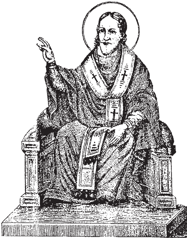
Ὁ Μέγας Φώτιος

(εἰκόνα ἀπό κώδικα τῆς Μεγάλῃς Λαύρας Ἁγίου Ὁρους)