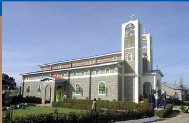
Ὁ περικαλλής ναός τῶν Ἁγίων Πάντων στή Ναϊρόμπι