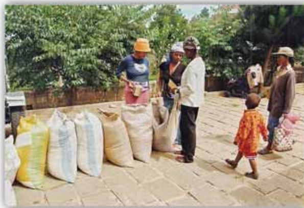
Στιγμιότυπο ἀπό τήν ἐβδομαδιαία διανομή τροφίμων

Θά καταλάβεις ὅτι ἄλλος εἶναι Αὐτός πού κρατᾶ τά ἡνία, ἐσύ ἔχεις νά διαθέσεις μόνο τήν ἀγαθή σου προαίρεση. Θά ἀφουγκραστεῖς, σίγουρα, ὅσα δέν μπόρεσες νά αισθανθεῖς ζώντας μέσα στόν πλοῦτο καί τήν ἐπίπλαστη εὐμάρεια τοῦ -κατά τά ἄλλα-