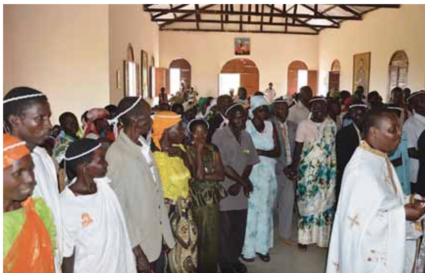
Στιγμιότυπο ἀπὸ τὴν τέλεση τῶν εικοσιπέντε γάμων