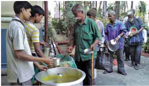
Διανομή συσσιτίου της Έκκλησίας στην Ίνδία

Φαίδρα 105 • Κοπιτοπούλου Έλενη 30 • Κορακιανίτου Άγ. 300 • Κοσμά Σταυρούλα 50 • Κοτσαρίνη Κ. 20 • Κουμεντάκη Νικόλαο 10 • Κουνδή Νικόλαο 50 • Κουνιάκη Ίουλίτσα 100 • Κουρεϊλίδου Έλληνική 90 • Κουτσιπετσιδού Άθανάσιο 200 • Κουτσογιάννη Δημήτρα 70 • Κουτσουράκη Παντελεήμονα 100 • Κουτσούρη Γεωργία 75 • Κρενδρόπουλο Γεώργιο 150 • Κρητικό Γεώργιο 200 • Κωνσταντάκου Ευσέβεια 5 • Κωνσταντινίδη Εύαγγελιο 30 • Κωνσταντινίδου Έλεούσα Μαρία 100 • Κωνσταντινίδου Θάλ. 10 • Κωνσταντοπούλου Βενέτα 20 • Κωνσταντοπούλου Βούλα 20 • Κωσταδήμα Γεώργιο 50 • Λαγουδάκου Στέλλα 20 • Λάμπρου Άννασσία 30 • Λασπούλα Εύθυμία 60 • Λιβάνη Ίωάννη 100 • Λιόλιου Χ. 50 • Λουκάκη Παναγιώτη 50 • Λουκοπούλου Ρένα 400 • Λοΐζου Σ. Έλενη 50 • Μακρή Ίωάννη 50 • Μακρاندρέου Άνδρέα 10 • Μακρή Φιλάρετη 150 • Μαλιώρα Κωνσταντίνο 5 • Μαλιώρα Χριστίνα 15 • Μάμα Εύαγγελιο 12 • Μάνεση Ίωάννα 80 • Μαργαρίτη Κων/νο 100 • Μάρδα Κων/νο 100 • Μαρσέλλου Σωτηρία 10 • Μασίχη Άνδρέα 50 • Ματσιώτα Έλενη 30 • Μαϊθακάκη Νομική 20 • Μέμμου Εύανθια 50 • Μεραντζή Εύφροσύνη 20 • Μνητίση Γεώργιο 50 • Μητρόπουλη Γλυφάδας 2.400 • Μίχα Άννα 10 • Μιχαλάκη Άγγελική 40 • Μιχαλάκη Αικατερίνη 20 • Μιχαλόγλου Αικατερίνη 30 • Μονή Παναγίας Ξενιάς 20 • Μονή Σίμωνος Πέτρος 20 • Μοσχίδου Μαρία 400 • Μουστακίδου Δημόκλεια 50