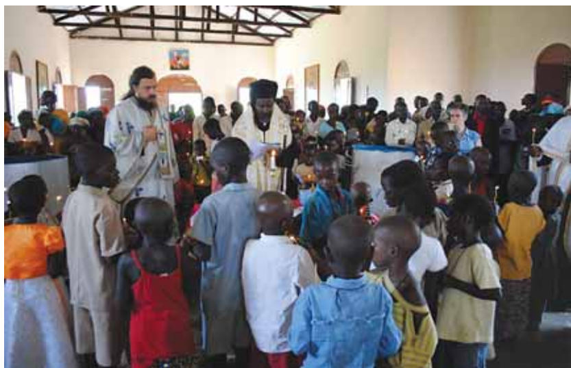
Τελώντας τὸ Μυστήριον τοῦ Βαπτίσματος

Τὴν Κυριακὴ 11 Αὐγούστου, προεξάρχοντας τοῦ Θεοφιλεστάτου Ἐπισκόπου Μπουρούντι καὶ Ρουάντας κ. Ἰννοκεντίου καὶ μὲ τὴ συμμετοχὴ τῶν ἐπισκεπτῶν καὶ τῶν ντόπιων κληρικῶν, τελέσθηκε ἡ θεία Λειτουργία στὸν Ἱερό