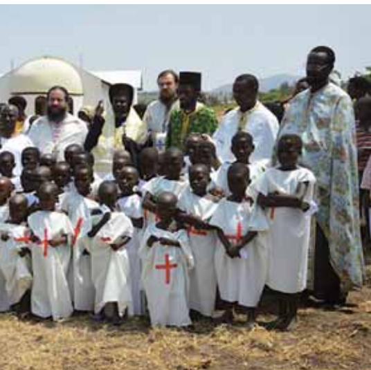
τοὺς νεοφώτιστους πιστοὺς