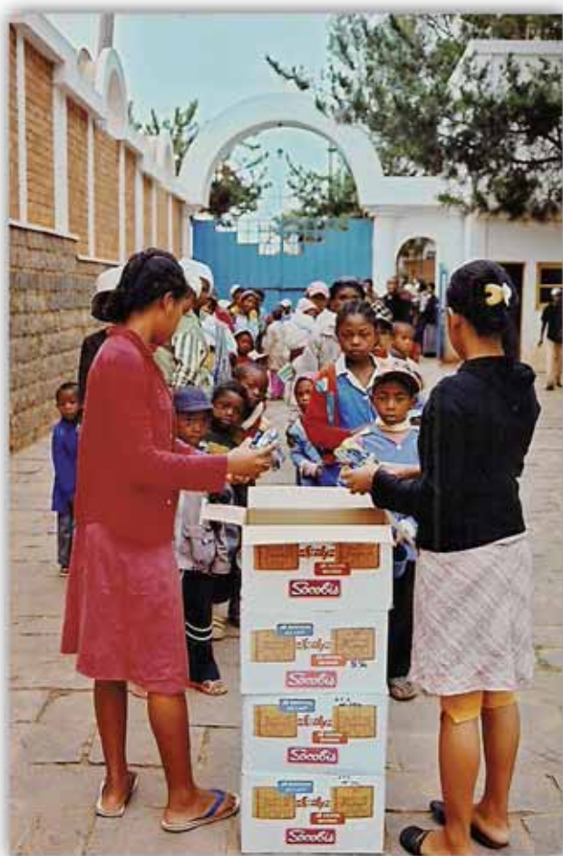
Μοιράζοντας στά παιδιά τά μπισκότα του πρωινού

Όταν κάποιος αποφασίζει νά αφιερώσει τόν έαυτό του στή διακονία του μυστηρίου τής ιεραποστολής, πρέπει νά έχει υπόψη του ότι γιά τήν οποιαδήποτε υπηρεσία καί ανθρώπινη προσφορά στό έργο αυτό κυριαρχοῦν δύο καταλυτικά δεδομένα.