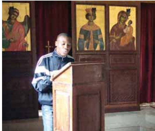
Ἐτερος νέος ἐκφράζει τίς ἀπόψεις του στό Συνέδριο

ἔγινε ἀρχιερατική θεία Λειτουργία ἀπό τόν ποιμενάρχη μας, ἡ ὁποία ἐπισφράγισε τήν περάτωση τῆς προαναφερθείσας ποιμαντικῆς πρωτοβουλίας τῆς Ἐπισκοπῆς μας γιά τή νεότητά της.