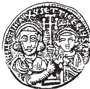
Ὁ Ἰουστινιανός Β΄ Πινότυμος σέ νόμισμα τῆς ἐποχῆς του

Ὁ πατριάρχης ἅγιος Φώτιος ὁ Μέγας (858-867, 878-886) εἰσηγήθηκε στόν αὐτοκράτορα τήν ἱκανοποίηση τοῦ αἰτήματός τους καί πρότεινε ὡς κατάλληλο γιά τήν ἀνάληψη τῆς σχετικῆς ἀποστολῆς τόν ἱκανότατο Θεσσαλονικέα φιλόσοφο Κωνσταντίνο, τόν κατοπινό φωτιστή τῶν Σλάβων ἅγιο Κύριλλο (826/7-869). Πραγματικά, τό φθινόπωρο τοῦ 860 ὁ Κωνσταντῖνος,