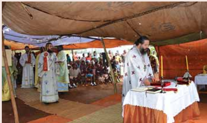
* Ἀποψη ἀπὸ τὴν ὑπαίθρια θεία Λειτουργία στὴ Ρουάντα

Τὴν ἐπόμενη ἡμέρα ἐγίνε ὑπαίθρια ἀρχιερατικὴ θεία Λειτουργία, πού μὲ πολὺ σεβασμὸ καὶ πνεῦμα κατάνυξης παρακολούθησαν ὡς κατηχούμενοι οἱ ἀδελφοί μας ἀπὸ τὴ Ρουάντα, οἱ ὁποῖοι δὲν ἔκρυψαν τὴν ἐκπλήξη ἀλλὰ καὶ τὸν θαυμασμὸ τους γιὰ τὸν λειτουργικὸ πλοῦτο τῆς Ὁρθόδοξης Λατρείας.