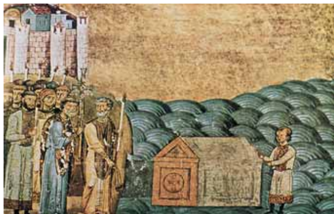
Ἡ ἀνεύρεση τῶν ρειψάνων τοῦ Ἀγ. Κλήμεντος Ρώμης στή Χερσῶνα ἀπό τοὺς Ἀγ. Κύριλλο καί Μεθόδιο (Μικρογραφία ἀπό τό Μνηολόγιο τοῦ Βασιλείου Β', 10ος αἰ.)