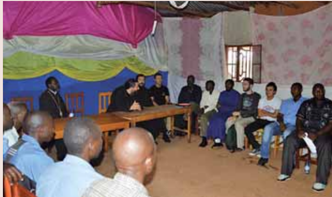
Συνάντηση μὲ τοὺς κατηχούμενους στὴ Ρουάντα

τῆς Ρουάντα σὲ ὁμάδες ἐργασίας, καταληκτικὴ ὁμιλία καὶ κοινὸ γεῦμα. Δόθηκε ἡ εὐκαιρία στοὺς ντόπιους νὰ διατυπώσουν ἐρωτήσεις καὶ νὰ λάβουν τὶς δεούσες ἀπαντήσεις πάνω σὲ οὐσιαστικὰ ζητήματα πού ἀφοροῦν στὴν Ὁρθόδοξη πίστη.