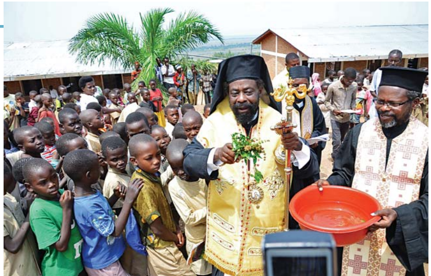
Τελώντας τόν Ἄγιασμό τῆς ἔναρξης τοῦ νέου σχολικοῦ ἔτους

Τήν Παρασκευή 19 Σεπτεμβρίου, ὁ Θεοφιλέστατος τέλεσε τόν Ἄγιασμό γιά τήν ἔναρξη τῆς νέας σχολικῆς χρονιάς στό Δημοτικό Σχολεῖο τῆς ἐνορίας τοῦ Ἁγίου Ἀλεξίου, στή Μπουραμάτα τοῦ Μπουρούντι. Τό σχολεῖο λειτουργεῖ ὑπό τήν εὐθύνη, τῆ μέριμνα καί τῆ γενική οικονομική συμπαράσταση τῆς Ἐπισκοπῆς. Μετά τήν ὀλοκλήρωση τοῦ Ἄγιασμοῦ, ὁ Ἐπίσκοπος δένειμε ἀπαραίτητα σχολικά εἶδη σέ ὄλους τοὺς μικροὺς μαθητές. Περισσότερα ἀπό 600 παιδιά ἔγιναν ἀποδέκτες τῆς αὐθόρ-