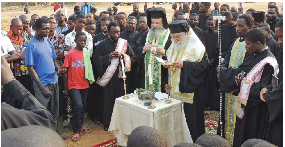
Τελώντας τὸν Ἀγιασμό τῆς θεμελίωσης ἑνὸς νέου ναοῦ τῆς Ἐπισκοπῆς

Λίγες ἡμέρες πρὶν ἀπὸ τὸν καθγιασμό τοῦ νέου θυσιαστηρίου, ἀποπερατώθηκαν μὲ ταχύτατους ρυθμούς ὅλες οἱ κατασκευαστικὲς ἀτέλειες καὶ ἐκκρεμότητες τοῦ ναοῦ. Εἶναι ἀλήθεια ὅτι ἡ ὁλο-