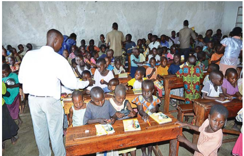
Διανομή σχολικῶν εἰδῶν στοὺς μικροὺς Μπουρουντέζους μαθητές

μητης προσφορᾶς τῶν ἐνοριτῶν τοῦ Ἁγίου Δημητρίου Λουμπαρδιάρη τῆς Ἱερᾶς Ἀρχιεπισκοπῆς Ἀθηνῶν, οἱ ὁποῖοι συγκέντρωσαν μέ ἀγάπη καί ἐπιμέλεια τό ὑλικό, προκειμένου τά παιδιά νά μπορέσουν νά ἔχουν τά ἀπαραίτητα γιά τό νέο σχολικό ἔτος.