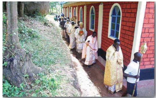
Ἀπό τά Έγκαίνια τοῦ Ναοῦ τοῦ Ἁγίου Πορφυρίου

Ἡ τελετή τῶν Έγκαίνιων, ὅπως προβλέπεται ἀπό τήν ἐκκλησιαστική τάξη, ξεκίνησε μέ τή λιτάνευση τῶν ἱερῶν λειψάνων. Ἀκολούθησε τό μύρωμα τοῦ Ναοῦ, ἐνῶ ἀμέσως μετά τελέσθηκε ἡ πανηγυρική θεία Λειτουργία, στήν ὁποία συλλειτούργησαν μέ τόν Ἐπίσκοπο πολλοί ἱερεῖς τῆς Ἱερᾶς Μητροπόλεως. Στήν ὁμιλία του ὁ Σεβασμιώτατος ἀναφέρθηκε στήν πνευματική σχέση πού εἶχε μέ τόν Ἅγιο ἀπό τήν ἐποχή τῶν φοιτητικῶν του χρόνων στήν Ἀγγλία. Τόνισε, ἐπίσης, τή σημασία τῆς παρουσίας τῶν Ἁγίων στή ζωή μας, δίνοντας ἀποδείξεις ἀπό τίς προσωπικές ἐμπειρίες τῆς γνωριμίας του μέ τόν ἅγιο Πορφύριο, χαρακτηρίζοντας τό συγκεκριμένο γεγονός ξεχωριστή εὐλογία γιά τόν ἴδιο καί τήν διακονία του στήν Ἐκκλησία.