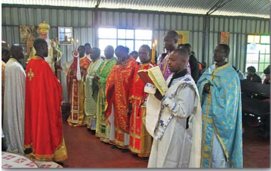
Τά Θυρανοίξια τοῦ Ναοῦ τῶν Ἁγίων Νεκταρίου καί Εἰρήνης

Τήν Κυριακή 24 Αὐγούστου 2014, ὁ Σεβ. Μητροπολίτης Κένυας κ. Μακάριος, τέλεσε τά Θυρανοίξια τοῦ Ἱεροῦ Ναοῦ πού εἶναι ἀφιερωμένος στούς Ἁγίους Νεκτάριο καί Εἰρήνην. Ὁ Ναός βρίσκεται στό Ντακορέττι, στά περὶχωρα τῆς Ναϊρόμπης καί πλησίον τῶν ἐγκαταστάσεων τῆς Πατριαρχικῆς Σχολῆς τῆς Κένυας.