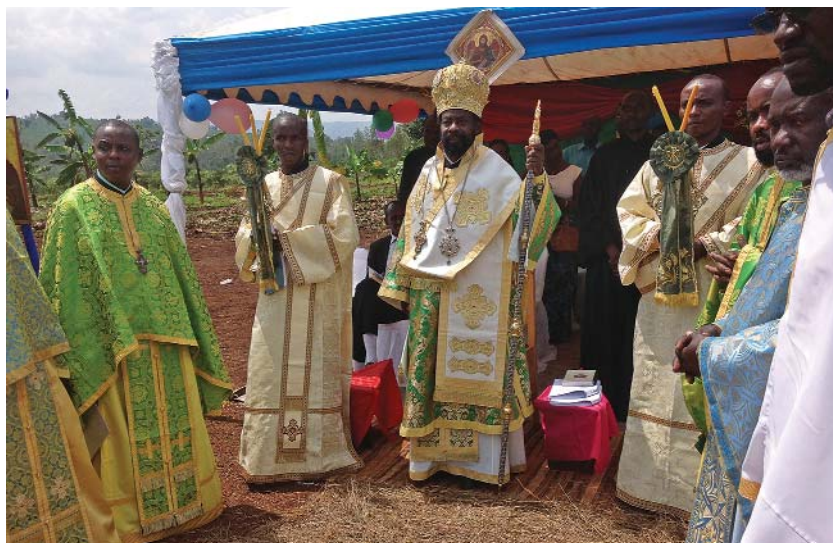
Ἀπό τήν ὑπαίθρια θεία Λειτουργία στό χωριό Καζίμπα τῆς Ρουάντας

Χιλιάδες Ρουαντέζοι νεοφώτιστοι καί κατηχούμενοι τῆς τοπικῆς Ἐκκλησίας, συγκεντρώθηκαν στή νεοσύστατη Ὁρθόδοξη κοινότητα στό χωριό Καζίμπα, στήν περιοχή Κιρέχε τῆς Ἀνατολικῆς ἐπαρχίας τῆς Ρουάντα, προκειμένου νά ἑορτάσουν τήν Ὑψωση τοῦ Τιμίου Σταυροῦ. Στήν ὑπαίθρια θεία Λειτουργία προέστη ὁ