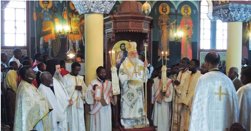
Κατά τή διάρκεια θείας Λειτουργίας στό Κολλουέζι

μας νά γνωρίζουν κάθε τί από τά γενόμενα. Στο τέλος, ἅπαντες καθίσαμε σέ κοινή τράπεζα ἀγάπης, τῆς ὁποίας τό εὐλογημένο γεῦμα εἶχε ετοιμασθεῖ ἀπό τίς καρδιακές προσφορές τῶν ντόπιων πιστῶν. Ἐμεῖς ἀπό τή μεριά μας, εἶχαμε προνοήσει καί μεταφέρει ἀρκετά εἶδη ἔνδυσης καί ὑπόδησης, γραφική ὕλη καί ἄλλα σχολικά γιά τοὺς μικροὺς μαθητές.