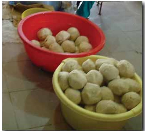
«Θά προτιμούσαν, σκέπτομαι, νά φάνε φουφού, ένα είδος ψωμιού τοπικής προελεύσεως άπό μείξη καλαμποκάλευρου και μανιόκας...»

Έορτή σήμερα του άγιου άποστόλου Τιμοθέου και μετά τον Όρθρο ό Σεβασμιώτατος κ. Νικηφόρος, τελεί τρισάγιο στή μνήμη του μακαριστού προκατόχου του κυρού Τιμοθέου. Κατά τήν άρχιερατεία του έδραιώθηκε ή Ίεραποστολή στην περιοχή τής