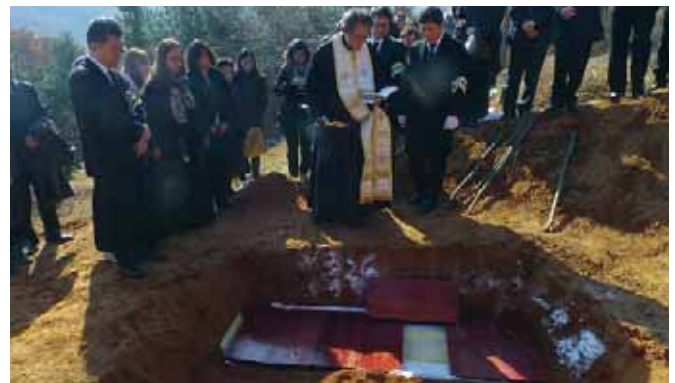
Ταφή στό Ὁρθόδοξο Κοιμητήριο τῆς Ἀναστάσεως στή Σεούλ