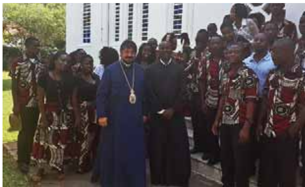
Ὁ Θεοφ. Μοζαμβίκης κ. Ἰωάννης μέ τόν π. Γεράσιμον καί νέους τῆς τοπικῆς Ὀρθόδοξης Ἐκκλησίας

Στὴν προσλαλιά του ὁ Ἐπίσκοπος κ. Ἰωάννης, μετέφερε στό ἐκκλησιαστικὸν αἶμα τοὺς χαιρετισμούς καί τίς πατρικὲς εὐχὲς τοῦ Πατριάρχου Ἀλεξανδρείας καί πάσης Ἀφρικῆς κ. Θεοδώρου Β'. Ὁ Μακαριώτατος