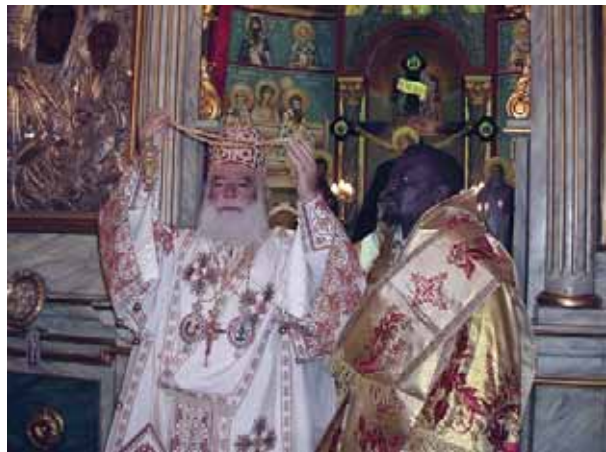
Στιγμιότυπα από τίς χειροτονίες του Ίπισκόπου Μποτσουάνας κ. Βασιλείου (άριστερά) καί του Ίπισκόπου Νιτρίας κ. Νεοφύτου (δεξιά)