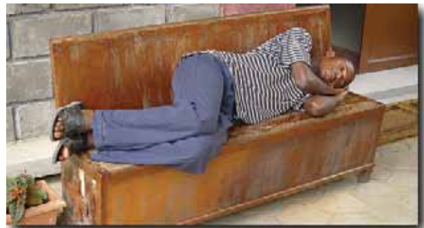
«Οἱ Ἀφρικανοί κουράζονται εὐκολα, λόγῳ τῆς συνεχοῦς καί ἐξουθενωτικῆς ζέστης, ἀλλὰ καί λόγῳ τῆς ἔλλειψης πρωτεϊνῶν...»

Μία ἡμέρα ἐντατικῶν μαθημάτων ἀρχίζει μέ τοὺς τεταρτοετείς φοιτητές νά μέ «βομβαρδίζουν» μέ ἐρωτήσεις καί ἀπορίες τους. Ἀκοῦν, μέ πολὺ ἐνδιαφέρον καί γιά πρώτη φορά, γιά τίς ἀρχαιοπρεπεῖς Λειτουργίες: τῶν Ἀποστολικῶν Διαταγῶν, τοῦ Ἁγίου Μάρκου, τοῦ Ἁγίου Ἰακώβου τοῦ Ἀδελφοθέου, τοῦ Ἁγίου Γρηγορίου τοῦ Θεολόγου κ. ἄ. Συζητοῦμε καί ἄλλα θέματα, εὐρύτερου ἐνδιαφέροντος. Ἐκεῖνο πού παρατηρῶ εἶναι ὅτι οἱ φοιτητές ἔχουν τήν ἐντύπωση ὅτι ἡ Ἑλλάδα εἶναι μιᾶ μεγάλη καί πλούσια χώρα. Διότι σκέπτονται ὅτι γιά νά βοηθᾷ ἡ Ἑλλάδα τήν Ἱεραποστολή στό Κονγκό, ἄρα θά εἶναι πολὺ μεγαλύτερη. Σημειωτέον ὅτι τό Κονγκό εἶναι 17 φορές μεγαλύτερο ἀπό τήν Ἑλλάδα! Τοὺς ἐξηγῶ, λοιπόν, ὅτι ἡ Ἑλλάδα εἶναι μιᾶ μικρὴ χώρα καί ὄχι πολὺ πλούσια. Εἶναι μεγάλη, ὅμως, καί πλούσια, ἐπειδὴ ἔχει μεγάλη ἱστορία. Ἐχει πλούσια γλῶσσα. Εὐηλογήθηκε ἀπὸ τόν Θεό μέ τήν ἐπίσκεψη τοῦ ἀποστόλου Παύλου. Ἐχει πλοῦτο μνημείων, τέχνης, λογοτεχνίας καί παραδόσεως. Οἱ κάτοικοί της εἶναι πλούσιοι γιατί ἔχουν φιλότιμο, εἶναι φιλόξενοι καί γενικά πιστεύουν στόν Θεό καί στήν Ὁρθοδοξία. Μέ ρωτοῦν, ἐπίσης, ποιός εἶναι ὁ λόγος πού ἀπό τήν Ἑλλάδα στέλνεται τόσο μεγάλη βοήθεια στήν Ἱεραποστολή. Καταλαβαίνω ὅτι ἡ ἐρώτηση ὑπονοεῖ κάποια ἐνδεχόμενη σκοπιμότητα πίσω ἀπὸ τήν βοήθεια. Τοὺς