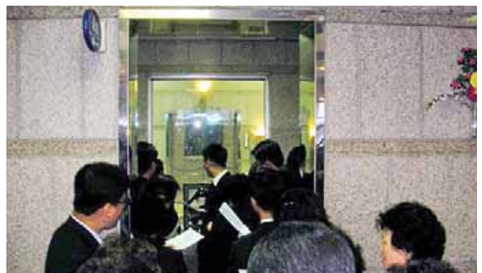
Ἀποτεφρωτήρας γιά τήν καύση τῶν νεκρῶν στή Σεούλ