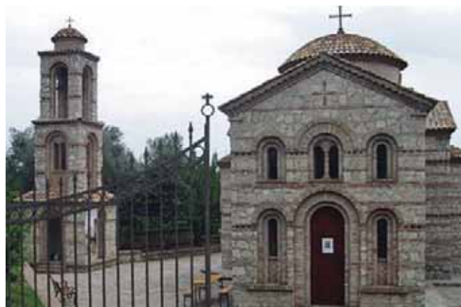
Τό Καθολικό τῆς Ἱερᾶς Μονῆς τῶν Ὁσίων Ἡλίου τοῦ Νέου καί Φιλαρέτου τοῦ Κηπουροῦ

Ἡ γῆ τῶν δύο Καλαβριῶν καί ἡ μεγαλόνησος τῆς Σικελίας, ἀποτελοῦν διαχρονικά «χρυσή σελίδα» τῆς ἱστορίας τῆς Ὁρθόδοξης Ἐκκλησίας στήν Ἰταλία, ἔχοντας ἀναδείξει μεγάλες ἐκκλησιαστικές προσωπικότητες. Μυσταγωγική ὄραση προσευχῆς, ἀλλὰ καί περίφημο ἱεραποστολικό καί πνευματικό κόσμημα,