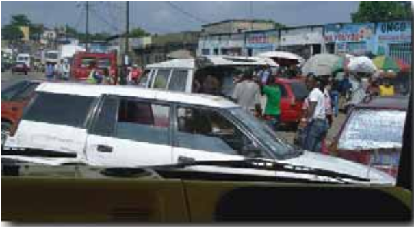
«Ή πολλή και άναρχη κίνηση στους δρόμους καθιστά τό ταξίδι τής επιστροφής μιά περιπέτεια...»

σευχή. Πέφτω γιά ύπνο, κατάκοπος άλλα πλήρης πνευματικών έμπειριών.