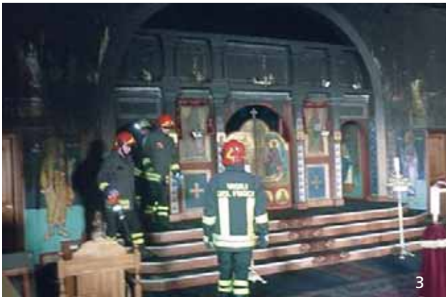
Ἡ Ἱερά Μονή τῆς Μεταμορφώσεως τοῦ Σωτῆρος καί τῆς Ἁγίας Μεγαλομάρτυρος Βαρβάρας πρὶν τὴν πυρκαγιά (φωτο 1, 2) καί μετὰ τὴν καταστροφή πού αὐτὴ προκάλεσε (φωτο 3)

ρία νά θαυμάσουν τὴν πλοῦσια λατρευτικὴ ζωὴ καὶ γενικά τίς Ὁρθόδοξες παραδόσεις. Οἱ οἰκοδομικὲς ἐργασίες στὴ Μονή, δυστυχῶς, ἔχουν σταματήσει ἐλλήψει οἰκονομικῶν πόρων. Ἡ πόλη στὴν ὁποία βρίσκεται εἶναι ἡ Σεμινάρα. Πρόκειται γιὰ τὴν πατρίδα τοῦ Βαρλαάμ, πολεμίου καὶ ἀντιπάλου τοῦ ἁγίου Γρηγορίου τοῦ Παλαμᾶ. Εἶναι ἓνα πραγματικὸ θαῦμα νά συναντᾶ κανεὶς ἓνα Ὁρθόδοξο Μοναστήρι στὴν γενέτειρα τοῦ Βαρλαάμ. Ἡγουμένη εἶναι ἡ μοναχὴ Στεφανία, σερβικῆς καταγωγῆς, χάρις στίς προσπάθειες τῆς ὁποίας ἡ Μονή, ὕστερα ἀπὸ περίπου 12 αἰῶνες, ἀναβιώνει καὶ ἔχει γίνει σπουδαῖος πόλος φιλοξενίας καὶ προστασίας τῶν Ὁρθόδοξων μεταναστῶν στὴν Ἰταλία.