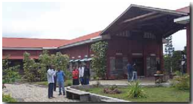
«Κατευθυνόμαστε στήν περιοχή Μόντ - Γκαφούλα, όπου βρίσκεται ή νεόδμητη Θεολογική Σχολή του Όρθόδοξου Πανεπιστημίου...»