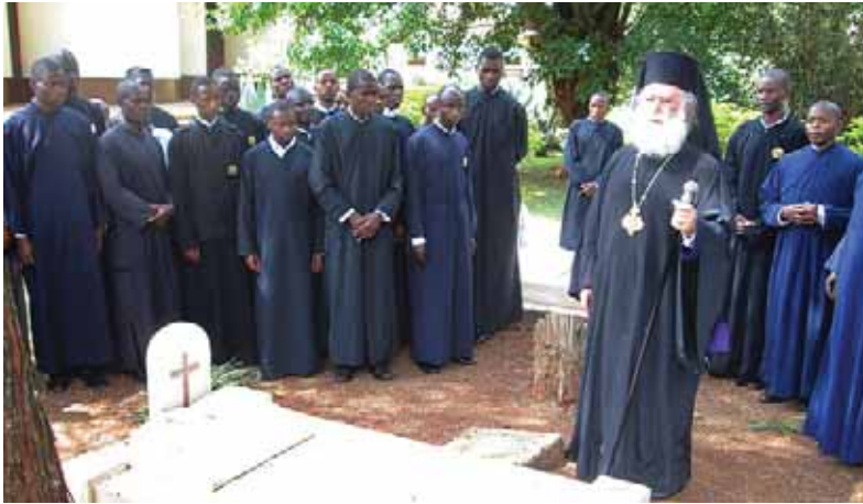
Μετά τό τρισάγιο πού τέλεσε ὁ Μακαριώτατος στούς τάφους τῶν Ἱεραποστόλων π. Ἰωάννη Ἐκο καί Μιτέρας Σταυρίτσας

Ἀπευθυνόμενος στό ἐκκλησίασμα ὁ Πατριάρχης, μεταξύ ἄλλων, ἐξέφρασε τή χαρά του διότι τοῦ δόθηκε ἡ εὐκαιρία νά ξεκινήσει τή δεύτερη δεκαετία τῆς διακονίας του στόν Πατριαρχικό Θρόνο τῆς Ἀλεξανδρείας, μέ τήν ἐπίσκεψη στήν Κένυα, τονίζοντας τό