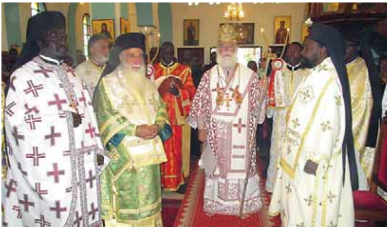
Κατά τή διάρκεια τῆς Θείας Λειτουργίας στόν Καθεδρικό Ναό τῶν Ἁγίων Ἀναργύρων τῆς Ναιρόμπι

ἐνδιαφέρον του γιά τήν πορεία τῆς Ὁρθοδοξίας στήν Ἀφρική καί ἐπικαλούμενος τήν εὐλογία τοῦ Ἁγίου Μάρκου. Μιλώντας λίγο ἀργότερα στά τοπικά μέσα μαζικῆς ἐνημέρωσης, ἀνέφερε ὅτι ὡς πνευματικός πατέρας ἀγωνίζεται καί προσεύχεται πάντοτε γιά τήν