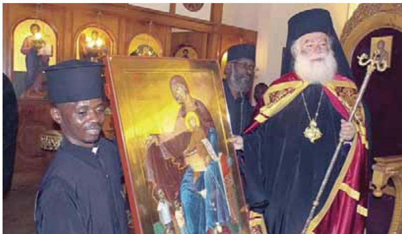
Ἡ προσφερθεῖσα εἰκόνα τῆς Παναγίας μέ τό Χριστό πού περιστοιχίζονται ἀπό ὄρφανά Ἀφρικανόπουλα

ντι καί Ρουάντας κ. Ἰννοκέντιος καί πλείαδα Ἀφρικανῶν ἱερέων. Τή θεία Λειτουργία παρακολούθησαν οἱ Πρέσβεις τῆς Ἑλλάδος, τῆς Ρωσίας καί τῆς Σερβίας, ντόπιοι ἄρχοντες καί ἑκατοντάδες Κενυάτες Ὁρθόδοξοι, οἱ ὁποῖοι ἀπό νωρίς τό πρωί κατέκλυσαν τόν Ἱε-