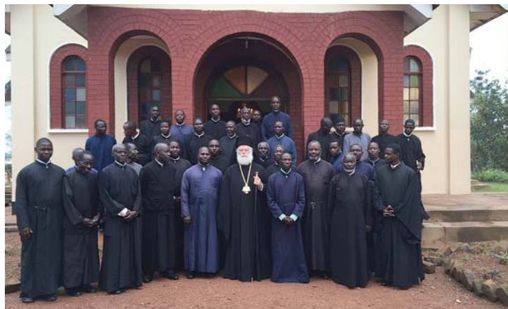
Ἡ σύναξη τῶν κληρικῶν τῆς Ἱ. Μητροπόλεως Οὐγκάντας