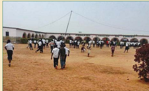
Ό Όρθόδοξος Ναός (πάνω) και οί έγκαταστάσεις του δημοτικού σχολείου «Φως του Χριστού» (κάτω)

καθηγητές τής σχολικής μονάδας, όμολογουμένως ύπήρξε καρποφόρα και πολύπλευρα άποδοτική. Τό ζήτημα τών άναγκών τής παιδείας έδώ στην Άφρική, είναι από τίς σπουδαιότερες προκλήσεις πού καλούμαστε νά άντιμετωπίσουμε και νά θεραπεύσουμε.