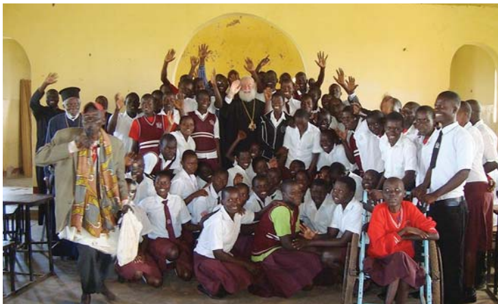
Ἀπὸ τὴν ἐπίσκεψιν τοῦ Πατριάρχου στὴν περιοχή Lira καὶ στό παρακείμενο σχολεῖο.