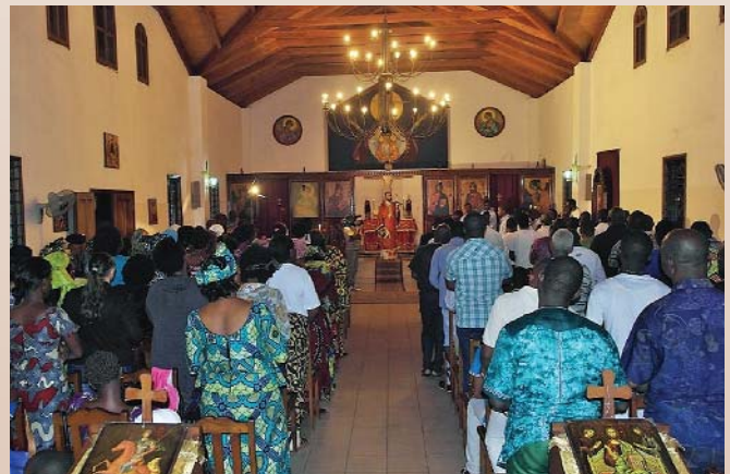
Ἡ Χριστουγεννιάτικη κατανυκτική θεία Λειτουργία

Τέλος, ἡ ἐπίσκεψη ἐκπληξῆ τοῦ «Papa Noel» σκόρπισε αἰσθήματα χαρᾶς στά μικρά παιδιά προ-