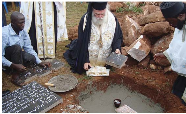
Θεμελίωση τῆς Ἀνδρώας Ἱ. Μονῆς Ἁγ. Παρασκευῆς Busana