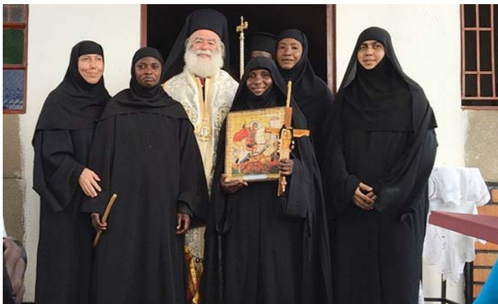
Μέ τὴν Ἀδελφότητα τῆς ἱ. Μ. Ὁσίας Μαρίας τῆς Αἰγυπτίας

γκεκριμένα τὴν Ἑνορία τοῦ Ἀποστόλου καὶ Εὐαγγελιστῆ Λουκᾶ Kabogne καὶ τὰ παρακείμενα σχολεῖα. Κατόπιν μετέβη στὴν Κλινικὴ τῆς Ἱερᾶς Μητροπόλεως καὶ ἐνημερώθηκε γιὰ τὴν προσφορά τῆς στοὺς ἀσθενεῖς τῆς περιοχῆς. Τὴν ἴδια ἡμέρα ἐπισκέφθηκε τὸ ποίμνιο τῆς Ἑνορίας τῆς Μεταμορφώσεως τοῦ Σωτῆρος Degeya, καθὼς καὶ τὸ Ὁρφανοτροφεῖο πού συντηρεῖται ὑλικά καὶ ἠθικά ἀπὸ τὴν Ἑνορία, ὅπου εἶχε τὴν πολύτιμη εὐκαιρία καὶ δυνατότητα νὰ συναναστραφεῖ τὰ παιδιά πού περιθάλπονται σὲ αὐτό. Διένειμε, ἐπίσης, ἀπαραίτητη ὑλικὴ βοήθεια καὶ ἐπαίνεσε τὴν ἐθελοντικὴ προσφορά τῶν κυριῶν πού ἐπιμελοῦνται τῶν ἀναγκῶν τῶν ὀρφανῶν.