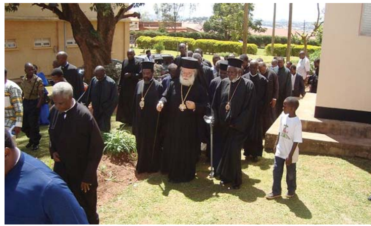
Ἐπισημία καί ὑποδοχή τῆς Α.Θ.Μ. στήν Ἱ. Μητροπόλιν Καμπάλας

Ἐπιστρέφοντας ὁ Μακαριώτατος στήν πρωτεύουσα Καμπάλα, ὅπου καί ἡ ἔδρα τῆς Μητροπόλεως, ἐπισκέφθηκε τά Ἱεραποστολικά Κέντρα, τά Ἰδρύματα καί τίς Ἐνορίες τῆς πόλης καί τῶν περιχώρων. Συ-