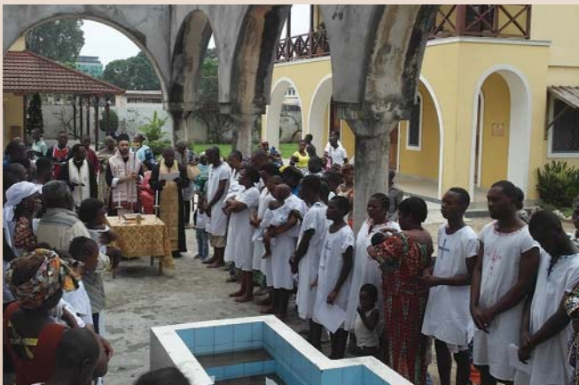
Ἀπό τίς βαπτίσεις στό Pointe Noire

Ἄπευθυνόμενος στούς νεοφύτους ἀδελφούς ὁ Θεοφιλέστατος ἐρμήνευσε θεολογικῶς τή σημασία τοῦ ἱεροῦ Μυστηρίου τοῦ Ἁγίου Βαπτίσματος καί ἐξέφρασε τή χαρά τῆς τοπικῆς Ἐκκλησίας γιά τήν ἔνταξή τους σέ Αὐτήν, προτρέποντας ὅλους νά καταστοῦν πιστά καί εὐσεβῆ μέλη Της. Σημειώνεται ὅτι αὐτήν τήν ἡμέρα τελοῦνται βαπτίσεις νέων πιστῶν σέ ὅλες τίς Ἐνορίες τῆς Ἱερᾶς Ἐπισκοπῆς.