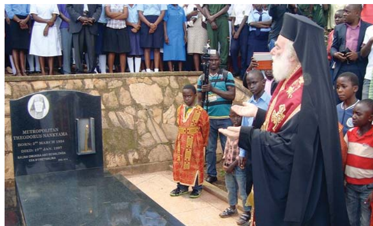
Τρισάγιο στούς τάφους τῶν ἀσίδιμων Ἀρχιερέων Χριστοφόρου καί Θεοδώρου