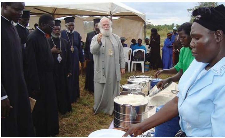
Ὁ Μακαριώτατος εὐλογεῖ τὴν προετοιμασία τῆς ἑορταστικῆς τράπεζας ἀγάπης