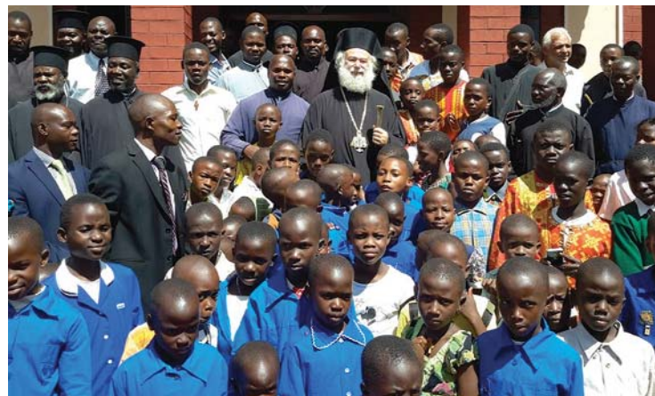
Ἀπό τήν ἐπίσκεψιν τοῦ Πατριάρχου, στά σχολεῖα τῆς Ἱ. Μητροπόλεως Καμπάλας.