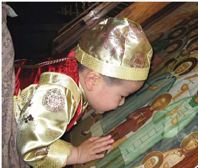
Μικρό Ὁρθόδοξο Κινεζάκι προσκυνᾷ τήν εἰκόνα τῶν Ἁγίων Μαρτύρων τῆς πατρίδας του

Εἰρήνη 20 • Ζηλιανᾶ Ἐλένη 50 • Ζυγούρα Ἀνδρέα 15 • Ἡλιάδη Γρηγόριο 10 • Ἡσυχαστήριο «ΟΙ ΑΓ. ΘΕΟΔΩΡΟΙ» 30 • Θεοδοσιάδη Εὐγένιο 40 • Θηρεσία 20 • Ι.Κ. Εὐαγγελισμοῦ 50 • Ἱεροδιακόνου Ν. Ἀνδρέα 300 • Ἰουλιανή Καθηγουμένη 20 • Ἰωαννίδου Σταματούλα 42 • Κακαράντζα Ἀντώνιο 20 • Καλογήρου Κων/νο 50 • Καλογιάννη Μακρίνα 20 • Κανταρᾶ Ἰωάννη 5 • Καπ-