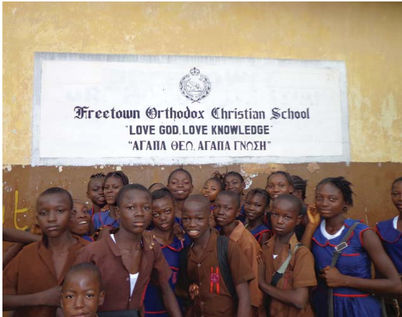
Μαθητές του σχολείου της Ίεραποστολής στη Σιέρρα Λεόνε της Ίερᾶς Μητροπόλεως Γουϊνέας

πή Άναστασία 30 • Καρπαθίου Ίσμήνη 1.000 • Κατσίκη Άθανάσιο 30 • Κερκύρα Δημήτριο 20 • Κετσιμπάση Χαρ. Μαρίκα 40 • Κληρονόμο Ίωάννη 50 • Κοκκινοφτά Κωστή 12 • Κοπιτοπούλου Έλένη 20 • Κορακιανίτου Άγ. 400 • Κορυφίδη Θεόδωρο 50 • Κοσμά Σεραφείμ 20 • Κούγια Αικατερίνη 30 • Κουίλοπούλου Έλένη 200 • Κουπαράνη Στέργιο 46 • Κουρκουμέλη Έλένη 200 • Κούστα Άλκιθέα 200 • Κουτσοκώστα Φώτιο 100 • Κρενδρόπουλο Γεώργιο 50 • Κωνσταντινίδη Γεώργιο 47,5 • Κωνσταντοπούλου Βούλα 20 • Λεβεσάνο Νικόλαο 300 • Λιβιεράτου Δήμητρα 50 • Λούκο Κων/νο 40 • Μάνεση Ίωάννα 60 • Μαραγκοῦ Στέλλα 10 • Μαργέλη Περικλή 200 • Μαρίνου Ξάνθου Ναυσικά 100 • Μαρκαντώνη Νικόλαο 15 •