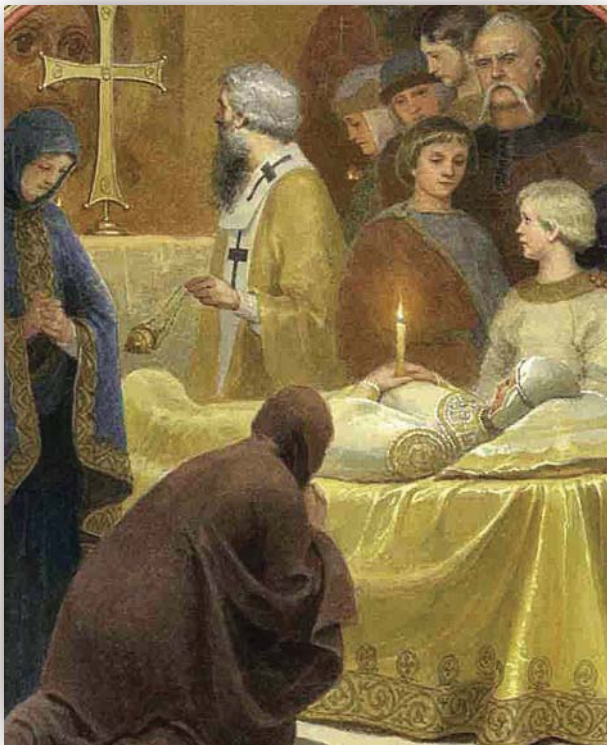
Τοιχογραφική άπεικόνιση της κοίμησης της Άγίας ΞΟλγας

Τό ίδιο χρονικό μάς πληροφορεί ότι ή ΞΟλγα, με-