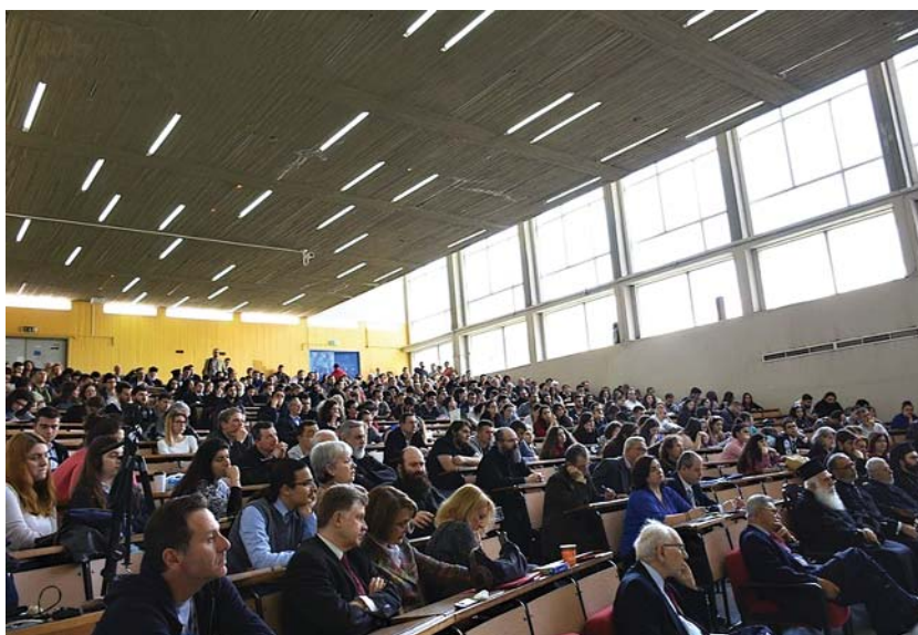
Ὁ Σεβ. Μητροπολίτης Νιγηρίας κ. Ἀλέξανδρος στό βῆμα (πάνω). Γενική ἄποψη τοῦ Ἀμφιθεάτρου τῆς Θεολ. Σχολῆς κατά τῆς ἐργασίας τῆς Ἡμερίδας (κάτω).

καί χριστιανικό φονταμενταλισμό, ἔλλειμα δημοκρατίας καί διαφθορά.