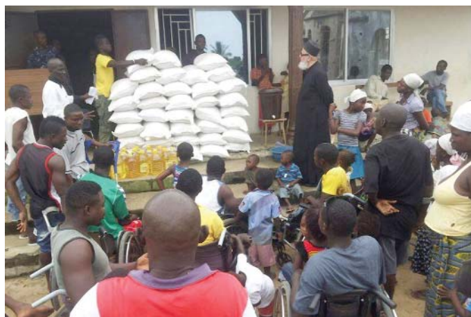
Διανομή ειδῶν πρῶτης ἀνάγκης στὴ Σιέρρα Λεόνε τῆς Ἱερᾶς Μητροπόλεως Γουινέας

15 • Μποζόπουλο Κων/νο 50 • Μπουζάνη Σοφία 30 • Μυλωνᾶ Εὐαγγελία 50 • Μυλωνάκη Θεμιστοκλή 50 • Ναό ΑΓ. ΑΠΟΣΤΟΛΩΝ Πετρ. 58,67 • Ναό ΑΓ. ΠΑΥΛΟΥ Νέων 10,09 • Νικιτέα Μαρία 6,53 • Νικολαΐδη Ἀθανάσιο 10 • Νικολόπουλο Ν.Γ. 100 • Ντουμάνη Σταματία 5 • Ὁμάδα Συμπαράστασης Ἱερ/λῆς Αἰγίου 400 • Παλαμίδα Λάζαρο 100 • Παντζοπούλου Ἀδαμαντία 50 • Παπαγιάννη Στυλ. 50 • Παπαγρηγορίου Στυλιανό