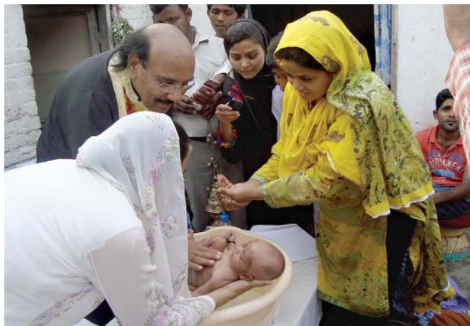
Βάπτισμα στὴ Λαχώρη τοῦ Πακιστάν

• Γρηγοριάδη Χρῆστο 50 • Δαμιανὸ Ἀναστάσιο 50 • Δανιηλίδη Χρῆστο 5 • Δεληγιάννη Χριστόδουλο 10 • Δελλή Νικόλαο 20 • Δημακοπούλου Εὐαγγελία 30 • Δημητρακοπούλου Ἀντωνία 100 • Δημητριάδου Εὐπραξία 30 • Δημητρίου Φωτεινὴ 60 • Δημούλη Φρειδερίκη 20 • Διακοδημήτρη Π. 50 • Διαλησμά Κική 100 • Δόξα Παναγιώτα 100 • Δρακάκη Μαθ. 40 • Δρακουλάκη Μενέλιος 50 • Δρόσου Βασιλική 20 • Ἐνοριακὸ Κέντρο Ἁγ. Νικολάου 150 • Εὐαγγελιάτου