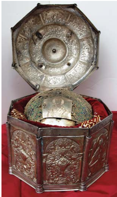
Ἡ Τιμία Κάρα τοῦ Ἁγίου Κλήμεντος Ἀχρίδος, ἡ ὁποία φυλάσσεται στήν Ἱερά Μονή Τιμίου Προδρόμου Σκῆτης Βεροίας

του Κωνσταντίνου, πού λίγο ἀργότερα, ἀφήνοντας τήν ἔδρα τῆς Φιλοσοφίας στήν Κωνσταντινούπολη, ἦρθε νά ζήσει κοντά στόν Μεθόδιο, χωρίς πάντως νά γίνει μοναχός.