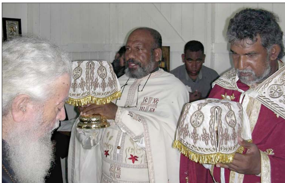
Στιγμιότυπο ἀπό τή θεία Λειτουργία στή νησιά Φίτζι. Διακρίνονται οἱ δύο ντόπιοι ἱερεῖς καί ὁ Σεβ. Μητροπολίτης Ν. Ζηλανδίας κ. Ἀμφιλόχιος