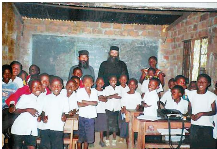
Σχολική αίθουσα στό Λουμουμπάσι του Κονγκό (Ίερά Μητρόπολη Κατάνγκας)