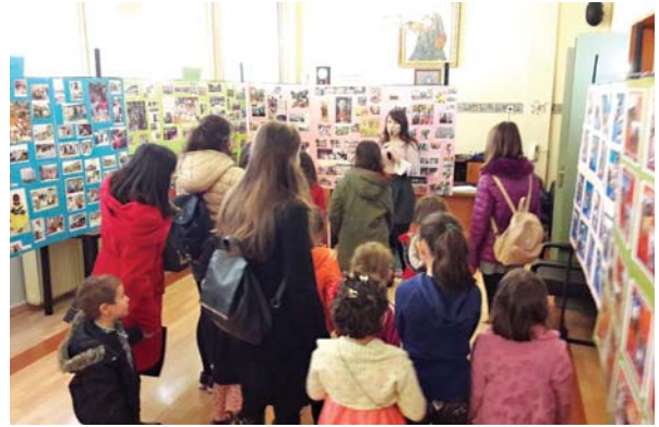
Στιγμιότυπα από τις επισκέψεις σχολείων στην έκθεση φωτογραφίας με θέμα την Ίεραποστολή

στες πτυχές από τις δράσεις των Όρθόδοξων Ίεραποστολικών Κλιμακίων σε κάθε γωνιά της γης. Νά γνωρίσει στα μέλη της, τις επίμοχθες προσπάθειες των ανθρώπων που έταξαν τη ζωή τους στο σπουδαίο έργο της διάδοσης του Ευαγγελίου εις «πάντα τά έθνη», χωρίς διάθεση προ-