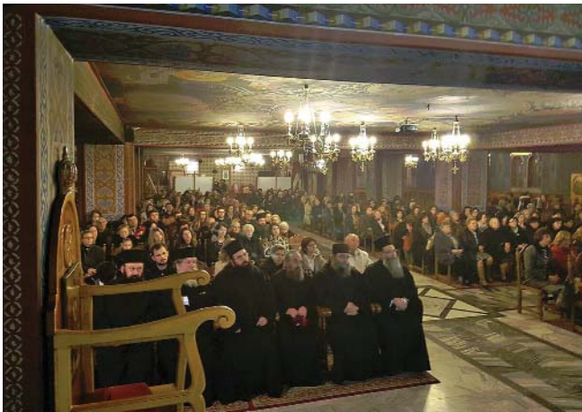
Ὁ Θεοφ. Ἐπίσκοπος Ἀρούσας κ. Ἀγαθόνικος ἀπευθύνεται στούς ἐνορίτες τοῦ Ἱ. Καθεδρικοῦ Ναοῦ Θείας Ἀναλήψεως

ραποστολή, ἐνῶ ἔλαβαν καί ἀπό ἓνα μικρό ἀναμνηστικό. Μέσα ἀπό τό ὀπτικοαουστικό ὑλικό, ἀναδείχθηκε καί παρουσιάστηκε στό κοινό, ἡ σπουδαιότητα καί ἡ ἀναγκαιότητα τῆς προσφοράς τῶν πιστῶν κάθε τοπικῆς Ἐκκλησίας στό ἔργο τοῦ εὐαγγελισμοῦ τῶν ἐθνῶν.