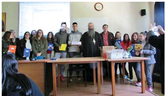
Ὁ Σεβ. Μητροπολίτης Κίτρους κ. Γεώργιος μέ νεανικές συντροφίες καί μαθητές, στοὺς ὁποίους μίλησε γιὰ τὴν Ἱεραποστολή