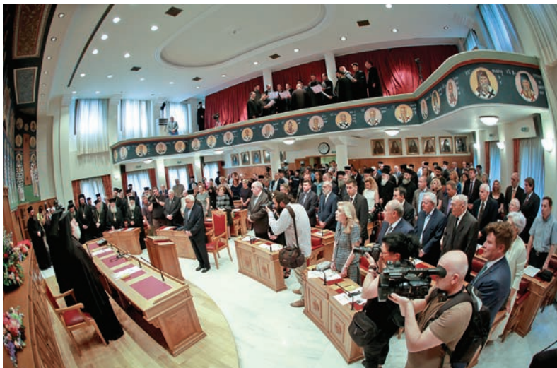
Ἡ Αἴθουσα τῶν Συνεδριάσεων τῆς Ἱεραρχίας τῆς Ἐκκλησίας τῆς Ἑλλάδος κατά τή διάρκεια τῆς ἐκδήλωσης γιά τήν ἀπονομή τῆς Τιμητικῆς Διάκρισης στήν Ἀποστολική Διακονία τῆς Ἐκκλησίας τῆς Ἑλλάδος

νίας καί τοῦ Θεολογικοῦ Φοιτητικοῦ Οἰκοτροφείου γιά Ἑλληνας ἀλλά καί ὑποτρόφους ἀλλῶν Ὀρθόδοξων Ἐκκλησιῶν πού ἔρχονται στή Χώρα μας μέ τόν θεσμό τῶν ὑποτροφιῶν. Μετά 35 χρόνια, τό 1967, ἡ Ἱερά Σύνοδος τῆς Ἐκκλησίας τῆς Ἑλλάδος, ἐπί μακαριστοῦ Ἀρχιεπισκόπου Ἱερωνύμου Α΄, ἱδρύει ἐπίσημα τό Γραφεῖο Ἐξωτερικῆς Ἱεραποστολῆς καί τό 1981, ἐπί μακαριστοῦ Ἀρχιεπισκόπου Σεραφεῖμ, μέ πρόταση τοῦ τότε Γενικοῦ Διευθυντοῦ νῦν Μακαριωτάτου Ἀρχιεπισκόπου Ἀθβανίας Ἀναστασίου, κυκλοφορεῖ τό τριμηνιαῖο ἱεραποστολικό περιοδικό «Πάντα τά Ἑθνη», στό ὁποῖο ἀποτυπώνεται ἡ ἱεραποστολική προσφορά τοῦ Ὄργανισμοῦ καί