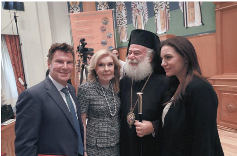
Ὁ Μακαριώτατος Πατριάρχης Ἀλεξανδρείας κ. Θεόδωρος Β΄ μετὴν ἑκπρόσωπο τῆς Νέας Δημοκρατίας κ. Ὁλγα Κεφαλογιάννη, τὴν Πρέσβειρα τῆς Οὐνέσκο κ. Μαριάνα Βαρδινογιάννη καὶ τὸν Προϊστάμενο τοῦ Γραφείου Εὐρωπαϊκῶν καὶ Πολιτιστικῶν Προγραμμάτων τῆς Ἀποστολικῆς Διακονίας κ. Δημήτριο - Ἄρη Μυλῶνα

Τί να αναριθμηθεί κανείς από τον πλοῦτον τῶν δραστηριοτήτων αὐτῆς: τὰς χορηγούμενας ὑποτροφίας δι' ἀνωτέρας σπουδὰς πτωχῶν φοιτητῶν, τὴν καταβολὴν κατὰ μῆνα μισθῶν τῶν ἀφρικανῶν μας ἀδελφῶν ἱερέων, τὰς ἐκδόσεις λειτουργικῶν βιβλίων, κατηχητικῶν βοηθημάτων, ἀλλὰ καὶ τὴν σημαντικὴν ἐκδοσὶν τοῦ ὑπὲρ ἑκατονταετιᾶν κυκλοφοροῦντος περιοδικοῦ τοῦ Θρόνου τοῦ Ἁγίου Μάρκου, ὑπὸ τὸν τίτλον «Πάνταινος»; Ταῦτα πάντα βε-