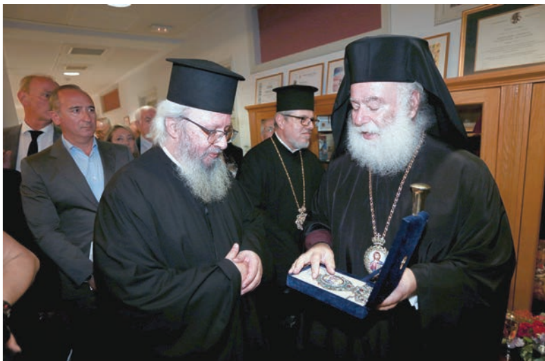
Ό Μακαριώτατος Πατριάρχης Άλεξάνδρειας και πάσης Άφρικής Θεόδωρος Β΄, περικοσμεί μέ άρχιερατικό έγκόλπιο τον Πανιερώτατο Μητροπολίτη Φαναρίου κ. Άγαθάγγελο, Γενικό Διευθυντή τής Άποστολικής Διακονίας

όποία θά δώσω λόγο στον Θεό. Κατέστην, διά τής Έκκλησίας, διάδοχος μεγάλων άνδρων και εύσεβών άνθρώπων πού ώς Γενικοί Διευθυντές έκόσμησαν τήν Έκκλησιαστική Ιστορία. Τρεις έξ αυτών ήταν Πρυτάνεις του Πανεπιστημίου Άθηνών και ένας είναι Προκαθήμενος Όρθοδόξου Έκκλησίας, ό Αρχιεπίσκοπος Άλβανίας Άναστάσιος, τον όποιο έν εύχαριστία μνημονεύω για τήν ιεραποστολική παρακαταθήκη πού μάς κληροδότησε και τά τόσα πού μέ έδίδαξε κατά τίς συναντήσεις μας. Μέ μοναδική, όμως, αυταπάρνηση διακόνησε τό έργο τής Έξωτερικής Ιεραποστολής και ό μακαριστός προκατόχος μου Μητροπολίτης Χριστουπόλεως κυρός Πέτρος, ό όποιος στήν εποχή του κλήθηκε νά αντιμετώπισει τό μεγάλο πρόβλημα τής μετακίνησης πολύτιμων και πολλών συνεργατών του ιεραποστολικού έργου από τήν Άφρική στήν Έκκλησία τής Άλβανίας λόγω τής εκλογής του Αρχιεπισκόπου Άναστασίου.