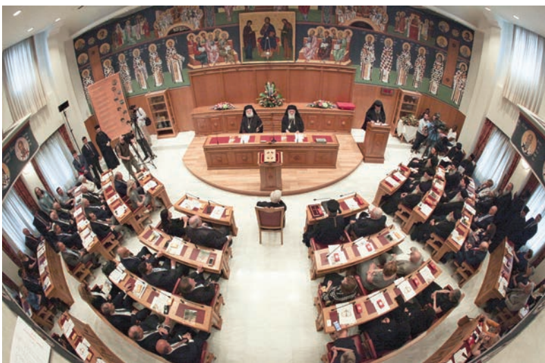
Πανοραμικὴ ἀποψη τῆς Αἴθουσας τῆς Ἱεραρχίας μέ τόν Πανιερώτατο Μητροπολίτη Φαναρίου κ. Ἀγαθάγγελο στό βῆμα, κατά τὴν διάρκεια τῆς προσφώνησής του πρὸς τόν Μακαριώτατο Πατριάρχη Ἀλεξανδρείας καί πάσης Ἀφρικῆς κ. Θεόδωρο Β΄

Ἡ Ἀποστολική Διακονία καλεῖται, μέ Ἐσᾶς πρῶτο, νά συνεχίσει τό ἔργο αὐτὸ καί νά συστηματοποιήσει τίς πρακτικές δυνάμεις τῆς Ἐκκλησίας. Γι' αὐτὸ ὑποβάλλω εὐλαβῶς πρὸς Ἐσᾶς καί τὴν Ἱερά Σύνοδο τὴν πρόταση, τό 2020, τό τρίτο δεκαήμερο τοῦ Αὐγούστου, πού εἶναι κλειστό τό Φοιτητικό Οἰκοτροφεῖο, νά διοργανωθεῖ καί νά φιλοξενηθεῖ ἐκεῖ ἓνα τριήμερο Συνέδριο γιά τὴν Ἱεραποστολή μέ