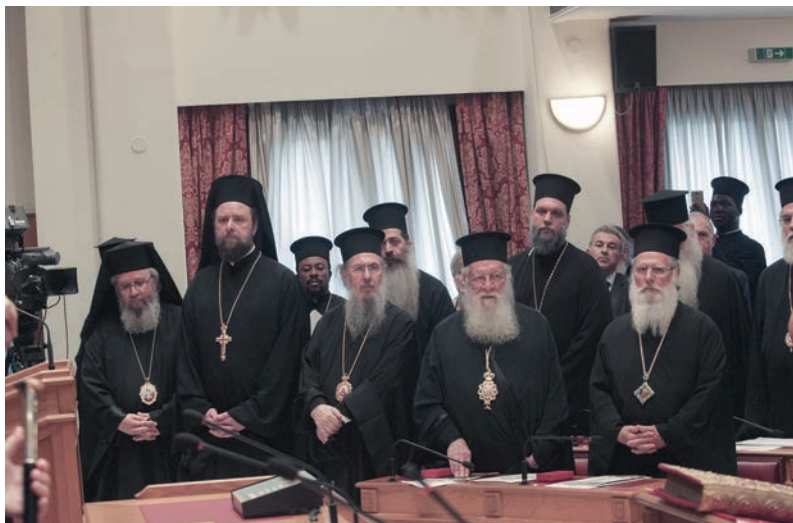
Οἱ Σεβασμιώτατοι καί Θεοφιλέστατοι Ἀρχιερεῖς μέ κληρικοῦς πού παραβρέθηκαν στήν ἐκδήλωση

γημένες ὑπάρξεις καί πολλὰ ἑκατομμύρια εὐρώ χωρίς ποτέ καμμία κρατικὴ βοήθεια. Ἡ οἰκονομικὴ ἐνίσχυση ὑπὲρ τοῦ ἱεραποστολικοῦ ἔργου προέρχεται ἀπὸ τὸν δίσκο ὑπὲρ τῆς Ἐξωτερικῆς Ἱεραποστολῆς πού περιφέρεται στοὺς ναοὺς τῆς Ἐκκλησίας τῆς Ἑλλάδος μία φορά τὸν χρόνο, ἀπὸ τίς δωρεές τῶν Χριστιανῶν, ἕνα μικρὸ Κληροδοτήμα καί τὰ ἔσοδα πού ἔχει ὁ Ὄργανισμός ἀπὸ τὰ Βιβλιοπωλεῖα του. Ὅμως οἱ ἀνάγκες στήν Ἱεραποστολὴ εἶναι τεράστιες καί καθημερινές, πολλῆς φορές δέ, εἶναι ἀνάγκες ζωῆς καί θανάτου. Σήμερα, ἡ συμπαράσταση στό ἱεραποστολικό ἔργο χρειάζεται, πέρα ἀπὸ τήν καλὴ διάθεση, ὀργανωτικὲς ὑποδομές, παραγωγικὲς δράσεις καί πρωτοβουλίες, γιά νά καταστήσει τό ἔργο τῆς συν-