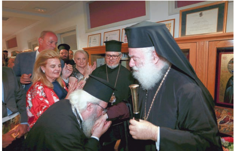
Ὁ Μητροπολίτης Φαναρίου ἀσπάζεται τή δεξιὰ τοῦ Μακαριωτάτου Πατριάρχου Ἀλεξανδρείας

περισπουδάστου καί λίαν πεφιλημένης ἡμῖν Μακαριότητος, Ἁγίε ἀδελφέ, ἐν μέσῳ ἀπάντων ὑμῶν τῶν ἐκλεκτῶν καί ἀγαπητῶν, εἰς τὰς αὐλὰς τῆς ἀδελφῆς Ἀγιωτάτης Ἐκκλησίας τῆς Ἑλλάδος, διὰ νά ἐκφράσωμεν τήν Πατριαρχικήν ἡμῶν εὐαρέσκειαν πρὸς τόν Ὄργανισμόν τῆς Ἀποστολικῆς Διακονίας τῆς Ἐκκλησίας τῆς Ἑλλάδος, ὁ ὁποῖος διεδραμάτισε καί συνεχίζει νά διεδραματίζει ἐπί ικανάς δεκαετίας σπουδαῖον ὁμολογουμένως ἔργον, οὐχί μόνον εἰς τήν διακονίαν καί προβολήν τοῦ πολυσχιδοῦς ἔργου τῆς