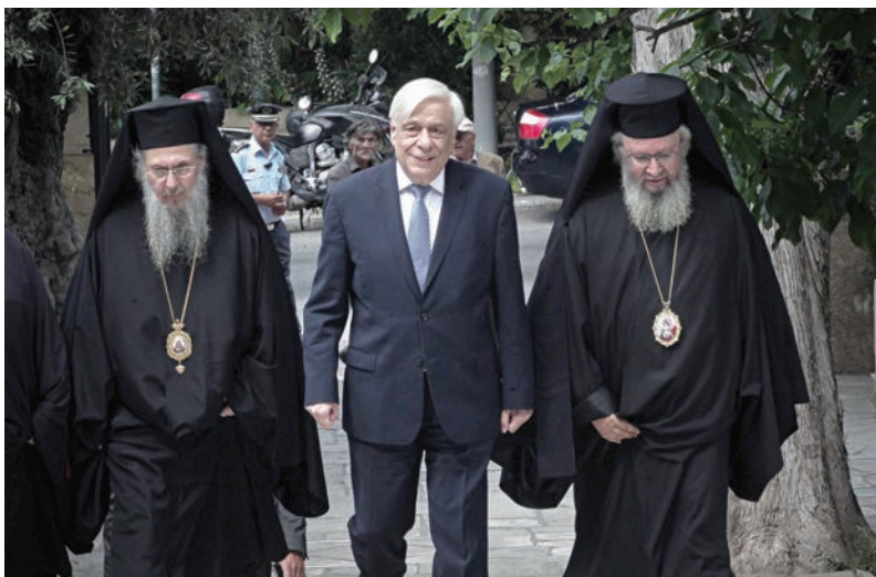
Ὁ Ἐξοχώτατος Πρόεδρος τῆς Ἑλληνικῆς Δημοκρατίας κ. Προκόπης Παυλιόπουλος προσέρχεται στήν ἐκδήλωση. Τόν συνοδεύουν ὁ Πανιερώτατος Μητροπολίτης Φαναρίου κ. Ἀγαθάγγελος, Γεν. Διευθυντής τῆς Ἀποστολικῆς Διακονίας καί ὁ Θεοφιλέστατος Ἐπίσκοπος Θαυμακοῦ κ. Ἰάκωβος, Καθηγούμενος τῆς Ἱερᾶς Μονῆς Ἀσωμάτων Πετράκη

Παρακαλῶ νά μοῦ ἐπιτρέψετε νά ἀναφερθῶ πρακτικά σέ ἓνα βασικό πυλῶνα ὕπαρξης καί δράσης τῆς Ἀποστολικῆς Διακονίας, τήν Ἱεραποστολή, καί νά δώσω μόνο τό ἱστορικό της περίγραμμα πού καθημερινά ἀποτυπώνεται στήν ἐκκλησιαστική, κοινωνική καί πολιτιστική καθημερινότητα τῶν ἀνθρώπων