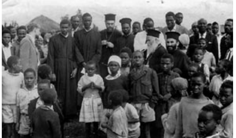
Ὁ Ἀρχιμ. Ἀναστάσιος Γιαννουλάτος, νῦν Ἀρχιεπίσκοπος Τιράνων καί πάσης Ἀλβανίας, μέ τόν Ἀρχιμ. Χρυσόστομο Παπασαραντόπουλο μέ κληρικούς καί λαϊκούς στήν Ἀνατολική Ἀφρική.

Ἐξωτερικά ἦταν ἕνας σχετικά μικρόσωμος ἄνθρωπος, μέ ἀδύνατη φωνή καί σημάδια ἀσθενικῆς κράσης. Ἀντίθετα, ὁ ἐσωτερικός