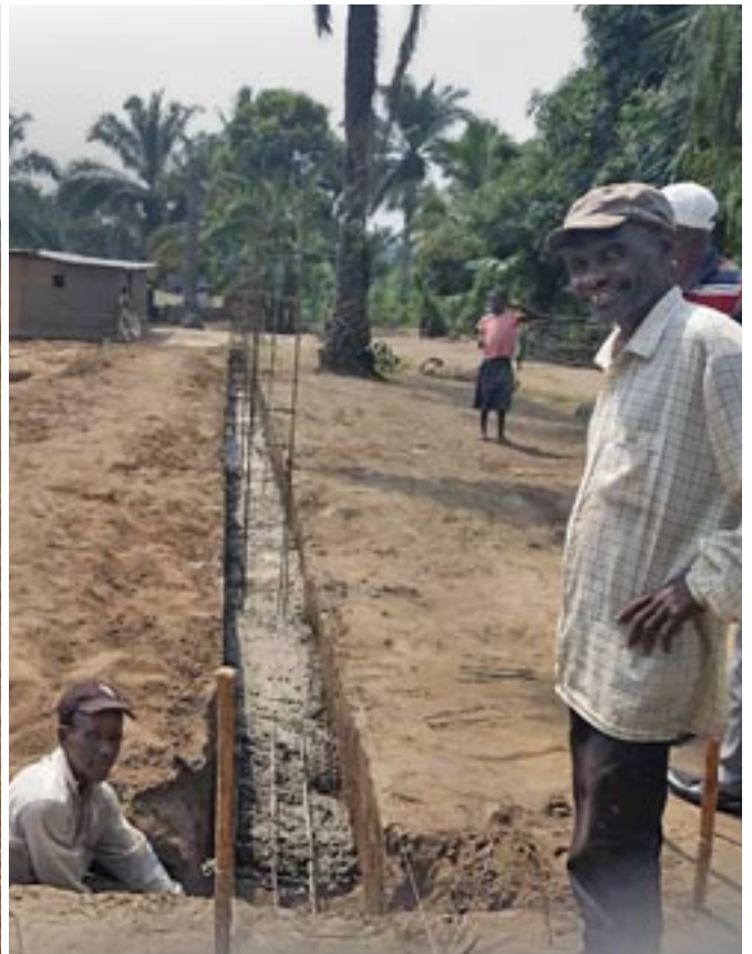
Ὁρθόδοξες γυναῖκες μεταφέρουν μέ τόν παραδοσιακό Ἀφρικάνικο τρόπο πέτρες γιά τά θεμέλια τοῦ ἱεροῦ Ναοῦ Ὁσίου Παΐσιου τοῦ Ἀγιορείτη στήν Κανάγκα (ἀριστερά). Ἀπό τίς ἐργασίες θεμελίωσης τοῦ Ναοῦ οἱ ὁποῖες συνεχίζονται μέ ἀμείωτους ρυθμούς (δεξιά).