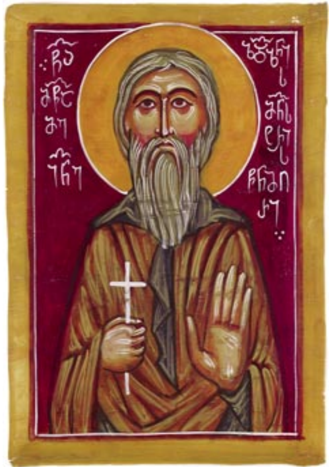
Ό Όσιος Ίωάννης Ζενταζνέλι

Η φήμη του άπλώθηκε σ' όλη τή χώρα. Ό ταπεινός άγιος, για ν' αποφύγει τήν τιμή των ανθρώπων όσο καί για νά διαφυλάξει τήν άσκητική του διαγωγή, αποσύρθηκε κρυφά μέ μερικούς ύποτακτικούς του σ' έναν έρημικό τόπο, όπου επιδόθηκε στήν άδιάλειπτη κοινωνία μέ τόν Θεό. Οι πιστοί, όταν άντιλήφθηκαν τή φυγή του, άρχισαν νά τόν αναζητούν παντού. Καί δέν άργησαν νά ανακαλύψουν τό έρημικό καταφύγιό του. Τούς τό φανέρωσε ό ίδιος ό Κύριος, πού δέν ήθελε νά παραμένει « υπό τόν μόδιον » τό έμψυχο αυτό λυχνάρι, αλλά νά τοποθετηθεί « επί τήν λυχνίαν » (Ματθ. 5,15) καί νά φωτίζει τά πάντα γύρω του. Έτσι, αναρίθμητα πλήθη άρχισαν καί πάλι νά συρρέουν από πα-