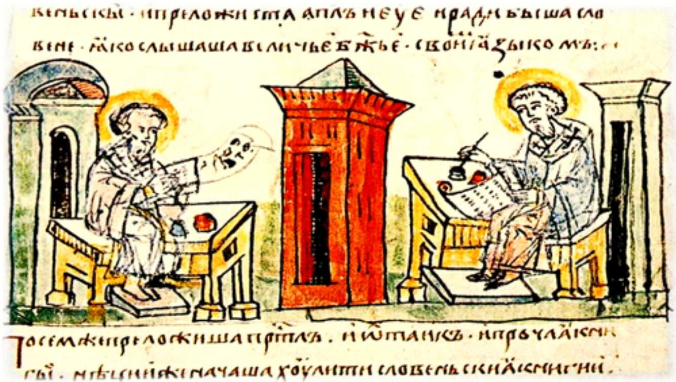
Οι άγιοι Κύριλλος και Μεθόδιος συγγράφουν και μεταφράζουν. Μικρογραφία από τό Ρωσικό Χρονικό του Ραδτζβιλ (15ος αι.).

είχε γεννηθεί στή Βουλγαρία τόν 10ο αιώνα, από ανάμιξη στοχείων του Παυλικιανισμού και του Μεσσαλιανισμού, και διαδοθεί γοργά ανάμεσα στους Σέρβους. Γιά ν' ανακόψει τό διαλυτικό έργο της ό Νεμάνια πήρε πολύ αύστηρά και άποτελεσματικά μέτρα. Συγκάλεσε σύνοδο πού καταδίκασε τήν αίρεση, καταδίωξε τούς όπαδούς της, διέταξε νά καοϋν τά βιβλία τους και άπαγόρευσε τή χρήση του όνόματός τους ως παραπλανητικού (σλαβ. Bogumili = άγαπητοί στόν Θεό).