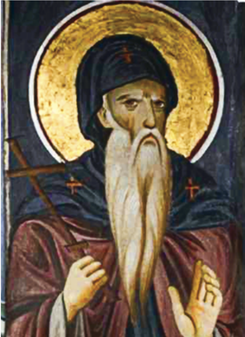
Ο άγιος Συμεών (ήγμεόνας Στέφανος Νεμάνια).

καιοδοσία του Οικουμενικού Πατριάρχη, ενώ η δυτική παρέμεινε στη δικαιοδοσία του Ρωμαίου ποντίφικα. Ο πάπας, ωστόσο, ποτέ δεν παραιτήθηκε από τα χαμένα δικαιώματά του στη χώρα. Πάντα ζητούσε τρόπους να επεκτείνει την έπρροή του στις έπαρχίες της Ανατολικής Έκκλησίας. Μέσα σ' αυτό τό ανταγωνιστικό πεδίο, οί Σέρβοι, από τόν 9ο ως τόν 12ο αιώνα,