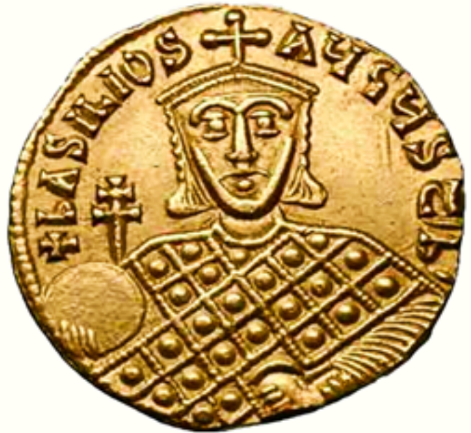
Ο άυτοκράτορας Βασίλειος Α΄ ο Μακεδών (σέ νόμισμα).

Πρέπει νά σημειωθεί, ότι ή στερέωση του Χριστιανισμού στη Σερβία οφείλεται και στο ιεραποστολικό έργο των άγιων αδελφών Κυρίλλου και Μεθοδίου, οί όποιοι, μέ έντολή του άυτοκράτορα Μιχαήλ Γ΄ (842-867) και του πατριάρχη Φωτίου (858-867, 877-886), δραστηριοποιήθηκαν έντυπωσιακά για τό φωτισμό των Σλάβων. Άνάμεσα στ΄ άλλα, επινόησαν τό σλαβικό αλφάβητο και, καθώς τό Οικουμενικό Πατριαρχείο δέν άναγνώριζε τό δόγμα τής τριγλωσσίας, μετέφρασαν τά εκκλησιαστικά κείμενα στη σλαβική γλώσσα. "Ετσι οί Σέρβοι μπορούσαν πιά και τή χριστιανική διδασκαλία νά κατανοούν και τόν Κύριο στη γλώσσα τους νά λατρεύουν, πράγμα πού διευκόλυνε τήν ένσωμάτωσή τους στην Έκκλησία. Μετά τήν κοίμηση του άγιου Μεθοδίου, τό 885, οί μαθητές του διώχθηκαν από τή Μαραβία και άναγκάστηκαν νά καταφύγουν στίς γειτονικές χώρες. Διακόσιοι άπ΄ αυτούς κατέβηκαν στη Βαλκανική και