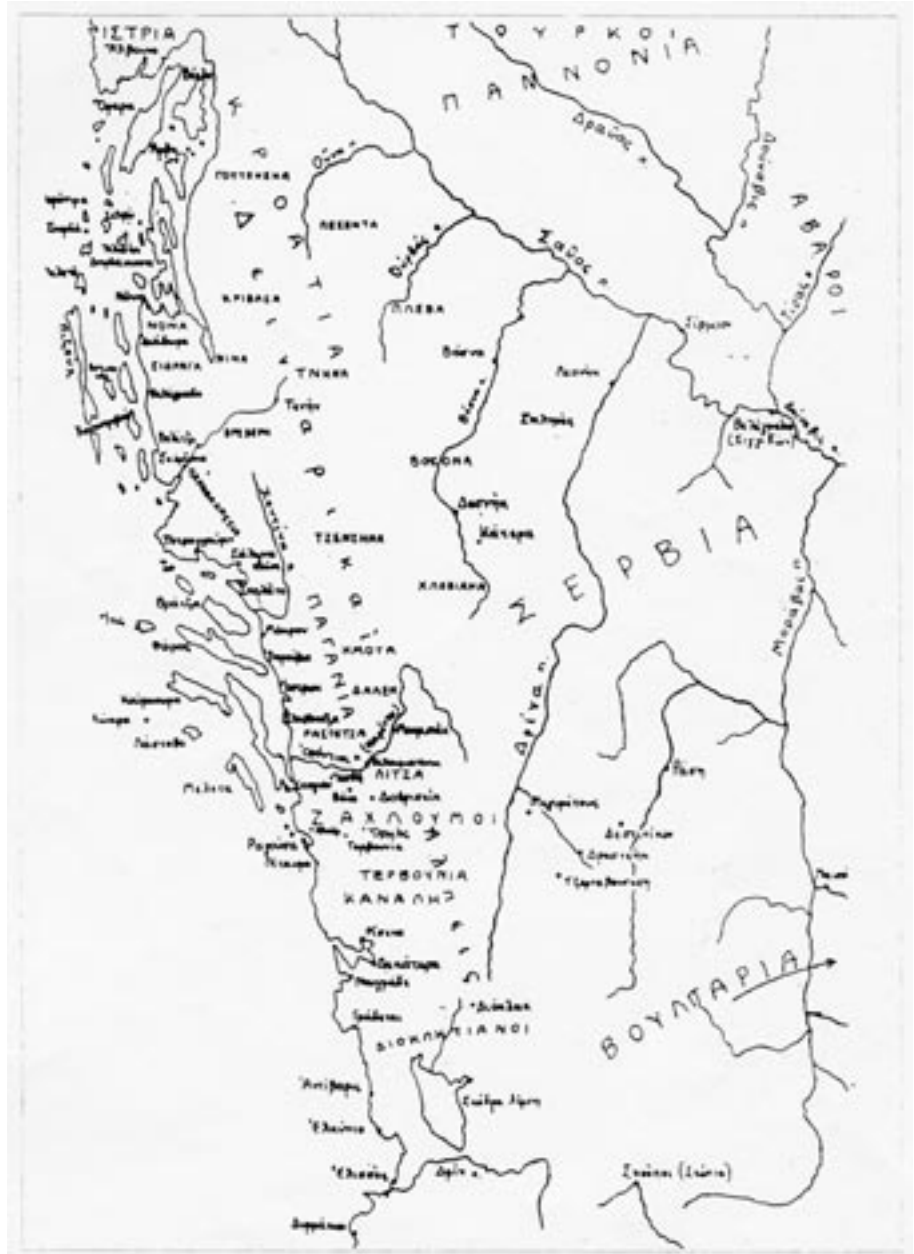
Χάρτης τοῦ χώρου ἐγκαταστάσεως τῶν Σέρβων.

ἀνήκε τότε στήν ἐκκλησιαστική δικαιοδοσία τοῦ πάπα, ὁ αὐτοκράτορας, γύρω στά 640, ἔστειλε κληρικούς ἀπό τή Ρώμη, πού κατήχησαν καί βάπτισαν ἕνα μέρος τοῦ σερβικοῦ λαοῦ. Τά ἀποτελέσματα, πάντως, ἐκείνης τῆς ἱε-