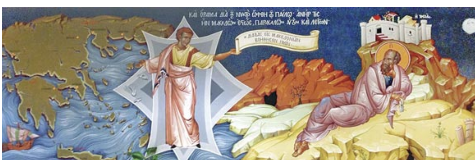
Τοιχογραφία τοῦ Συνοδικοῦ Μεγάρου πού ἀναπαριστᾶ τό ὄραμα τοῦ Ἀποστόλου Παύλου

Σέ μιά τέτοια ἐποχή, ὅμως, ἀδελφοί μου, στήν ὁποία παρουσιάζονται ὅλο καί περισσότερα παραδείγματα διαστρέβλωσης τοῦ ἐκκλησιαστικοῦ μας φρονήματος, ὅλοι μας πρέπει νά καταβάλουμε εἰλικρινή προσπάθεια, ὥστε νά μήν ὑποκύψουμε στόν πειρασμό μιᾶς ἰδιότυπης «ἀναμαρτησίας», σύμφωνα μέ τήν ὁποία ὁ ἄνθρωπος θεωρεῖ ἑαυτόν τέλειο, ἀπόλυτα ἀκέραιο στήν πίστη καί στόν ὀρθό βίο καί, ὡς ἐκ τούτου, χωρίς τήν ἀνάγκη μετανοίας καί ἐπιστροφῆς, ἀντίθετα πρός τήν πατερική καί ἀσκητική παράδοση πού μᾶς βεβαιώνει, ὅτι πάντοτε ἐν ταπεινώσει καί ποτέ μέ αἴσθησι ναρκισιστικῆς αὐτάρκειας «δίνεις αἷμα, γιά νά λάβεις Πνεῦμα», δηλαδή ἀγωνίζεσαι παρακαλώντας διαρκῶς, σάν τούς μαθητές Του, τόν Χριστό: «Κύριε, πρόσθεες ἡμῖν πίστιν». Εἶναι ἀγῶνας, προσπάθεια, πόνος καί κόπος, ἡ παρουσία τῆς πίστεως στή ζωή τοῦ ἀνθρώπου, καί