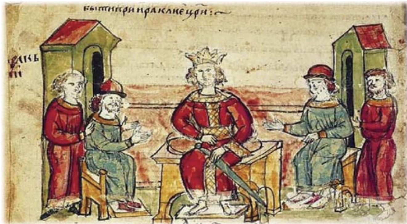
Πρεσβευτές στον αυτοκράτορα 'Ηράκλειο. Χρονικό του Radriwill του 13 ου τέλη του 15 ου αί.

ραποστολής ήταν πενιχρά. Ὁ Χριστιανισμός δέν ρίζωσε ανάμεσα στους Σέρβους, οἱ περισσότεροι ἀπό τούς ὁποίους ἔμειναν ἀβάπτιστοι γιά τρεῖς βασικά λόγους: Πρῶτον, ἐπειδή θεωροῦσαν ὅτι τό βάπτισμα σήμαινε καί συνεπαγόταν τήν ὑποταγή τους στόν Ρωμαῖο αυτοκράτορα· δεύτερον, ἐπειδή αὐτή καθεαυτή ἡ ιεραποστολική ἐργασία, πού πραγματοποιήσαν οἱ παπικοί κληρικοί, ἦταν περιορισμένη· καί τρίτον, ἐπειδή ἡ γλῶσσα τοῦ κηρύγματος καί τῆς θείας λατρείας δέν ἦταν ἡ σλαβική, ἀλλά ἡ λατινική. Ἡ Ρώμη τότε εἶχε ἐπινοήσει καί ἐπέβαλε μέ αὐστηρότητα σ' ὅλους τούς νεοφώτιστους λαούς τό περιβόητο δόγμα τῆς τριγλωσσίας. Σύμφωνα μ' αὐτό, οἱ μόνες ἱερές γλῶσσες, στίς ὁποῖες μπορούσαν νά μεταφραστούν τά Εὐαγγέλια καί ἡ θεία Λειτουργία, ἦταν ἡ ἐβραϊκή, ἡ ἑλληνική καί ἡ λατινική. Οἱ Σέρβοι, λοιπόν, πού μέ δυσκολία χειρίζονταν καί τή δική τους ἀπλή γλῶσσα, ἦταν ὑποχρεωμένοι νά μάθουν μιάν ἄλλη, πολύπλοκη καί