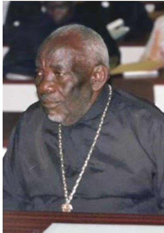
Ο πρώτος Μητροπολίτης Καμπάλας και πάσης Ουγκάντας κυρός Θεόδωρος Nawkyama (άριστερά) και ο Μακαριστός π. Ειρηναίος Magimbi (δεξιά), εκ των πρωτεργατών της 'Ορθόδοξης 'Εκκλησίας στην Ουγκάντα

Άπό τό έτος 1996, γιά τούς προαναφερθέντες λόγους, τό Βασίλειο Buganda ζητούσε άπό τήν 'Ορθόδοξη 'Εκκλησία νά άνταλλάξει τό άναξιοποίητο οικόπεδο, μέ κάποιο άλλο, τό όποίο παρεμπιπτόντως, βρισκόταν πολύ μακριά άπό τό κέντρο τής πρωτεύουσας. Τήν έποχή εκείνη ό μακαριστός Μητροπολίτης κυρός Θεόδωρος. ήταν βαρύτατα άσθενής και μετά άπό λίγο καιρό έκοιμήθη. Για τά συμφέροντα τής 'Εκκλησίας, εύτυχώς, ό άείμνηστος π. Ειρηναίος Magimbi, Μέγας Οίκονόμος τής τοπικής 'Εκκλησίας, άντέδρασε πολύ σωστά. Άντί νά διαπραγματευτεί τό θέμα τής άνταλλαγής πού έθετε ή άλλη πλευρά, πρότεινε έπιτακτικά τή μείωση του ένοικίου, τά όποία τό Βασίλειο άνέβαζε, άδιαφο-