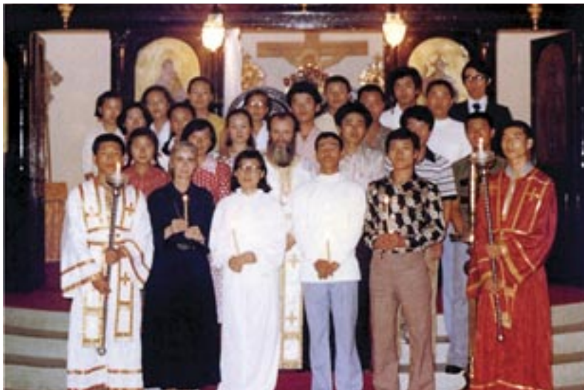
Μετά τό τέλος Όμαδικής Βάπτισης τό έτος 1977

Έτσι σιγά - σιγά, έκτός από τούς Έλληνες «προσετέθησαν τή Έκκλησία» καί πολλοί Φιλιππίνεζοι. Κτίστηκαν ναοί, χειροτονήθηκαν ιερείς, λειτουργεί δέ καί Όρθόδοξο Μοναστήρι στίς Φιλιππίνες.