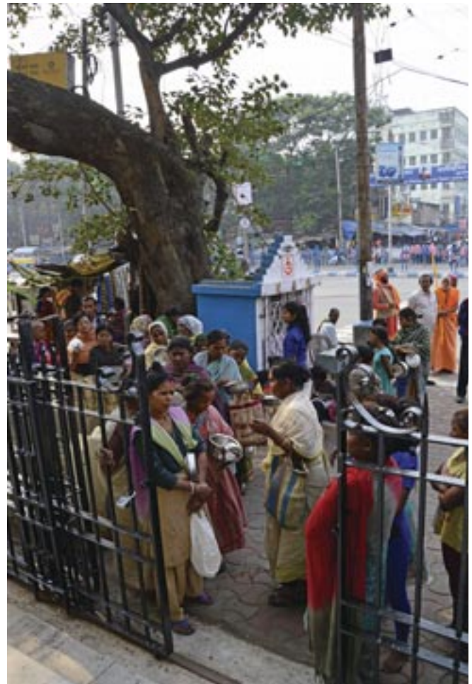
Προετοιμασία και διανομή σουσιτίου τῆς Ὁρθόδοξης Ἐκκλησίας στήν Καλκούτα