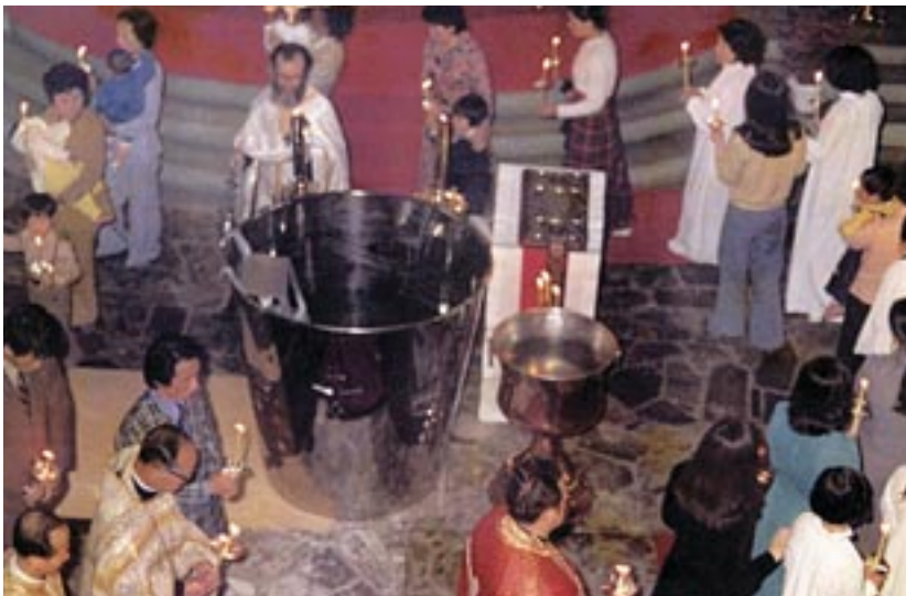
Στιγμιότυπο ἀπό ὁμαδικές Βαπτίσεις (1976)