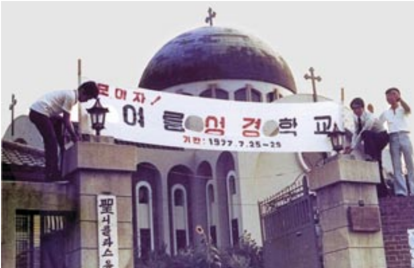
Άπό τίς προετοιμασίες του Κατηχητικού τριημέρου του καλοκαιριού του 1977

Σεβ. Πισιδίας: Περνούσε κάτω από τον Ναό του Αγίου Νικολάου της Σεούλ ένας Ινδονήσιος Σπουδαστής Προτεσταντικού Θεολογικού Σεμιναρίου. Τόν είχαν στείλει στή Σεούλ για μετεκπαίδευση. Βλέποντας εκείνος τόν μεγάλο τρούλο του Ναού μέ σταυρό στήν κορυφή, του κινήθηκε ή περιέργεια, τί μπορεί νά είναι! Θόλους έβλεπε στά τζαμιά τής πατρίδας του. Αλλά αυτό, σκεπτόταν, άφου έχει σταυρό,