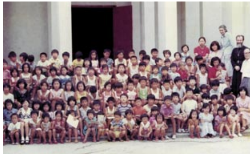
Μικρά Κορεατόπουλα στήν άγκαλιά τής Όρθόδοξης Έκκλησίας κατά τή διάρκεια του κατηχητικού τριημέρου τό έτος 1976

Π.τ.Ε.: Μέ αυτά πού μās είπατε θαυμάζει κανείς τούς τρόπους, πού χρησιμοποιεί ό Θεός για τήν επέκταση τής Έκκλησίας Του! Καί για τήν Ίνδονησία, τί έχετε νά μās πείτε;