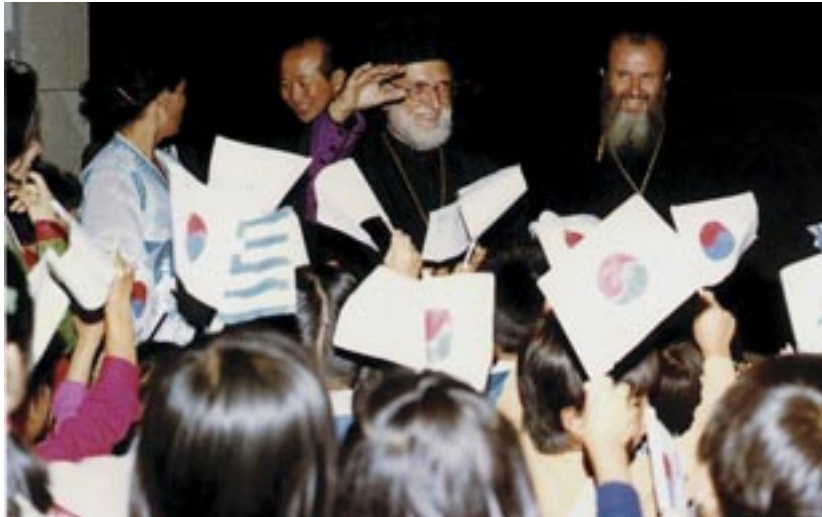
Ἵποδοχή τοῦ μακαριστοῦ Μητροπολίτη Ν. Ζηλανδίας κυροῦ Διονυσίου τό ἔτος 1978

Π.τ.Ε.: Ὅταν δημιουργήθηκαν τά ιεραποστο-