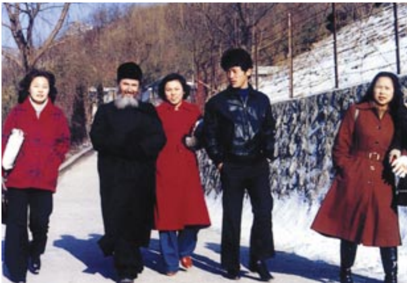
Ἐπίσκεψη ἀγάπης σέ οἶκο Εὐηγρίας τῆς Σεούλ

δρευσε Ἱερατικῶν Συνάξεων καὶ Διοικητικῶν Συμβουλίων Ἐκκλησιαστικῶν Ὄργανισμῶν καὶ ἐνδιαφέρθηκε γιὰ ἅπειρα ἄλλα. Ἔτσι δημιούργησε τὶς προϋποθέσεις, ὥστε τὸ ἔτος 1997 τὸ Οἰκουμενικὸ Πατριαρχεῖο νὰ ἰδρύσει νέα Ἱερά Μητρόπολη μὲ ἔδρα τὸ Χόνγκ Κόνγκ, στὴν ὁποία περιελήφθησαν οἱ χώρες τῆς νοτιοανατολικῆς Ἀσίας».