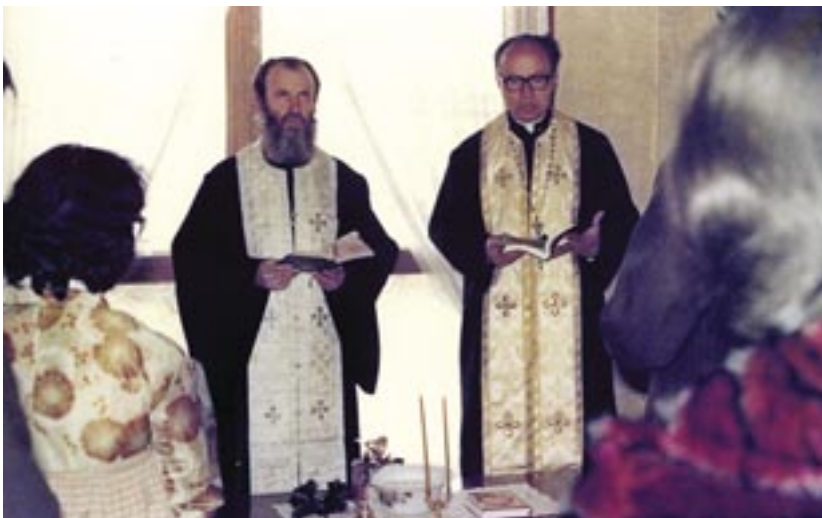
Ἁγιασμός σέ διαμέρισμα πού ἀγοράσθηκε μέ δωρεά τῆς Ἀποστολικῆς Διακονίας τῆς Ἐκκλησίας τῆς Ἑλλάδος γιά κατοικία τοῦ ἱερέως (1976)