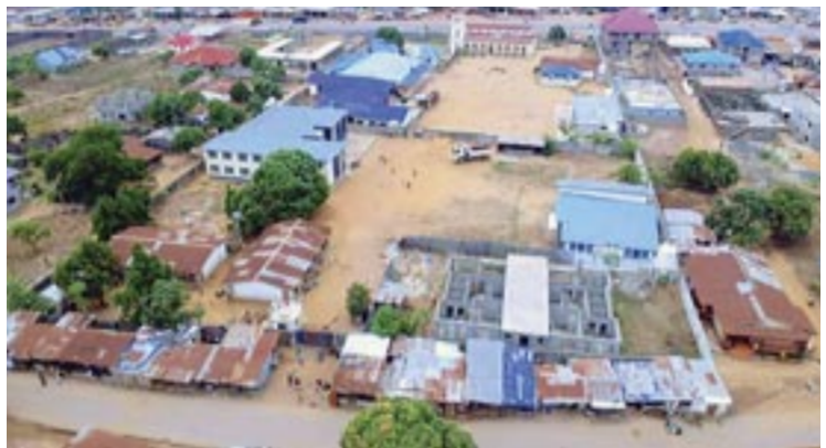
Τό Ἱεραποστολικό συγκρότημα στήν πόλη Βατερλώ