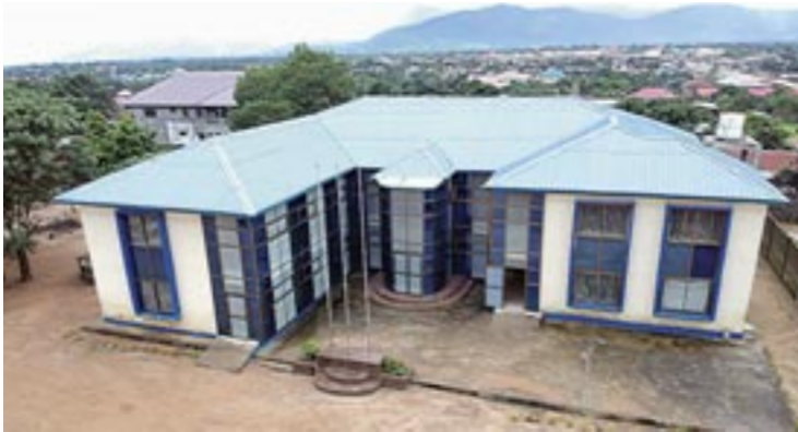
Τό Δημοτικό σχολείο στην πόλη Βατερλώ