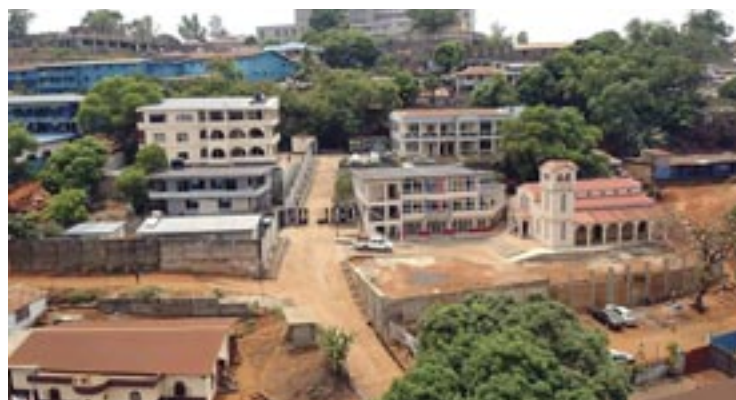
Η έδρα της 'Ιεραποστολής στην περιοχή Τάουερ Χιλ της πρωτεύουσας Φρήταουν

ρων σκλάβων από την Άμερική. Τόν 19ο αιώνα δραστηριοποιήθηκαν στην περιοχή Προτεστάντες και Ρωμαιοκαθολικοί ιεραπόστολοι, ενώ η Όρθοδοξία έκανε την εμφάνισή της πολύ αργότερα, τής δύο τελευταίες δεκαετίες του 20ου αιώνα μέ τής πρώτες ιεραποστολικές προσπάθειες του Πατριαρχείου Άλεξανδρείας.