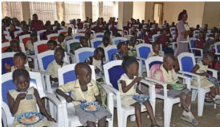
Όρα φαγητού στό Δημοτικό σχολείο στην πόλη Βατερλώ

τίθεται ζεστό γεύμα για όλους τους έκκλησιαζόμενους στην εύρύχωρη αίθουσα έκδηλώσεων, η οποία διαθέτει και κουζίνα, όπου ετοιμάζεται σε καθημερινή βάση το φαγητό των μαθητών και των εκπαιδευτικών των δύο σχολείων του συγκροτήματος. Δίπλα