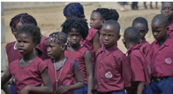
Μαθητές του Δημοτικού σχολείου στην πόλη Βατερλώ