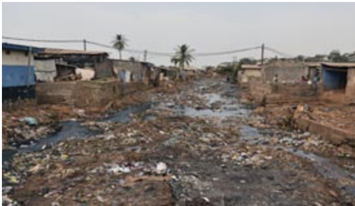
Ο Ποταμός Τζώρτζ Μπρούκ στην παραγκούπολη Κρού Μπέϊ