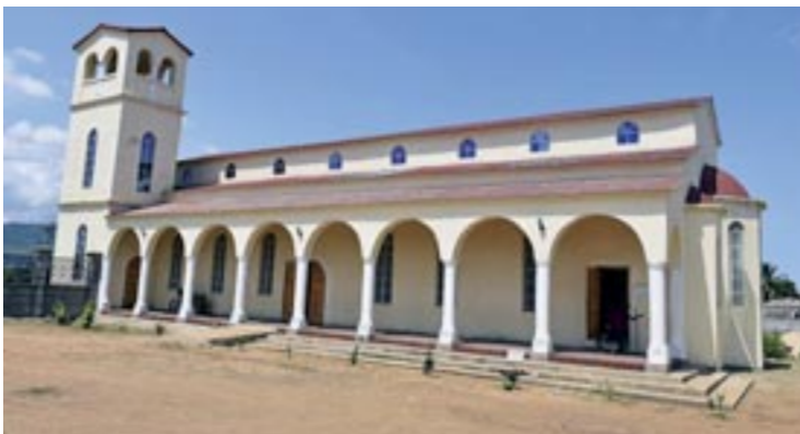
Ὁ Ναός Μεταμορφώσεως τοῦ Σωτήρος καί τοῦ Ἁγίου Μωϋσέως τοῦ Αἰθίοπος στήν πόλη Βατερλώ

Ξεχωριστή θέση στό ὄλο φιλανθρωπικό ἔργο τῆς Ἱεραποστολῆς ἀποτελεῖ τό ἐκπληκτικό ἐπιπέδου Ὀρφανοτροφεῖο τοῦ Ἁγίου Ἰακώβου, ὅπου φιλοξενούνται 16 βαπτισμένα ὀρφανά ἀπό τήν ἐπιδημία τοῦ Ἔμπολα (μικρά παιδιά, ὀκτώ ἀγόρια καί ὀκτώ κορίτσια). Ἡ ἐπιδημία τοῦ ἰοῦ Ἔμπολα, πού σάρωσε τή χώρα τό 2014 σκοτώνοντας μέ πολύ ἐπώδυνο τρόπο