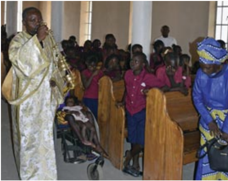
Λατρευτική σύναξη στο Ναό Μεταμορφώσεως του Σωτήρος και Αγίου Μωϋσέως του Αιθίοπος στην πόλη Βατερλώ