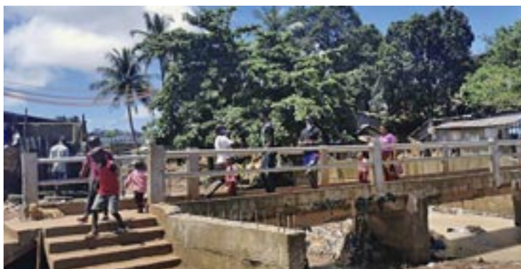
Η πλήρως ανακαινισμένη γέφυρα στην παραγκούπολη Κρού Μπέϊ της πρωτεύουσας