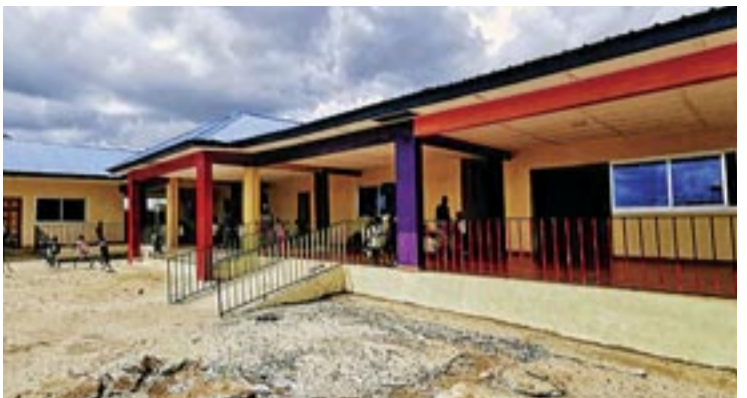
Τό νεόδμητο Νηπιαγωγείο στήν πόλη Βατερλώ