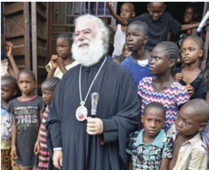
Ὁ Πατριάρχης Ἀλεξανδρείας κ. Θεόδωρος Β΄ μέ παιδιά τῆς παραγκουπόλεως Κρού Μπέϊ

ἐκατοντάδες ἀνθρώπους, ἄφησε πίσω τῆς πάμπολλα ὀρφανά παιδιά κι ἀπό τούς δύο γονεῖς, τά ὅποια κυριολεκτικά δέν εἶχαν στόν «ἥλιο μοίρα». Ἐνδεικτική τοῦ θυσιαστικοῦ ὀρθόδοξου ἠθους ἦταν ἡ σταθερή ἀπόφαση τοῦ π. Θεμιστοκλή νά παραμείνει δίπλα στούς χειμαζόμενους ἀδελφούς μας, παρά τίς προτροπές πολλῶν νά φύγει ἀπό τή σκληρά δοκιμαζόμενη χώρα, ὅταν ὄλοι σχεδόν οἱ ξένοι τήν ἐγκατέλειπαν ἐσπευσμένα πρῖν ἀποκλειστοῦν σ' αὐτήν. Μέ τή χάρη τοῦ Θεοῦ κανεῖς ἀπό τήν ὀρθόδοξη Κοινότητα δέν προσβλήθηκε ἀπό τήν ἐξαιρετικά μολυσματική αὐτή ἀσθένεια, πού μεταδιδόταν μέ τήν παραμικρή ἐπαφή μέ ἄνθρωπο πού νοσοῦσε.