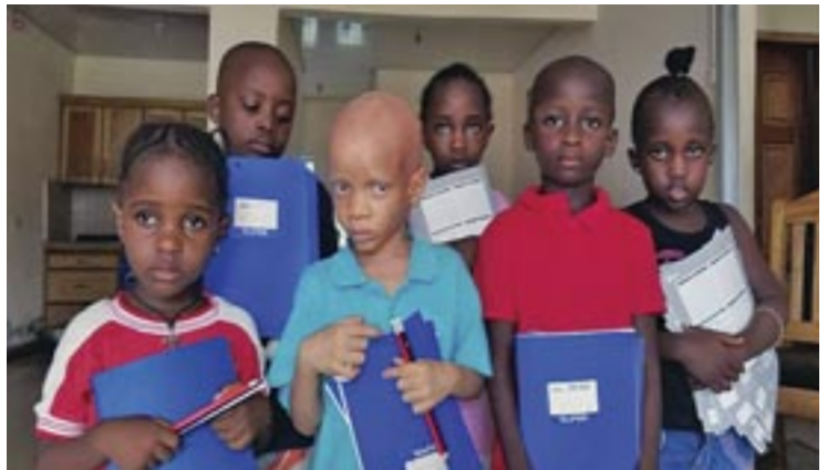
Διανομή τετραδίων στό παιδιά του 'Ορφανοτροφείου

'Η 'Ενορία τών Άγίων 'Ελευθερίου καί Γεωργίου στήν όδό Σάικ (Syke street) στή συνοικία τής Άναλήψεως (Ascension Town), επίσης στό κέντρο τής πρωτεύουσας είναι ή παλαιότερη τής 'Ιεραποστολής. Μέσα στον περίβολο δεσπόζει ο όμώνυμος Καθεδρικός Ναός, ο μεγαλύτερος ορθόδοξος ναός στή χώρα, χορηγία επίσης του 'Ιεραποστολικού Συνδέσμου «'Αγιος Κοσμάς ο Αίτωλός». Σ' αυτόν τέλεσε τήν 24η Φεβρουαρίου 2012