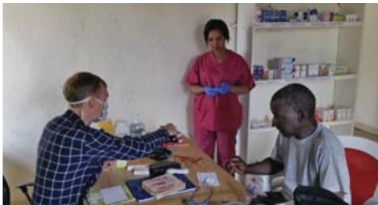
Τό ἰατρεῖο στή πόλη Βατερλώ