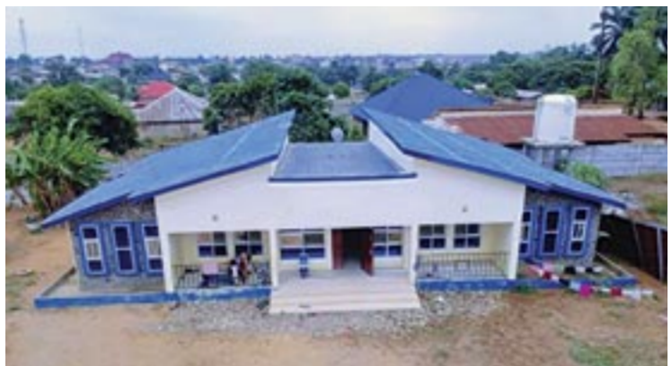
Τό Ὁρφανοτροφεῖο στήν πόλη Βατερλώ

στολή ἑνός κτηρίου γιά τή φιλοξενία ἑνός λυκείου. Μέ αὐτόν τόν τρόπο, ἑκατοντάδες παιδιά ἀπό τήν τρυφερή ἡλικία τοῦ νηπιαγωγείου ἕως καί τήν ἀποφοίτησή τους ἀπό τό λύκειο, θά γαλουχοῦνται στά