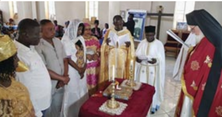
Τέλεση τοῦ μυστηρίου τοῦ Γάμου στό Ναό τῶν Ἁγίων Ἐλευθερίου καί Γεωργίου στήν ὁδό Σάϊκ τῆς πρωτεύουσας