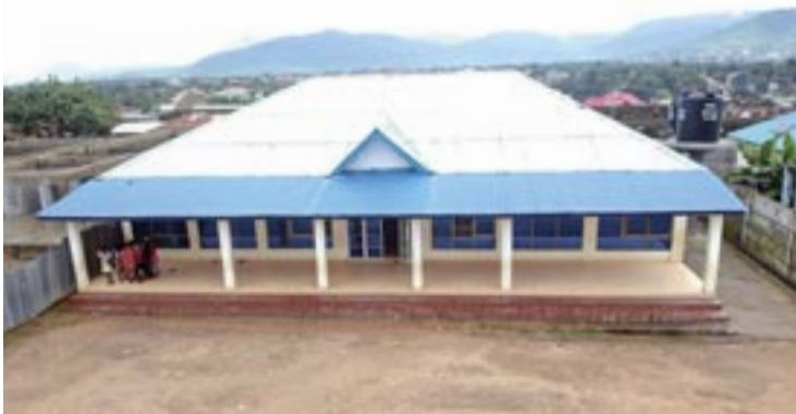
Ή αίθουσα έκδηλώσεων στην πόλη Βατερλώ