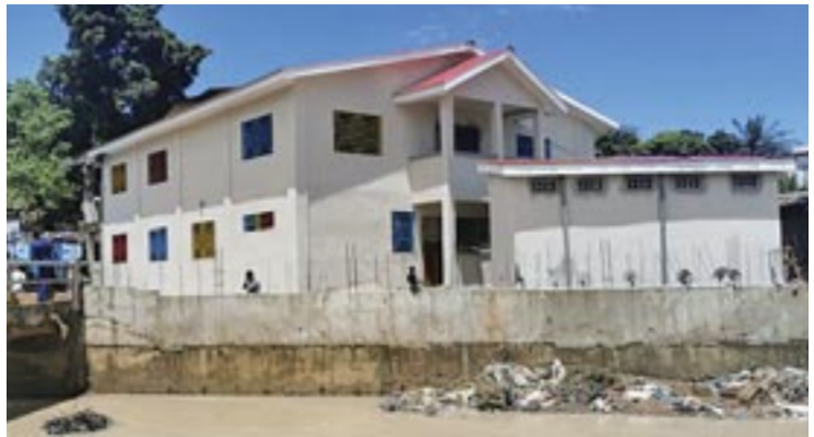
Τό νεόδμητο σχολεῖο στήν παραγκούπολη Κρού Μπέϊ τῆς πρωτεύουσας Φρήταουν

Διακαῆς πόθος τοῦ π. Θεμιστοκλή ἀποτελεῖ, ὅποτε ὁ δωρεοδότης Κύριος εὐδοκήσει, ἡ ἀνέγερση ἀπό τήν Ἱεραπο-