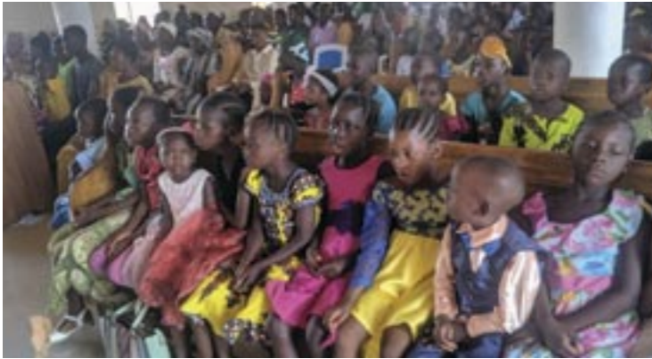
Λατρευτική σύναξη στο ναό τῶν Ἁγίων Ἐλευθερίου καί Γεωργίου στήν ὁδό Σάϊκ τῆς πρωτεύουσας