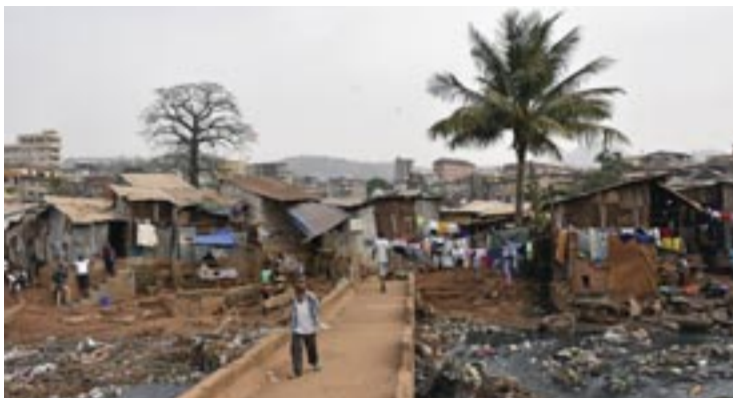
Η γέφυρα του Ποταμού Τζώρτζ Μπρούκ πριν την αναμόρφωσή της

ένδημη στή χώρα πολυομελίτιδα. Οί οικογένειες συντηρούνται από την Ίεραποστολή και παράλληλα ένθαρρύνονται οί γονείς νά άποκτήσουν κάποιες δεξιότητες, ώστε σταδιακά νά μπορέσουν νά άυτονομηθούν οικονομικώς, στηριζόμενοι στίς δικές τους