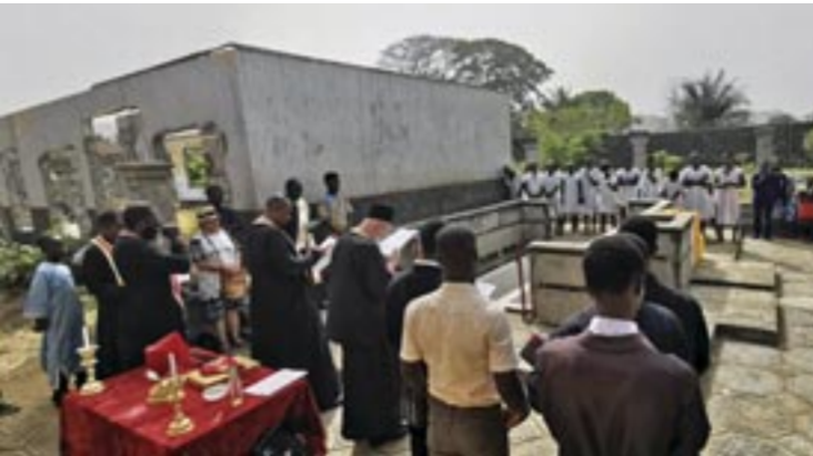
Βαπτίσεις στήν πόλη Βατερλώ

γων οἰκογενειῶν ἀναπήρων τοῦ ἐμφυλίου καί τῆς μάστιγας τῆς πολυομιελίτιδας, σέ οἰκόπεδο πού παραχωρεῖται στήν Ἱεραποστολή στήν πόλη Βατερλώ (Waverloo) 33 χλμ. νοτιανατολικά τῆς πρωτεύουσας.