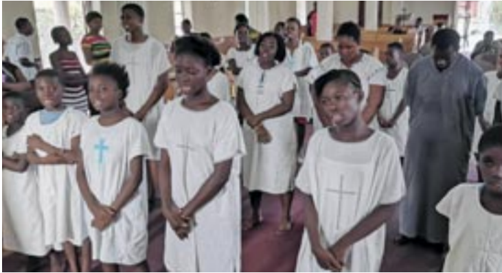
Προετοιμασία γιά τή Βάπτιση στό ναό Μεταμορφώσεως του Σωτήρος και Αγίου Μωϋσή του Αίθίοπος στην πόλη Βατερλώ

κλής στην αρχή της ιεραποστολικής προσπάθειάς του στή χώρα. Ο άνθρωπος αυτός μιά μέρα έκλεψε τό μοναδικό όχημα πού διέθετε τό ιεραποστολικό κλιμάκιο. Καθώς ώστόσο οδήγώντας άπομακρυνόταν, έχασε τόν έλεγχο του όχήματος και προσέκρου-