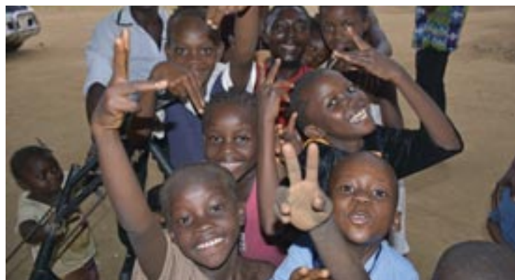
Παιδιά στην πόλη Βατερλώ