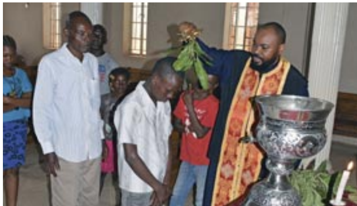
Αγιασμός στον ναό των Αγίων Κωνσταντίνου και 'Ελένης