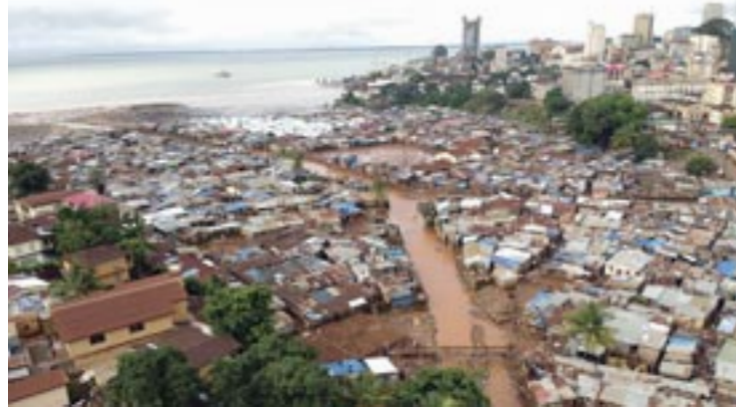
Ἡ παραγκοῦπολη Κρού Μπέι ἀπό ψηλά

Ὁ Χριστιανισμός ἔφθασε στά τέλη τοῦ 18ου αἰῶνα, στή μουσουλμανική ἀπό τόν 16ο αἰῶνα ὑποσαχάρια Δυτική Ἀφρική, μέσω ἀπελεύθε-