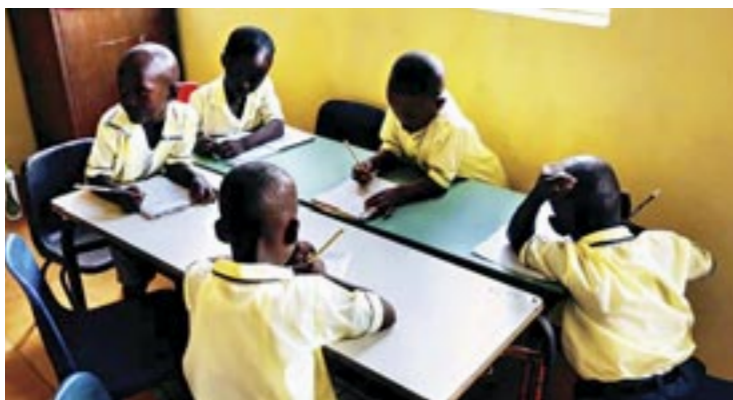
Όρα μελέτης στό Δημοτικό σχολείο της πόλεως Βατερλώ