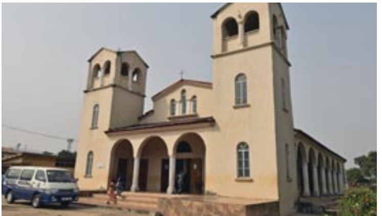
Ο Καθεδρικός ναός τών Άγίων 'Ελευθερίου καί Γεωργίου στήν πρωτεύουσα Φρήταουν

τήν πρώτη Πατριαρχική θεία Λειτουργία ο Μακαριώτατος Πατριάρχης Άλεξανδρείας καί πάσης Άφρικής κ. Θεόδωρος Β', κατά τήν τότε πρώτη Πατριαρχική 'Επίσκεψη στό 'Ιεραποστολικό Κλιμάκιο.