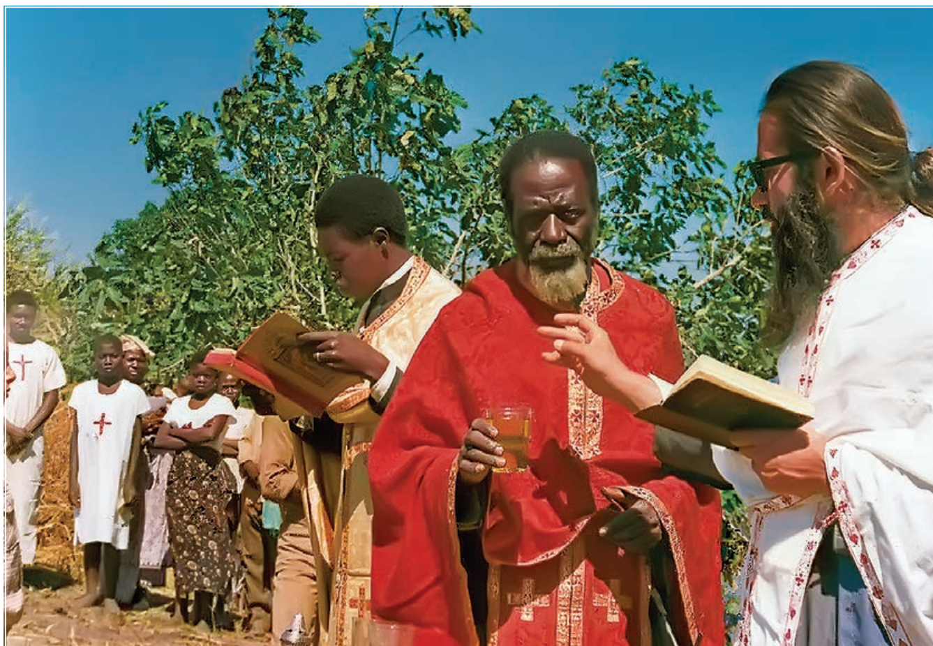
Όμαδικό βάπτισμα σέ ποτάμι

προβλήματα τῶν ἀνθρώπων· στήν πείνα, στήν φτώχεια, στίς ἀσθένειες καί στόν πόνο τους. Μέσα του ἤκουσε ἡ φωνή τοῦ Ἀποστόλου Παύλου: «Τίς ἀσθενεῖ, καί οὐκ ἀσθενῶ;» (Β΄ Κορ. 11, 29). Κέντρο τῆς ζωῆς του δέν ἦταν ὁ ἑαυτός του, ἀλλά ὁ πλησίον, ἀκόμα καί ἕνας πού τόν θεωροῦσαν οἱ ἄλλοι ἀνύπαρκτο.