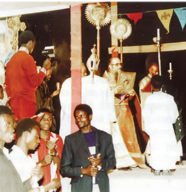
Από τις Ακολουθίες της Μεγάλης Πέμπτης (πάνω) καί της Αναστάσεως (κάτω)

Σέ ἐπιστολή του τόν Φεβρουάριο τοῦ 1982 ἔγραφε: «Μεγάλη παρηγοριά ἐλάμβαναν οἱ ἄνθρωποι τῶν φυλακῶν τῆς πόλεως, διακόσια (200) ἄτομα. Τούς πηγαίναμε φαγητά καί ροῦχα. Φάρμακα καί ἄλλα εἶδη. Ἀναλάβαμε νά βοηθοῦμε ὄσους εἶχαν τήν ἀνάγκη μας. Εἰς ὁμιλία μου τοῦς εἶπα: “Εἰς τό ἐξῆς, ὅταν βρῖσκεστε ἔξω, νά ἔρχεστε στήν Ἱεραποστολή νά σᾶς βοηθοῦμε καί νά μὴν ἐπαναλαμβάνετε τήν παλιά σας ζωή”.