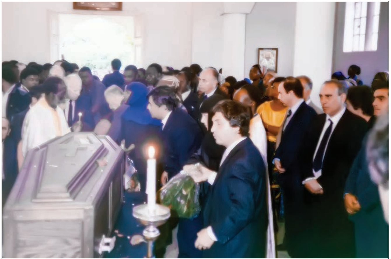
Στιγμιότυπο από την Έξόδιο Άκολουθία του μακαριστού Γέροντα π. Κοσμᾶ Γρηγοριάτη (1989)

σύντομο. Ὁ ζηλωτής τοῦ Εὐαγγελισμοῦ τῶν Ἀφρικανῶν, Ἀρχιμανδρίτης π. Κοσμᾶς Γρηγοριάτης, βύθισε σέ πένθος ὄχι μόνο τό Κολουέζι καί τίς γύρω περιοχές τοῦ Κονγκό, ἀλλά καί κῶρες ὅπου ἦταν γνωστός γιά τό Ἱεραποστολικό του ἔργο.