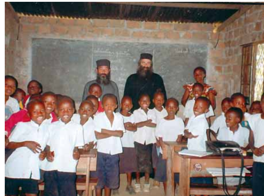
Αϊθουσα από παλιό σχολείο στον άγιο Στέφανο Κατούμπα Λουμουμπάσι, Κογκό.

Άνώνυμο (Γ.Ε. 2983) 100 • Άνώνυμο (Γ.Ε. 1842) 130 • Άνώνυμο (Γ.Ε. 1841) 30 • Άνώνυμο (Γ.Ε. 2480) 15 • Άνώνυμο (Γ.Ε. 2968) 4770 • Άνώνυμο (Γ.Ε. 1569) 500 • Άνώνυμο (Γ.Ε. 2474) 100 • Άνώνυμο (Γ.Ε. 2251) 4770 • Άνώνυμο (Γ.Ε. 1566, 2162) 150 • Άνώνυμο (Γ.Ε. 2666) 100 • Άνώνυμο (Γ.Ε. 2409) 110 • Άνώνυμο (Γ.Ε. 1951) 20 • Άνώνυμο (Γ.Ε. 2248) 450 • Άνώνυμο (Γ.Ε. 2478) 100 • Άνώνυμο (Γ.Ε. 2384) 50 • Άνώνυμο (Γ.Ε. 2495) 300 • Άνώνυμο (Γ.Ε. 2970) 350 • Άνώνυμο (Γ.Ε. 1836, 2976) 240 • Άνώνυμο (Γ.Ε. 2657) 100 • Άνώνυμο (Γ.Ε. 3163) 20 • Άραμπατζίδου Δήμητρα 100 • Άσυλο Άνιάτων 20 • Βαλιωμένου Βασιλική 50 • Βασιλοπούλου Παναγιούλα 50 • Βενετάκη Αικατερίνη 50 • Βέττα Γεωργία 20 • Βιτωράτου Άγγελική 100 • Βλαγκούλη Νίκη 150 • Βουραζέλη Παναγ. 300 • Γεωργίου Θεοδώρα 30 • Γεωργοπούλου Πόπη 150 • Γιαννακοπούλου Έλενη 250 • Γιώξα Δ. 200 • Γκανασούλη Ταξίαρχη 65 • Γκάνια Άολγα 100 • Γκαρβέλα Χρυσάνθη 50 • Γυαλιστρά Διονύσιο 200 • Δαδακαρίδου Έλευθερία 100 • Δημ. Σχ. 10ο Γλυφάδας - Δ1 110 • Δημ. Σχ. Ένατο Ν. Σμύρνης 465,20 • Δημ. Σχ.