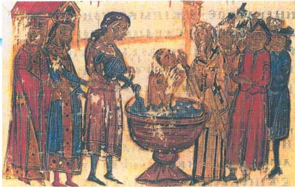
Ἡ βάπτισις τοῦ ἡγεμόνα τῶν Βουλγάρων Βόριδος (μικρογραφία τοῦ «Χρονικοῦ» τοῦ Κωνσταντίνου Μανασσῆ, Ρώμη, Βατικανή Βιβλιοθήκη).