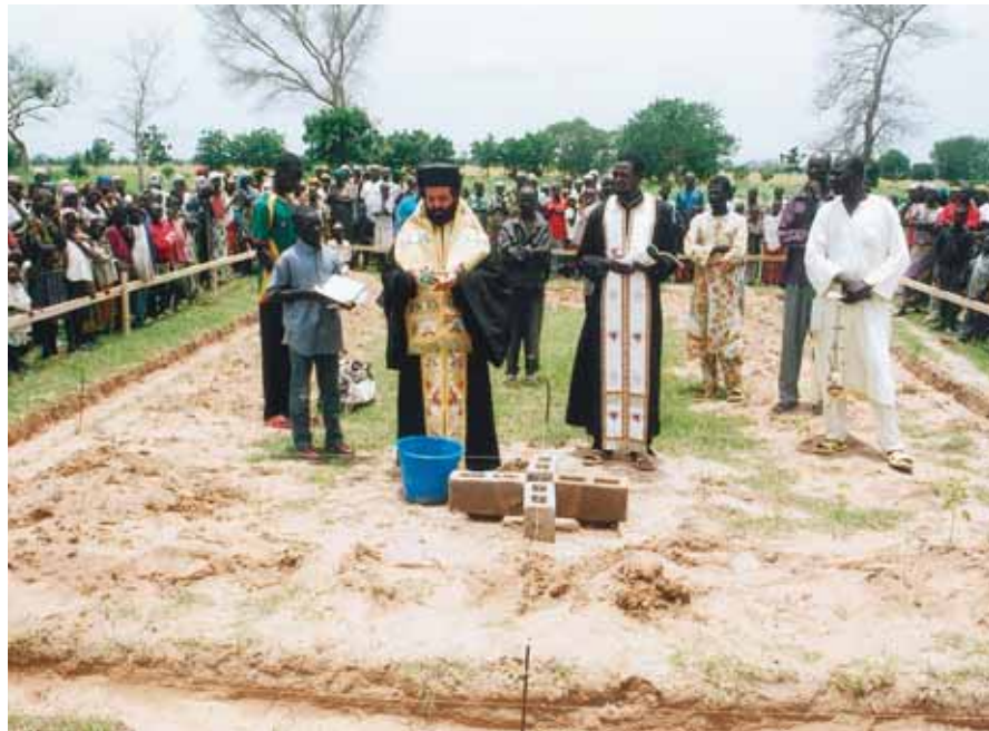
Θεμέλιος λίθος στην ένορία του άγιου Σπυρίδωνος Viri (B. Καμερούν).

Μπόζο Ιωάννη 25 • Μπόζο Σταύρο 25 • Μπουγιά Δημ. 30,50 • Μπουζάκη Γεώργιο 50 • Μπουζάνη Σοφία 110 • Μυλωνά Μαρία 600 • Ναθαναήλ Έλευθερία 50 • Ναό Άγ. Γεωργίου Διονύσου 50 • Ναό Άγ. Δημητρίου 72,80 • Νταντή Μαρία 60 • Ντόκα Περσεφώνη 300 • Ο.Χ.Ε.Κ. Ν. Ίωνίας - Ν. Ήρακλείου 170 • Όρφανίδη Άντίπατρο 20 • Παιδοβρεξάκη Ιωάννα 50 • Παναγιωτόπουλο Γεώργιο 300 • Παναγιωτοπούλου Θεανώ 50 • Πανελ. Όρθ/ξος Φιλ. Σύλλογος 200 • Παντζόπουλο 60 • Παντογιού Παρασκευή 120 • Παπαβασιλείου Άθανάσιο 30 • Παπαδά Δημ. 100 • Παπαδάκη Κωνστ. 100 • Παπαδάκη Μαρία 10 • Παπαδημητρίου Άννα 300 • Παπαδιά Μαρία 45 • Παρίση Παναγιώτη 500 • Πατρινού Ειρήνη 20 • Παυλή Κασσάνδρα 1.500 • Παχιό Ιωάννη 25 • Παχιού Άγγέλα 25 • Πετρόπουλο Γεώργιο 50 • Πιτσάκη Άλεξάνδρα 20 • Ποτέα Γεώργιο 30 • Ρανούτσο Χαράλαμφο